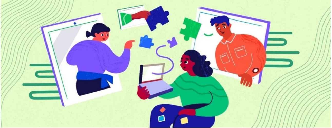
Ryhmässä verkossa