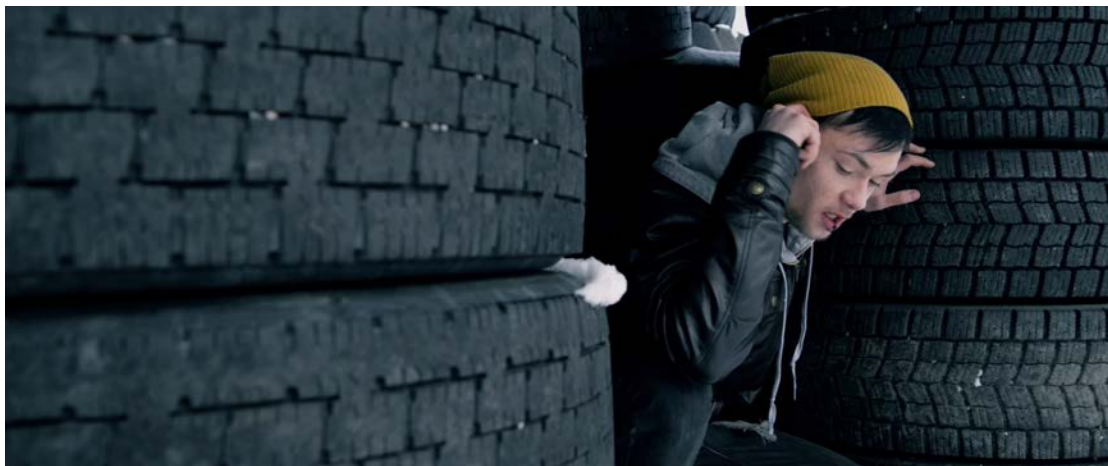
Bild 1 beskriver ett av de första problemen vi stötte på under inspelningarna. När vi skulle filma började det snöa. För att hålla kontinuitet kunde vi inte visa att det snöade och kunde därför inte visa någon helbild. Ett stort tyg användes för att blockera snön. Som de flesta dagtidsscener i filmen har endast befintligt ljus använts. Bildkompositionen tycker jag att fungerar bra och bildäcken ger en intressant struktur.