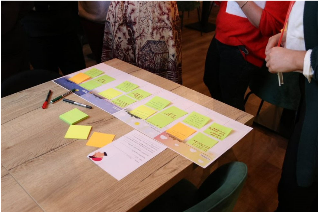
Kuva 2. KIELO -hankkeen työpaja toteutettiin palvelumuotoilun keinoin.