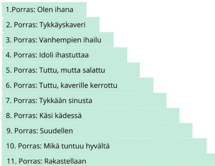
Kuvio 1. Seksuaalisuuden portaat