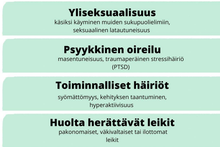
Kuvio 2. Yläkäsitteet