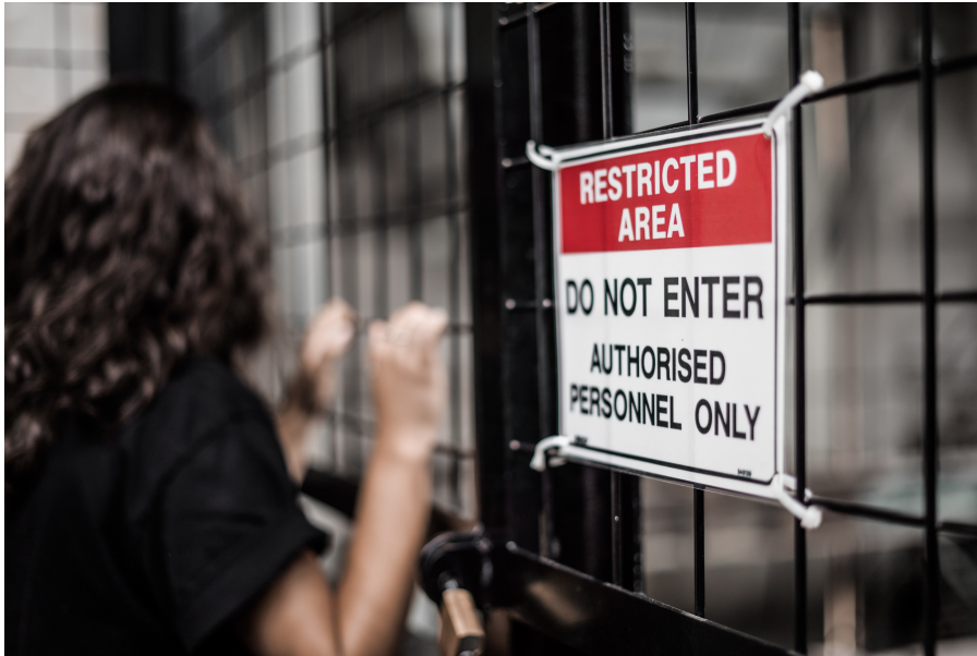
Kuva 2. Käyttörajattuun kokoelmaan luodaan pääsy IP-perusteisesti.