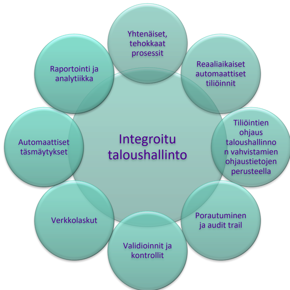
KUVIO 1. Integroitu taloushallinto. (Kaarlejärvi & Salminen 2018, 45 muokattu)

Integroitu taloushallinto ei koske kuitenkaan vain yrityksen omia järjestelmiä, toimintoja tai työntekijöitä vaan siihen liittyvät oleellisesti myös yrityksen sidosryhmät, kuten viranomaiset, asiakkaat, toimittajat sekä alihankkijat. Kuvio 1 kuvaa tätä integraation kokonaisuutta. Integraatio mahdollistaa liikkumisen eri sovellusten välillä ja tiedon jäljittämisen porautumalla tapahtuman taustalta löytyviin tapahtumiin. Reaaliaikainen tiedonkulku paitsi ERP-järjestelmän sisällä, myös sen liittymillä ja rajapinnoilla, on yrityksen toiminnan edellytys. Integroidut järjestelmät kattavat parhaimmillaan yrityksen kaikki toiminnot ja suurin osa kirjauksista syntyy integraation kautta. (Kaarlejärvi & Salminen 2018, 43.)