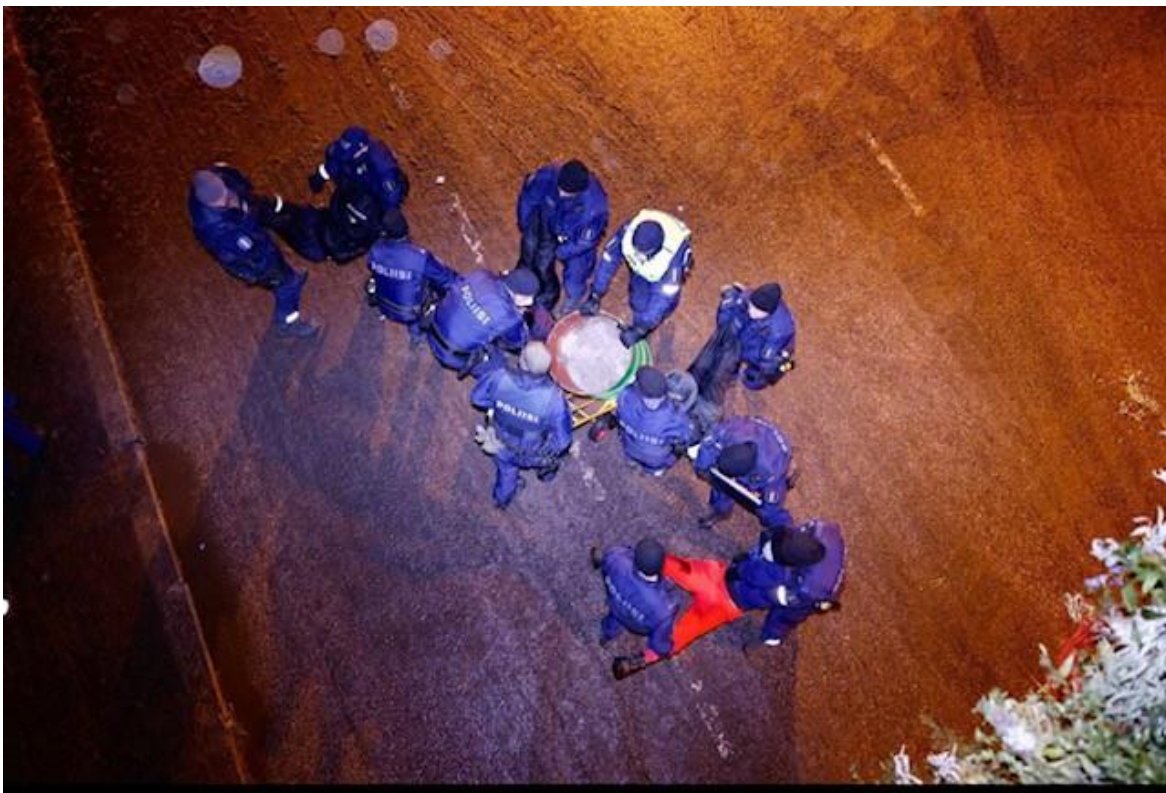
Kuva 3. Poliisit kantamassa mielenosoittajien muodostamaa ihmisketjua.