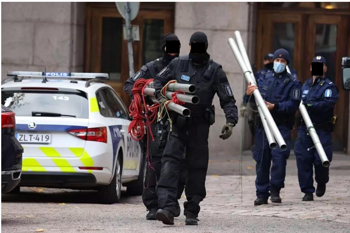
Kuva 1. Kuvassa näkyy, kun joukkojenhallintapoliisit kantavat aiemmin mainittuja Elokapinan käyttämiä telineitä pois paikalta raivauksen jälkeen.

Paljon mediahuomiota saanut ympäristöliike Elokapina työllisti joukkojenhallintapoliisia Helsingissä useita kertoja vuoden 2021 aikana. Tapausesimerkkinä tässä työssä käytetään Elokapinan mielenilmaisua Helsingissä syyskuussa 2021, jolloin Elokapinan jäsenet kahlitsivat itsensä Valtioneuvoston linnan edustalle. Mielenosoittajat olivat liimanneet itsensä kiinni rakennuksiin sekä kahlinneet itsensä putkilla toisiinsa. Tapauksessa nähtiin myös kolmesta alumiinisesta putkesta rakennettuja telineitä, joissa roikkui aktivisteja (kuva 1). Muutama mielenosoittaja oli lukinnut itsensä polkupyörän lukolla Valtioneuvoston linnan oveen. Poliisi otti paikalta kiinni 51 henkilöä ja joutui mekaanisesti murtamaan kahlitsijoiden kiinnitykset hyödyntäen tämän opinnäytetyön produktiosan aiheena olevaa raivausajoneuvoa. Poliisi ei kuitenkaan tarkentanut medialle, miten ja millä välineillä kahlitsijat irrotettiin Valtioneuvoston linnan edustalta. (Ylen uutinen 29.9.2021.)