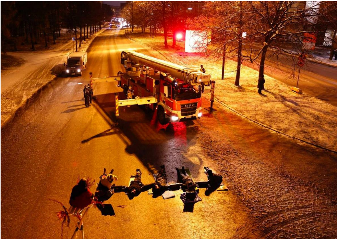
Kuva 2. Pelastuslaitoksen yksikkö antamassa poliisille virka-apua Helsingissä 11.12.2021. Kuvassa myös poliisin raivausajoneuvo takavasemmalla.