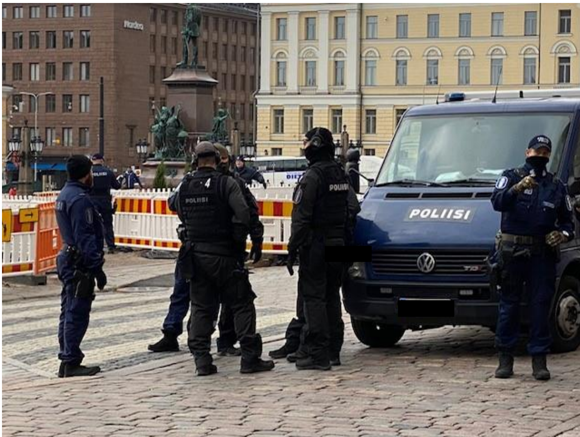
Kuva 4. Kuvassa Helsingin poliisilaitoksen raivausajoneuvo ja JOUHA- poliiseja.

Näiden tapahtumien perusteella voidaan päätellä, että mielenilmauksissa tehdään myös rikoksia eivätkä kaikki mielenosoitukset suju rauhanomaisesti. Tulevaisuudessa mielenosoituksissa tullaan näkemään yhä enemmän turvallisuusuhkia yleiselle järjestykselle ja turvallisuudelle. Tämä tulee johtamaan siihen, että joukkojenhallintatehtävät ja raivaamista vaativat tehtävät tulevat kasvattamaan poliisin työmäärää tulevina vuosina.