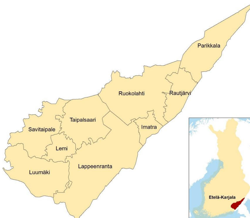
Kuva 1. Etelä-Karjala kartalla (Etelä-Karjalan liitto).

Etelä-Karjala on Kaakkois-Suomessa sijaitseva maakunta. Etelä-Karjalan viereiset maakunnat ovat Kymenlaakso, Etelä-Savo sekä Pohjois-Karjala. Idässä naapurina on Venäjä. Maakunta muodostuu yhdeksästä kunnasta (kuva 1): Lappeenranta, Lemi, Savitaipale, Taipalsaari, Luumäki, Ruokolahti, Imatra, Parikkala ja Rautjärvi (Etelä-Karjalan liitto, tietopankki).