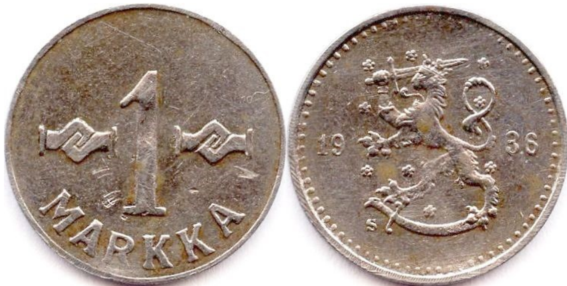
Kuva 4. Fantasiahybridiraha, jonka arvo puoli on vuoden 1952 pikkumarkan ensimmäistä tyyppiä ja tunnuspuoli on 25-pennisen tunnuspuoli vuosiluvulla 1936.

Eli joskus se halpojenkin rahojen tutkiminen saattaa tuottaa mojovia yllätyksiä. Siispä syksyn sateiden piiskatessa ulkona ja viruksen väijyessä julkisissa sisätiloissa on eräs turvallinen tapa viettää vapaa-aikaa käymällä läpi tutkimusmielessä halpojen rahojen pussukoita ja laatikoita!