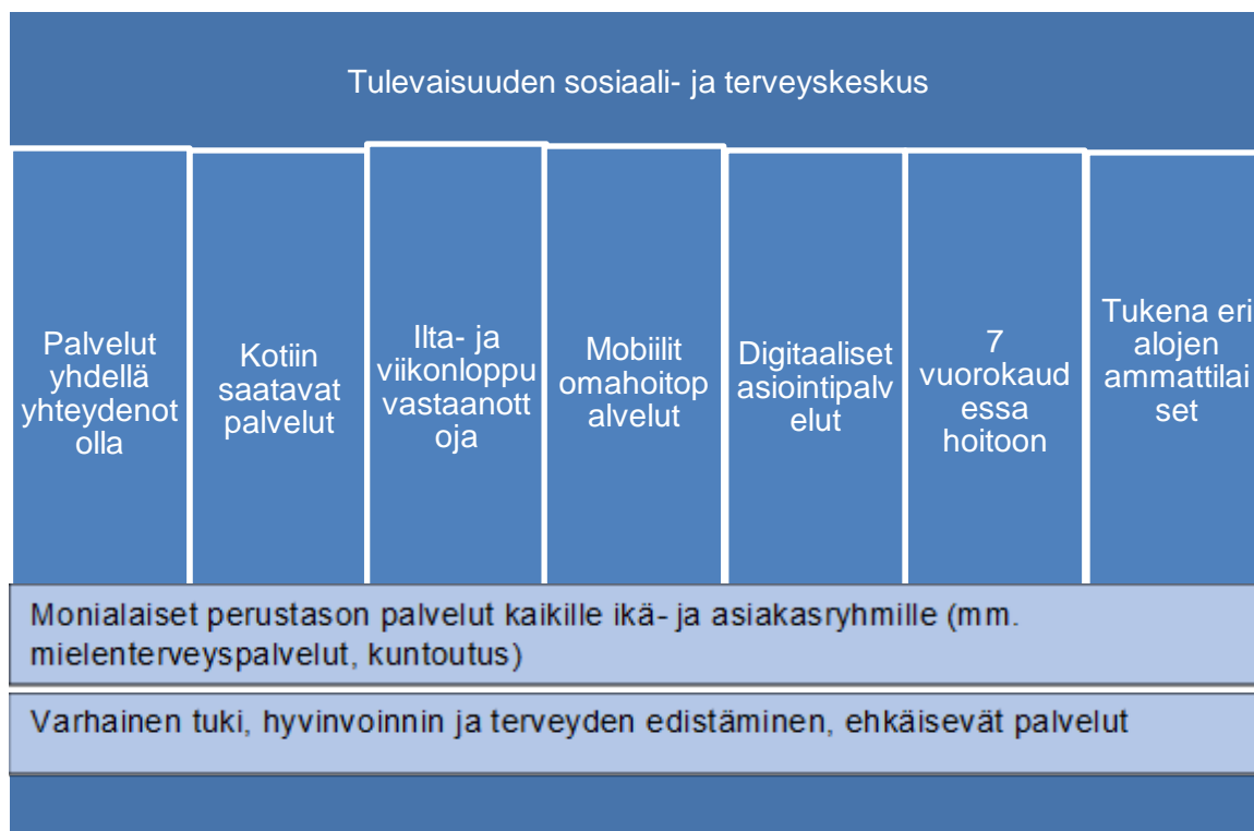
Kuvio 3. Visio laaja-alaisesta sosiaali- ja terveyskeskuksesta (Sosiaali- ja terveysministeriö 2021, 13)

Sosiaali- ja terveyskeskuksen kehittämistyötä tarkastellaan kokonaisuutena (Kuvio 3), jossa tunnistetaan erilaiset asiakasryhmät ja niiden voimavarat sekä erilaiset verkostoryhmät (Sosiaali- ja terveysministeriö 2021, 13).