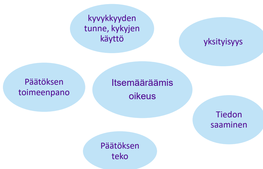
Kuvio 2. Topo 2013. Itsemääräämisoikeuteen liittyvät ulottuvuudet

Tuetussa päätöksenteossa kehitysvammaisella henkilöllä on tukihenkilö tai useampi tukihenkilö, jotka auttavat erilaisten päätösten tekemisessä. Tukihenkilönä voi toimia esimerkiksi joku läheinen, ystävä tai vaikka virkamies. Kehitysvammaisen henkilö tekee päätöksensä itse, mutta hän saa tukihenkilöltä tukea ja apua. Valintojen ja päätösten tekeminen voi olla vaikeaa, tukihenkilö voi tuoda asian helpommin hallittavaksi. (THL 3.9.2019 nettisivu.) Kehitysvammaisen henkilö saattaa tarvita tavanomaista enemmän apua ja tukea tehdessään ratkaisuja ja valintoja asioissaan. Erityisesti sellaisessa päätöksenteossa, mitkä liittyvät asumiseen. Asumiseen liittyen kehitysvammaiselle henkilöllä, kuten muillakin, voi epärealistisia ajatuksia, miten pärjää yksin asuessaan. Siksikin on tärkeää, että henkilöt saavat tukea ja ohjausta asioiden hoitamisessa ja heitä tuetaan tekemään päätöksiä, myös tilanteissa, kun asiat ovat menneet pieleen.