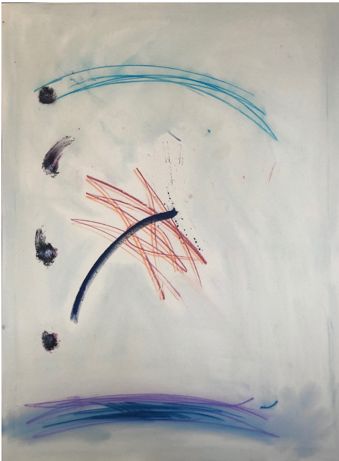
Pakko (kuva 2)