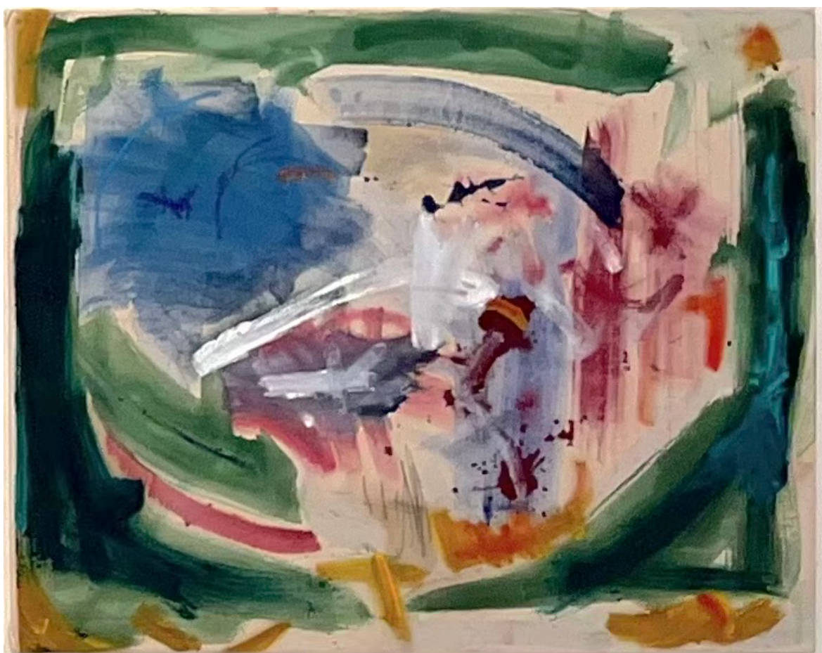
Torjuttu (kuva 3)

Torjuttu (kuva 3) on 85x 90 cm kokoinen maalaus tehtynä kankaalle. Materiaalina on öljyväri, pigmentti ja lyijykynä. Työ muuttui spontaanisti ja sai uusia merkityksiä sitä tehdessä. Se näyttää jotain mielessä torjuttua ja jotain, missä olin epävarma rehellisyydestä. Työssä on paljon elementtejä ja yksityiskohtia. Mukana on jotain suunnittelematonta ja odottamatonta. Odottamattomuus on yksi osa prosessiani. Yllätyn monesti itsestäni siitä mihin pyrin ja mitä motiiveja minulla on maalata. En tiedä lähes koskaan mihin työ päättyy. Tämän työn päätin kolmesti.