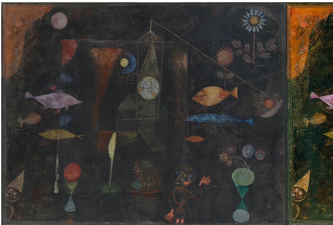
(Kuva 2) Paul Klee. 1925. Fish Magic. Öljy kankaalle. 77.2 x 98.4 cm.

(45, 1966.) Kaikkien pitää seurata omaa sisintänsä oli se sitten fantasia, uni tai idea. Jos se on ykseydessä oikeiden luovien keinojen kanssa. Ne nostavat elämän keskinkertaisuudesta ja näyttävät salaisen vision. (51, 1966.)