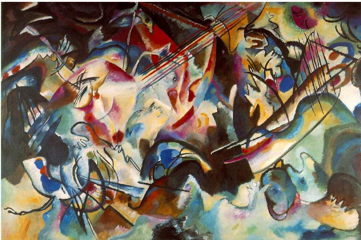
(Kuva 1) Vassily Kandinsky. Composition VI. Öljy kankaalle. 195x 300 cm.