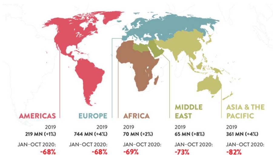
Kuvio 3. Kansainvälisten turistien saapumiset tammi-lokakuussa 2020 (UNWTO 2020)

Kansainväliset rajoitustoimet Korona pandemian aikana näkyvät kansainvälisten ja kotimaan matkailijoiden merkittävänä vähenemisenä. Matkailuala on yksi aloista, joka on kärsinyt eniten kysynnän voimakkaasta laskusta Covid-19-pandemian ja siihen liittyvien rajoitusten vuoksi. Maailman matkailujärjestön UNWTO:n mukaan kansainvälisten matkailijoiden määrä Covid-19-pandemian alkuvaiheessa tammi-lokakuussa 2020, väheni yli 72 prosenttia. Tämä prosenttimäärän lasku tarkoittaa, näinä kymmenenä kuukautena yli 900 miljoonaa ulkomaalaista turistia vähemmän kuin samana ajanjaksona vuonna 2019. Kuvio 3. selventää ulkomaalaisten vierailijoiden vähenemistä, tänä tietynä ajanjaksona, eri maanosittain. Tilastoista käy hyvin ilmi se kuinka vaikutukset kansainvälisten turistivirtojen vähenemisessä ovat olleet laaja-alaiset kaikkialla maailmassa. (UNWTO 2020; CCSA 2020.)