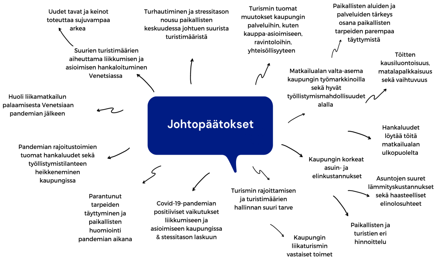
Kuvio 4. Ajatuskartta tutkimuksen johtopäätöksistä