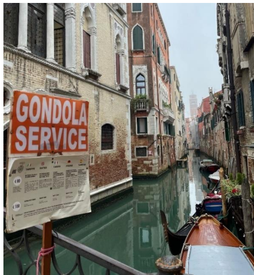
(Kuva 3. Vesibussi Venetsian Grand Canalessa, Kuva 4. Gondolipalveluita Venetsian kanaalissa (Anni Ikävalko 2021)

Venetsian tunnetuimmat nähtävyydet ovat suuria vetovoimatekijöitä kaupungille. Tunnettu Grand Canal, suurin kaupungin kanaaleista sekä sen ylittävä Venetsian kuuluisin silta Rialto kuten myös Pyhän Markuksen aukio ja Pyhän Markuksen kirkko lukeutuvat Venetsian päänähtävyyksiin. Dogen ja Ca d'Oro-palatsit sekä kaupungin lukuisat museot ja muistomerkit ovat turistien eniten vierailemia paikkoja Venetsiassa. (Britannica 2021b; Tripadvisor 2021.)