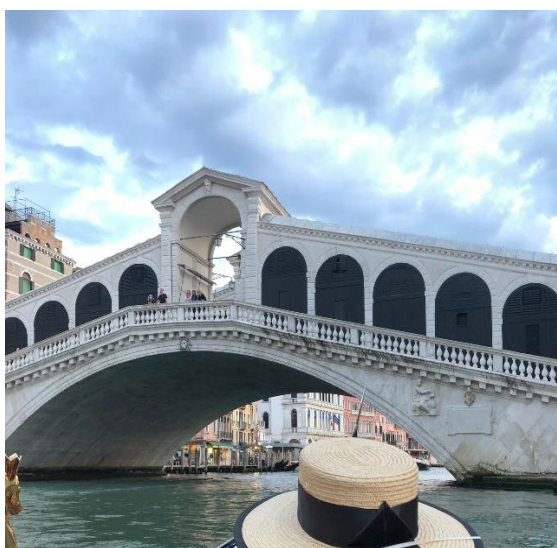
Kuva 5. Rialton silta, Kuva 6. Pyhän Markuksen tuomiokirkko

Saaret Murano ja Burano sijaitsevat vain lyhyen venematkan päässä Venetsian historiallisesta keskustasta. Burano on värikkäistä taloistaan, kalastuksesta sekä pitsinvalmistuksesta tunnettu pieni saari. Kuva 7 esittelee perinteisen katukuvan Buranon saarelta.