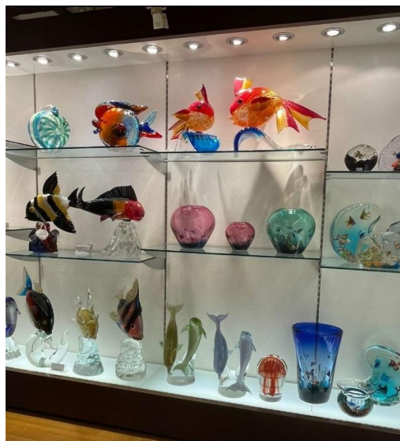
Kuva 7. Buranon saaren värikkäitä taloja, Kuva 8. Lasitaidetta Muranon Ferro & Lazzarini lasitehtaassa (Anni Ikävalko 2021)

Venetsian pitkälle ulottava historia ja taide heijastuvat kaupungin nähtävyyksiin ja arkkitehtuuriin. Historian, taiteen ja kulttuurin janoisille Venetsiassa riittää koettavaa. Kaupungissa sijaitsee mittaamattoman suuri määrä taiteen mestariteoksia ja arkeologisia saavutuksia menneiltä ajoilta. Loputtomat eurooppalaisen huipputaiteen kokoelmat ovat nähtävissä useissa museoissa ja nähtävyyksissä. Myös nykytaide ja monet muut taiteenlajit kuostavat kaupungissa. Venetsian kulttuuritapahtumat houkuttelevat vierailijoita kaupunkiin. Maailmankuulut Venetsian kansainväliset elokuvafestivaalit, karnevaalit sekä bienaali nykytaiteen foorumi ovat kaupungin tunnetuimpia kulttuuritapahtumia. (Turismo Venezia 2021; Comune Venezia 2021; Matkalla Maailmalla 2021; Venice Welcome 2021.)