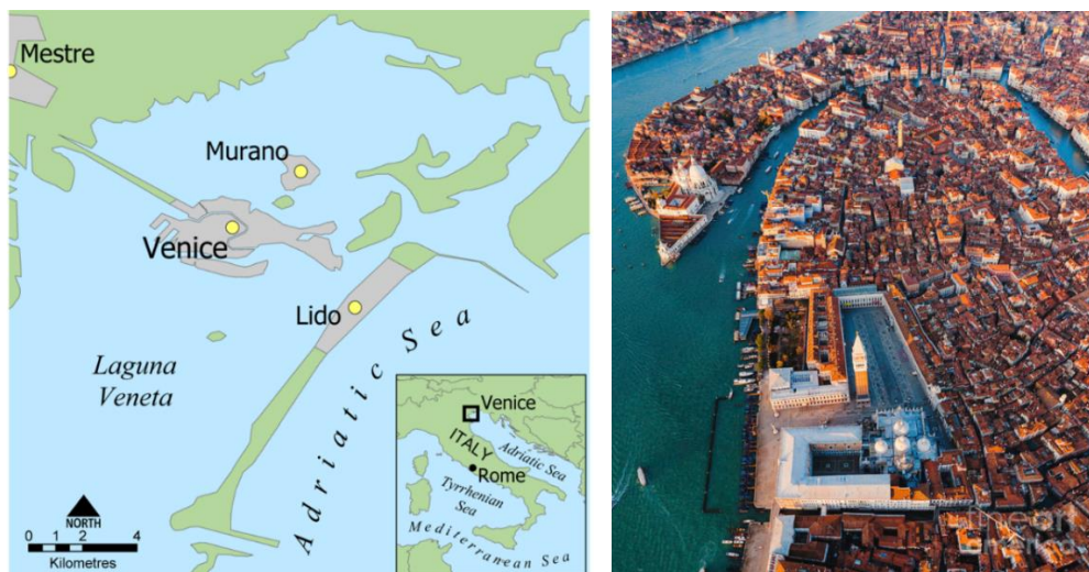
Kuva 1. Venetsian laguunin kartta (Floodlist 2018), Kuva 2. Ilmakuva Venetsiasta (Columbo 2021)

Venetsia on Koillis-Italiassa Veneton alueella sijaitseva merkittävä satama sekä pääkaupunki. Kaupunki on rakennettu aivan Adrianmeren rannalle, puolikuun muotoiseen laguuniin. Poikkeuksellinen sijainti laguunissa, on synnyttänyt kaupungin, joka koostuu 118 saaresta. Kuva 1. esittelee Venetsian laguunin kartan, johon lukeutuu Venetsian historiallinen kaupunki sekä sitä ympäröivät saaret (Kuva 1.) Näille lukuisille saarille rakennetun kaupungin yhdistää useiden kanavien ja siltojen verkosto. Venetsian historiallisen kaupungin suurin kanava Grand Canal, virtaa aivan kaupungin keskellä erottaen sen kahteen osaan. Kuvassa 2. näkyy ilmakuvaa Venetsian kaupungista sekä sen läpi virtaava Grand Canal (Kuva 2.) Tämän historiallisen kaupungin lisäksi, laguuniin lukeutuu myös monia muita suurempia saaria, joista tunnetuimpia ovat Lido, Murano ja Burano sekä San Michele. Näiden pitkien ja kapeiden saarten jono erottaa Venetsian avomerestä. (Matkailu-opas 2021; Visiting Venice 2021.)