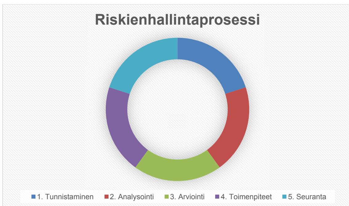
Kuvio 1. Riskienhallintaprosessi (Horvat 2020)

Riskienhallinta on prosessi, joka jaetaan tässä tutkimuksessa viiteen erilliseen osa-alueeseen, jotka auttavat muodostamaan laajemman kokonaiskuvan siitä, mistä riskien hallinnoimisessa on kyse ja miten riskit kohdataan (Horvat 2020).