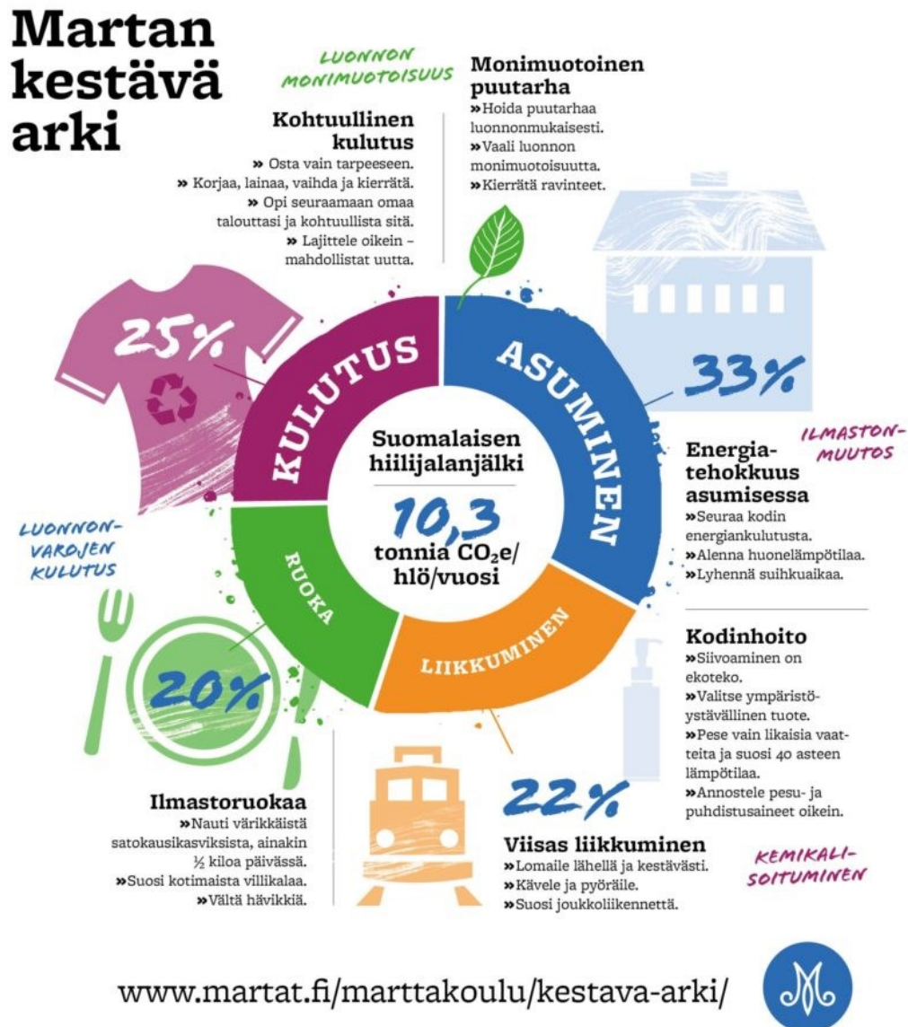
Kuva 1. Kestävä arki muodostuu arkipäiväisistä valinnoista (Marttaliitto, 2020).

Lähteet: Sitra. Keski- ja eteläsuomalaisen hiilijalanjälki. Tilastokeskus, Motiva, Luonnonvarakeskus, Liikennevirasto, VTT, SYKE, ENVIMAT, maa- ja metsätalousministeriö, D-mat oy.