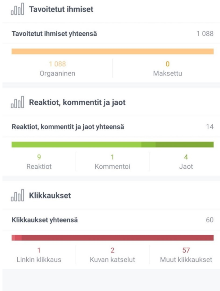
Kuva 5. Facebook-ilmoittelun tavoittavuus (Facebook, henkilökohtainen tiedonanto, 16.2.2022).

Suusta suuhun tai muissa omissa sosiaalisissa verkostoissa kulkeva tieto oli siis tämän kokemuksen perusteella selkeästi paras tapa kutsua uusia ihmisiä mukaan marttatoimintaan. Tätä tietoa pyrittiin hyödyntämään jo heti toimintaryhmän kokoontumisten käynnistyttyä kannustamalla jokaista uutta jäsentä kutsumaan mukaan omia ystäviä ja tuttavvia. Myös toimeksiantajan kannattaa hyödyntää opinnäytetyöstä saatua kokemusta jatkossa jäsenhankinnassaan. Yhdistysten jäseniä voisi kannustaa aktiiviseen suositteluun omissa ystäväpiireissään ja muissa sosiaalisissa verkostoissaan. Myös esimerkiksi markkinoilla ja kahvituksissa kannattaa jatkossakin kertoa toiminnasta juttelemalla ihmisille ja kutsumalla heitä henkilökohtaisesti tutustumaan yhdistysten toimintaan. Mikäli ilmoittelua halutaan kuitenkin edelleen tehdä myös lehdissä, tai esimerkiksi Kymenlaakson Marttojen sosiaalisen median kanavilla, niissä todennäköisesti kannattaisi panostaa kohdennettuun, maksulliseen