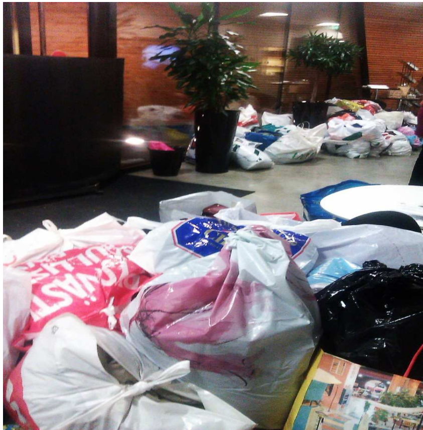
KUVA 2. Ihmisten lahjoittamia vaatteita Kappelin aulassa