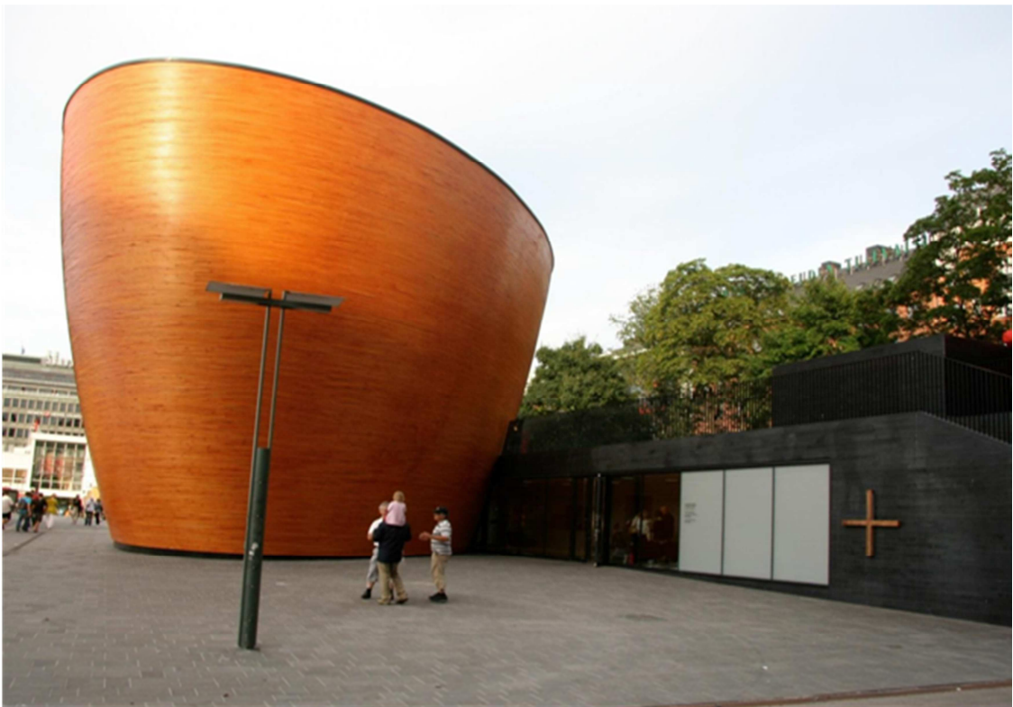
KUVA 1. Kampin kappeli

Kampin kappelin työstä on tähän mennessä tehty vain kaksi raporttia. Toiminnan alkuvaiheesta on tehty toimintatutkimus ja syksyllä 2013 asiakaskyselyn pohjalta raportti, joihin viitataan tässä tutkielmassani. Kampin kappelissa (Kuva 1) käy noin 30 000 kävijää kuukaudessa. Viiden kuukauden seuranta-ajalla kaksi sosiaalityöntekijää ja kaksi sosiaaliohjaajaa kävi noin sata ammatillista keskustelua kuukaudessa. Koko kävijämäärästä helsinkiläisiä oli kävijäkyselyn perusteella noin 40 % ja sosiaalityön keskusteluapua tarvinneista kävijöistä 80 %. Kävijäkyselyyn vastanneista oli miehiä 37 % mutta sosiaalityön keskusteluja käyneissä miesten osuus oli peräti kolme neljänestä. Keskusteluavun painottuminen miehiin näkyy myös pidemmän aikavälin seurannassa, mikä ei ole sosiaalialalla tyypillistä. (Männistö 2013, 2.)