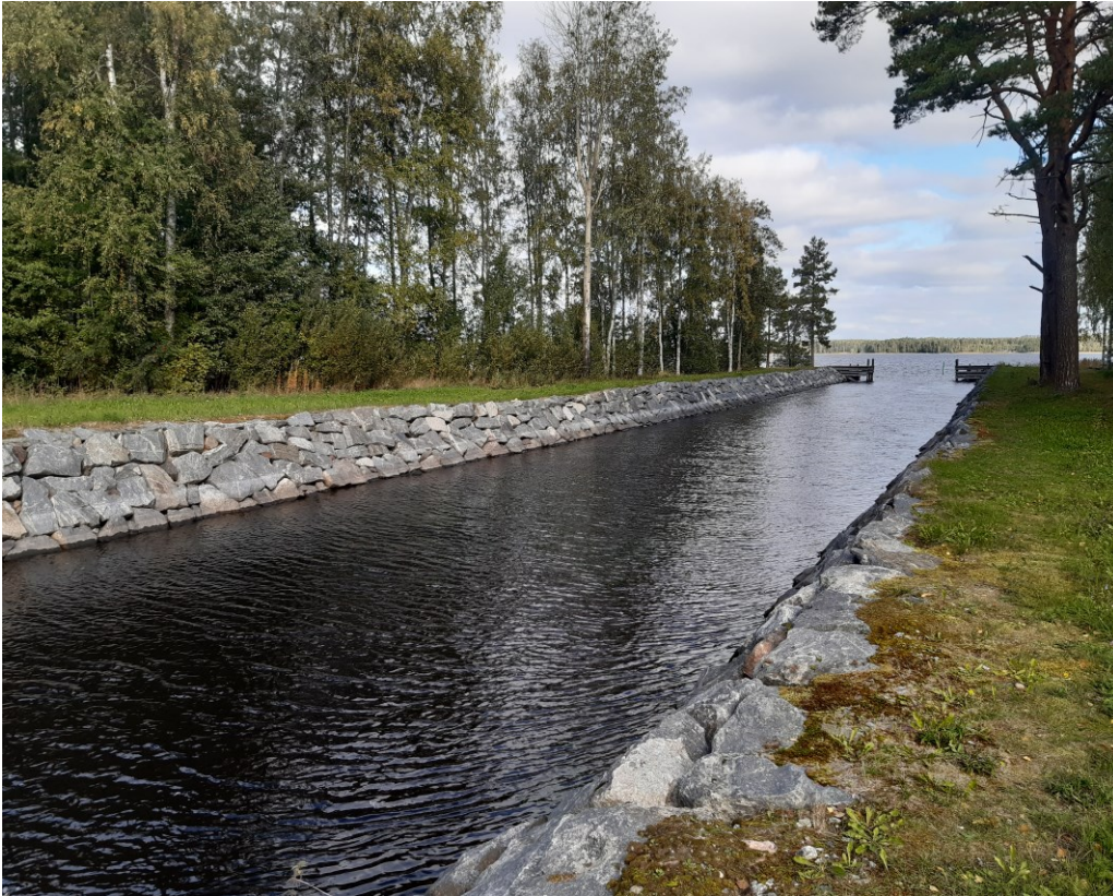
Kuva 7. Telataipaleen kanava. Kanavan jälkeen näkyy sen itäpuolella sijaitseva Siikavesi. 17.9.2021.