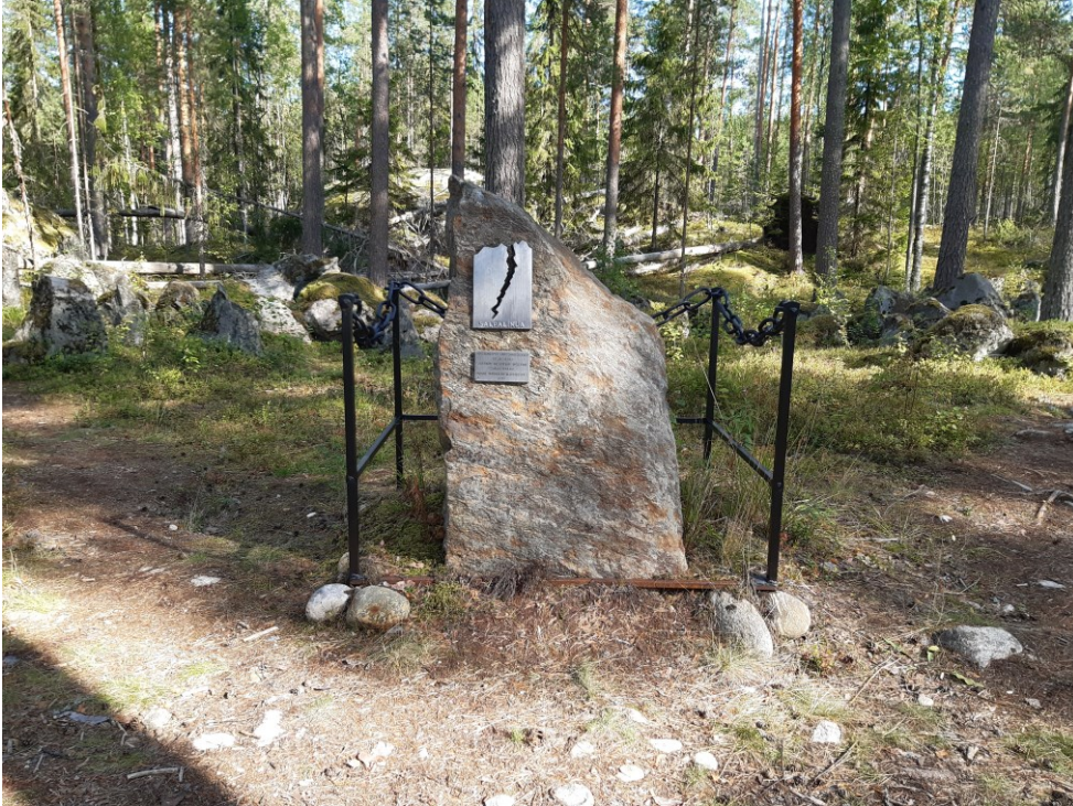
Kuva 4. Vilkaharjun Salpalinjan panssariesteiden muistomerkki. 31.8.2021.