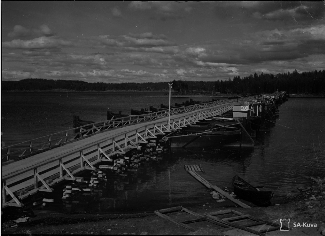
Kuva 6. Vekaransalmessa oli jatkosodan aikaan armeijan rakentama pontoonisilta. 6.7.1941.