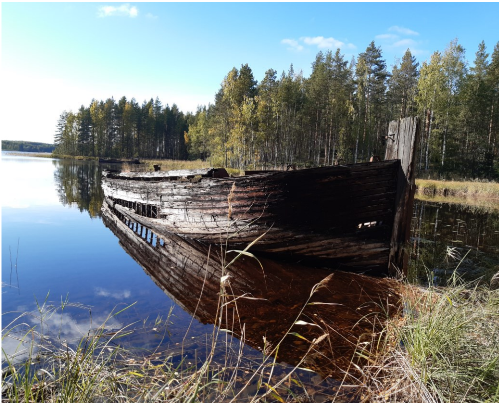
Kuva 8. Lotja Hopeasaaren rannassa. 21.9.2021.

Annikinniemi on harjualueeseen kuuluva luontokohde, jossa Saimaaseen työntyvän niemen sisälle on vedenpinnan laskun myötä jäänyt pieni lampi. Lammen rannalla on tulipaikka ja niemen kärjessä laavu sekä wc-tilat. (Sulkavan kunta d.) Annikinniemeen pääsee myös veneellä ja se on retkisaatama (VeneilySaimaa).