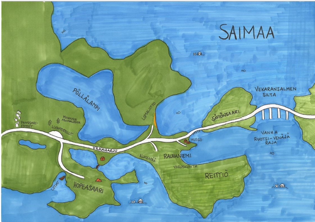
Kuva 2: Piirros Vekaransalmen maisematien osiosta Vilkaharju-Vekaransalmen silta. Piirros ei ole mittakaavassa. Piirtäjä: Annina Hulkkonen.