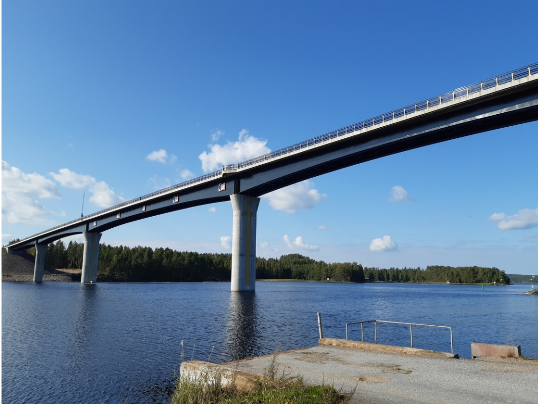
Kuva 5. Vekaransalmen silta kuvattuna vanhasta lossirannasta, salmen Lohilahden puolelta. 31.8.2021.