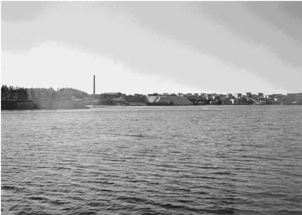
Kuva 3. Sahan aluetta järveltä päin 1936. Kuvan rakennuksista on jäljellä enää savupiipun vasemmalla puolella oleva rakennus.