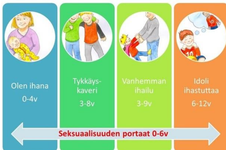
KUVIO 1. Seksuaalisuuden portaat 0–6-v. (Cacciatore n.d., 7).

Ensimmäinen “Olet ihana” -porras on ajankohtainen 0–4-vuotiaana. Lapsi rakastaa itseään ja hyväksyy itsensä ja maailman. Lapsi tutustuu omaan kehoonsa, kehon paikoille etsitään nimiä ja merkityksiä. Lapsen kiintymyssuhteen laadukkuus ja fyysinen kontakti vahvistavat itseluottamusta ja myönteistä kehonkuvaa. Varhainen vuorovaikutus, huolenpito ja turvallinen kosketus ovat tärkeimpiä. Ne rakentavat lapsen kykyä läheiseen ihmissuhteeseen koko elämän ajan. (Cacciatore & Korteniemi-Poikela 2019, 29–33.)