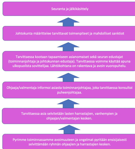
Kuva 2. (SVO 2022)