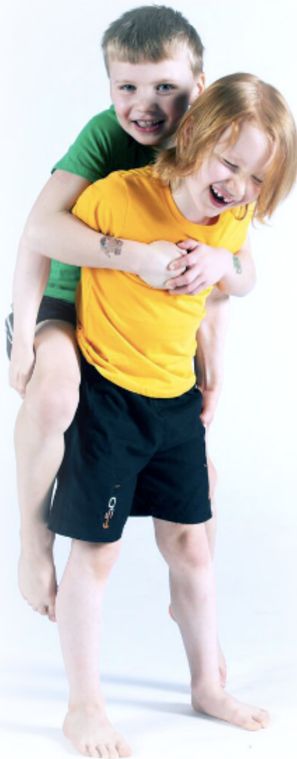
Kuva - Jari Mönkkönen