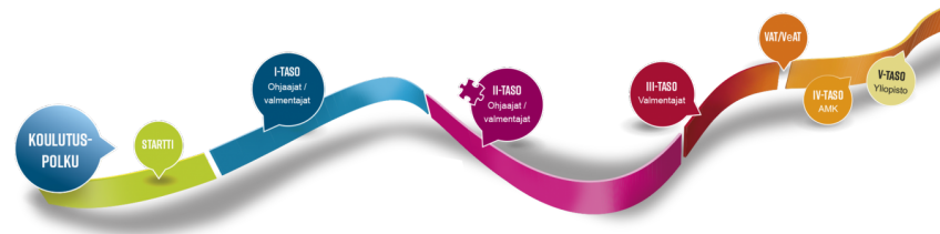
Kuva 3. (Suomen Voimisteluliitto 2021)

Suomen Voimisteluliitto järjestää lasten ja nuorten ohjaajille koulutusta 1-2-tasoilla. Jokaisen ohjaajan koulutuspolku (kuva 3) rakentuu yksilöllisesti, johon ohjaajan omat tavoitteet ja kohderyhmät vaikuttavat.