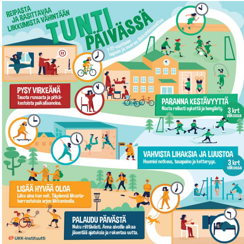
Kuva 1. Lasten ja nuorten liikkumissuosituksen keskeiset viestit (UKK-instituutti 2022b)

vittäin tulisi välttää runsasta ja pitkäkestoista istumista ja paikallaoloa. Päivittäinen vähäisempikin liikunta on hyödyllistä ja pysyvien liikuntatottumusten ja mielekkään harrastuksen löytämiseen tarvitaan liikkumisen iloa. (UKK-instituutti 2022a.)