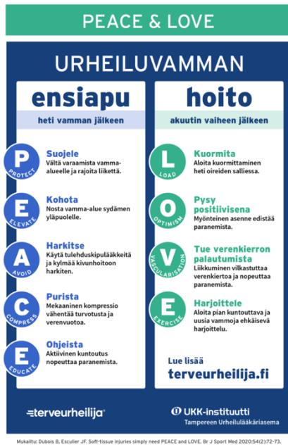
Kuva 4. Urheiluvamman PEACE & LOVE (Terveurheilija 2022)

Käsikirjan luku 2.7 on apuohjaajan yksittäisen työnkuvan kannalta tärkein infopaketti. Kappaleessa käydään läpi, mitä apuohjaajan tulee ottaa huomioon ohjattaessaan lapsia. Opin- näytetyön teoriatausta, kirjallisuuskatsaus ja lähdemateriaalit olivat tämän luvun lähtökoh- tana.