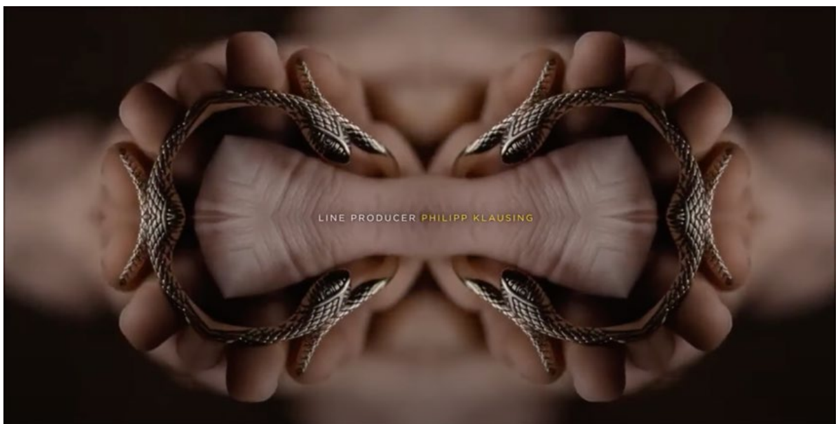
Kuva 5. Dark -sarjan 3. tuotantokauden intro. (Dark 2020)

Ryhmän montaasi-introt ovat tietyllä tavalla samantyyllisiä sisällöllisestikin. Erityisesti Darkin sekä The Chestnut Manin eli Kastanjamiehen introissa on samankaltainen tunnelma ja tyyllittely. Darkissa kuvat on leikattu montaasityylisesti, mutta kuvia on leikattu päällekkäin ja niissä on käytetty erimallisia peili- ja kaleidoskooppiefektejä (ks. Kuva 5). Sisällöllisesti Darkin intron kuvat ovat osittain sekä sarjan päähenkilöistä, tapahtumista että tapahtumapaikoista, mutta leikkaustyyli ja efektit tekevät kuvista vähemmän tunnistettavat. Kastanjamiehen introssa käytetty montaasileikkaus on perinteisempi, mutta myös siinä on käytetty erilaisia efektejä korostamaan tunnelmaa.