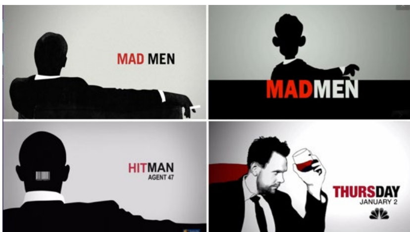
Kuva 1. Mad Men –televisiosarjan intro ja sitä jäljitelleet parodiat (McGregor 2020.)

Introa voisi sanoa televisiosarjan johdannoksi. Se tavallisesti esittelee katsojalle tuotannon nimen sekä tärkeimmät tekijät ja näyttelijät. Introt toimivat siis ikään kuin kirjojen kannet: ne kertovat lukijalle kirjan sekä kirjailijan nimen, mutta visuaalisin keinoin myös pyrkivät tekemään kirjasta houkuttelevan ja vakuuttamaan lukijan. Samalla tavalla intro kertoo katsojalle sen oleellisimman – eli mitä he ovat parhaillaan katsomassa, mutta lisäksi se alustaa sarjan tunnelmaa erilaisin audiovisuaalisin keinoin ja houkuttelee pitäytymään sarjan parissa. Intron perusteella voi päätellä, mitä genreä kyseinen ohjelma edustaa, vaikka katsoja ei tietäisi siitä etukäteen yhtään mitään. Intro ilmaisee katsojalle, mitä tuleman pitää paljastamatta kuitenkaan juonesta liikaa. Sen tarkoitus on antaa katsojalle pettämätön ensivaikutelma ja koukuttaa jo heti kättelyssä. (What-When-How.) Introt toimivat ikään kuin ”siltana” todellisen maailman sekä TV-sarjan kuvitellun maailman välillä, mahdollistaen sen, että tekijät pääsevät johdattelemaan katsojaa tuotantonsa rytmiin (Lambie 2011).