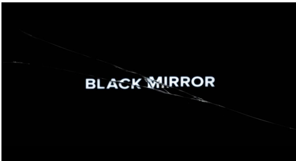
Kuva 4. Black Mirror –sarjan title card. (Black Mirror 2019)

Vaikka muutaman sekunnin title card tuntuu ajatuksena siltä, ettei se voi olla kovin mieleenjäävä, on moni tuotanto todistanut tämän vääräksi. Lyhyt intro ei välttämättä siis tarkoita huonoa introa. Tästä hyvä esimerkki on Charlie Brookerin luoma Netflix-alkuperäissarja Black Mirror, jonka ensimmäinen tuotantokausi julkaistiin vuonna 2011. Black Mirrorin intro on alle 10 sekuntia pitkä, mutta sen visuaalisuudeltaan suhteellisen yksinkertainen logoanimaatio ja taidokas äänisuunnittelu jättää syvän vaikutuksen ja kertoo paljon sarjan pahaenteisesta tunnelmasta. Introsta voi myös havaita synkkään tulevaisuuteen viittaavaa tematiikkaa ääni- sekä visuaalisten efektien kautta. Title cardin intensiivisen logopaljastuksen lopuksi ruudun päälle tulee särö lasinsärkymisen äänen saattelemana (ks. Kuva 4). Tämä rikkoo intron tiivistyvän tunnelman ja enteilee myös sarjan vinksahtaneita tulevaisuudennäkymiä. Oikeilla sisällöllisillä ja audiovisuaalisilla ratkaisuilla myös lyhyt title card –intro voi täyttää intron alkuperäiset tavoitteet ja tehtävät.