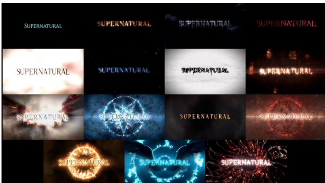
Kuva 2. Supernaturalin tuotantokausien 1–15 intro (Ashley 2021.)

Jotkin sarjat vaihtelevat intron sisältöä ja/tai tyyliä sarjan aikana. Monella sarjalla vaihtelua nähdään tuotantokausittain. Esimerkiksi Eric Kripken luomassa Supernaturalissa (2005–2020) intron tyyli uusittiin jokaisella tuotantokaudella (ks. Kuva 2). Harvinaisempaa, muttei täysin tavatonta, on se, että sarjan introssa on jopa jaksoittaista vaihtelua. Toisinaan vaihtuvuus introssa indigoii jakson juonesta jotakin. Jälleen kerran tästä hyvänä esimerkkinä toimii Supernatural, jonka erilaiset teemajaksot tunnistetaan niille erikseen tehdyistä jakson teemaan sopivista introista (Ks. Kuva 3). Myös esimerkiksi Game of Thronesin introssa voi havaita jaksoittaista vaihtelua, kun intron 3D-animaationa toteutetussa kartassa esitellyt paikat vaihtuvat jakson tapahtumapaikkojen perusteella.