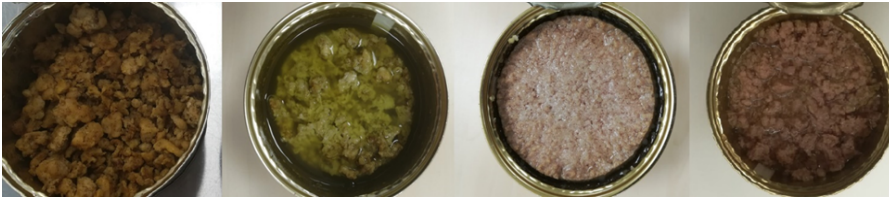
Kuva 1. Vasemmalta oikealle: 1. laboratorioskerta suolalaukalla, 1. laboratorioskerta öljyssä, 4. laboratorioskerta suolalaukalla ja nitriitillä, 5. laboratorioskerta suolalaukalla ja nitriitillä.

Valmistettujen säilykkeiden F-arvot jäivät välille 2,2 - 4,9. Säilykkeiden sterilointi ei ollut riittävä kaupallisiin tuotteisiin. F-arvot laskettiin dataloggerien ja viidennellä kerralla dataloggerin ja termoparin keräämän lämpötilatiedon pohjalta. Viidennen kerran F-arvoissa ero mittaustavoilla oli, dataloggerin antaessa arvon 4,4 ja termoparilla mitattuna 4,9. (Sihvonen 2020, 49).