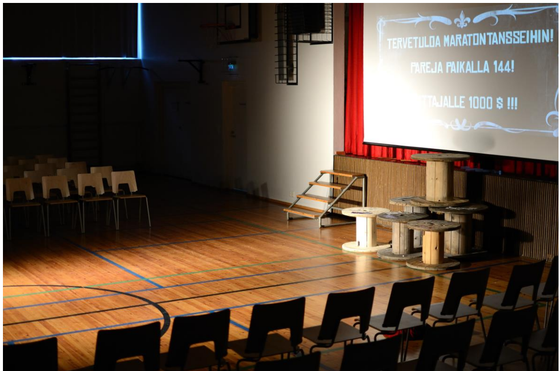
Kuvio 9. Valmis näyttämökuva. Talvi 2014.