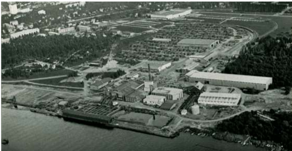
Kuva 3. Rauma-Repolan aikainen näkymä 1970-luvulta. (Kuva: Eino Jokinen).

Eino Jokisen ottaman kuvan mukaan oikealla puolella on vain seitsemän ikkunaa(kuva 3). Uudempia kuvia ei ole oikeasta puolesta ja kuva on otettu niin kaukaa, että oli onni, että kuvien laatu oli tiff-muodossa tarkempaa zoomaamista varten.