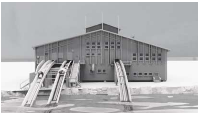
Kuva 10. Ambient Occlusion versio.

Pixxo 3D käyttää tutoriaalissaan AO:ta jälkeinpäin tehtävänä toimenpiteenä. Hän aktivoi Ambient Occlusionin Properties-valikon kohdasta View Layer Properties. Siellä on kohta Passes, jonka alta löytyy kohta Light eli valaistus. Passesit ovat tehokeinoja, jotka tehdään renderoinnin jälkeen tuodakseen kuvaan lisää syvyyttä. (Blender Manual). Valaistus-valikon alta löytyy kohta Ambient Occlusion. Sen jälkeen hän renderoi kuvan ja luo samalla Ambient Occlusion noden, jota hän käyttää Compositing-työtilassa. Työtilassa ei näy renderoitua kuvaa, koska oletuksena työtilassa on pois painettuna Use Nodes. Kompositointi-työtilassa on tärkeää nähdä kuva, johon tehdään muutoksia. Tähän on olemassa node nimeltä Viewer, jonka lisäämällä saadaan työstettävä kuva node-editorin taustalle. Node-editorissa on AO kohta, jonka liittämällä Image noden kanssa joko composite-nodeen taikka Viewer-nodeen. Kaikki mitä asettaa Composite-nodeen, tulee näkymään myös valmiissa kuvassa.