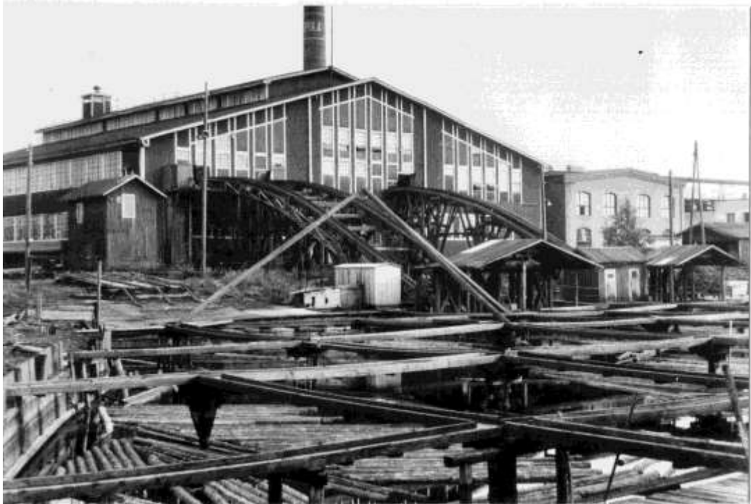
Kuva 9. Penttilän saha.