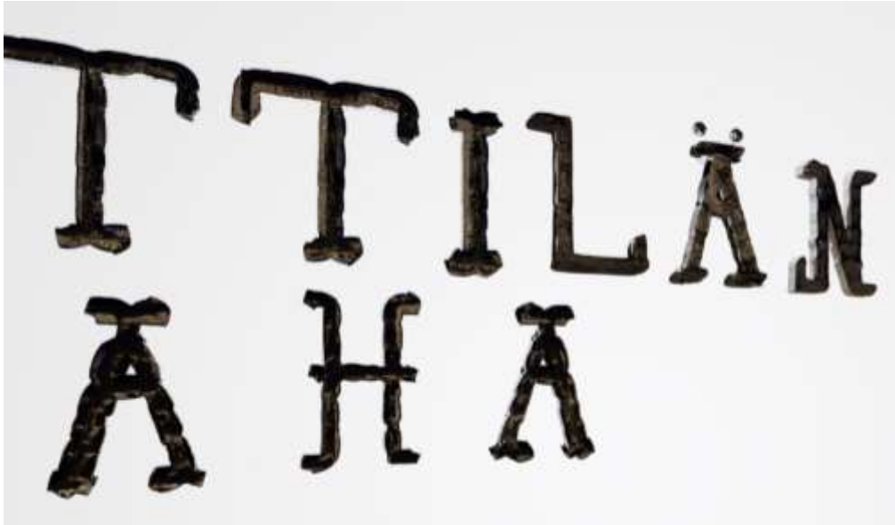
Kuva 2. Displace-modifierin tuottama jälki