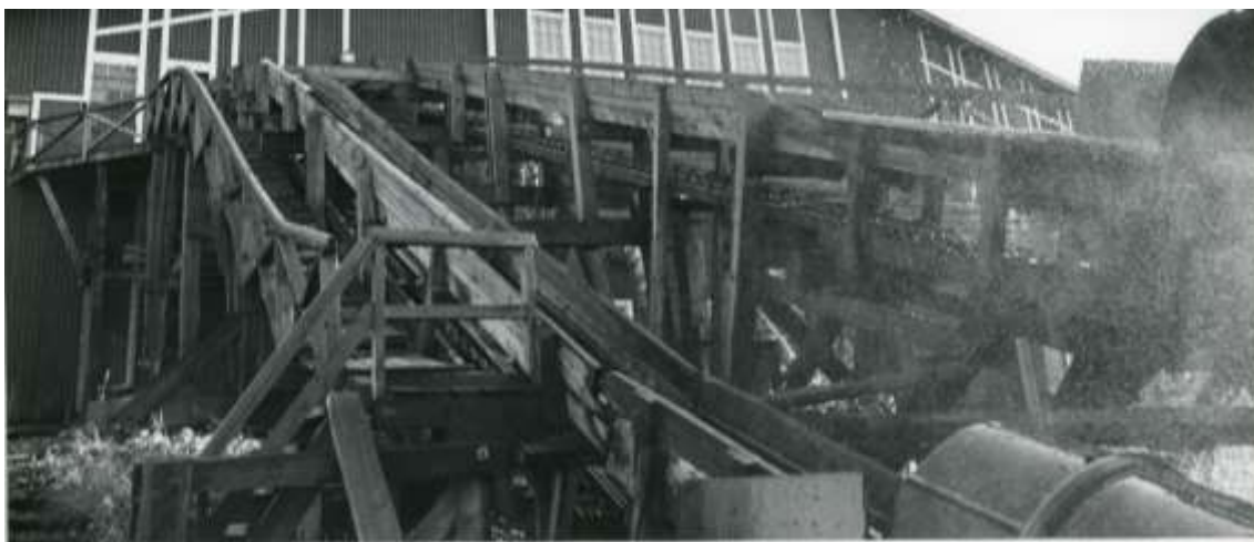
Kuva 4. Sahan kuljettimet ja kävelyrampit.

kävelyramppeja ja portaikoita käyttämällä alla olevaa kuvaa. Piirsin kuvan päälle Photoshopilla erikseen kuistin ja kävelyrampin sinisellä ja puukourun vihreällä erillisille tasoille. Näin pystyin erottelemaan tärkeimmät elementit tarkasteltaviksi ja sain mallinnettua kävelyrampin valmiiksi.