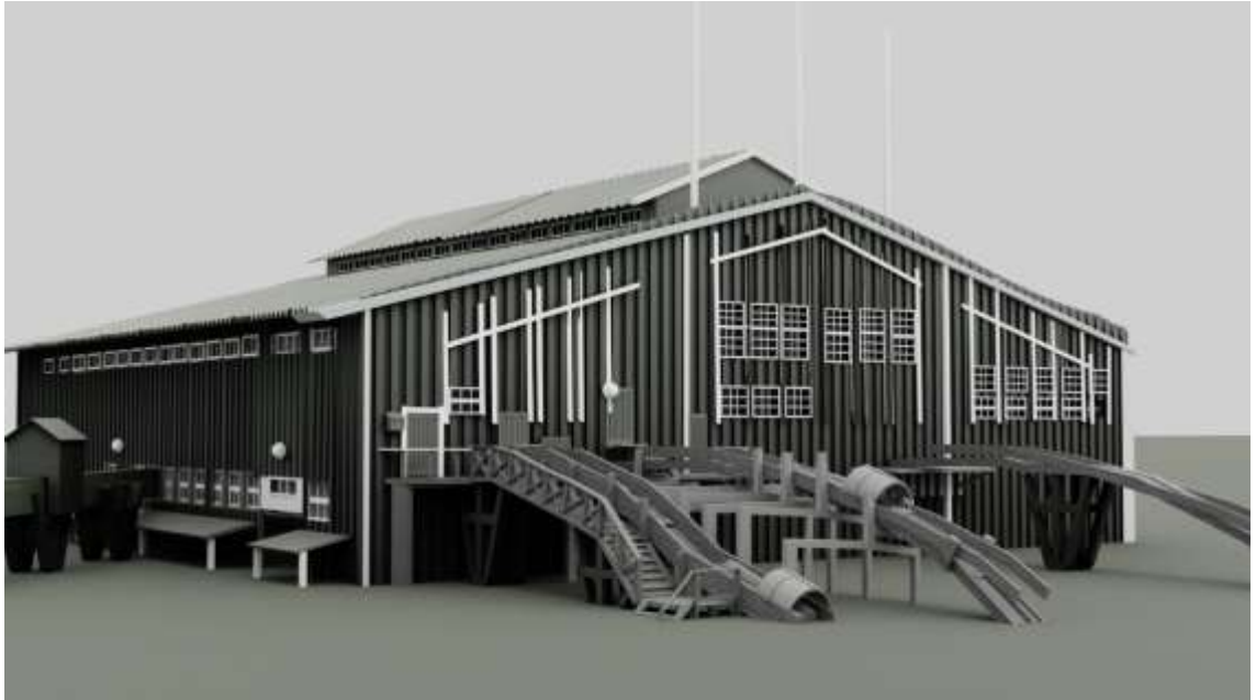
Kuva 5. Sahan kourut ja kävelyrampit ennen muutoksia.