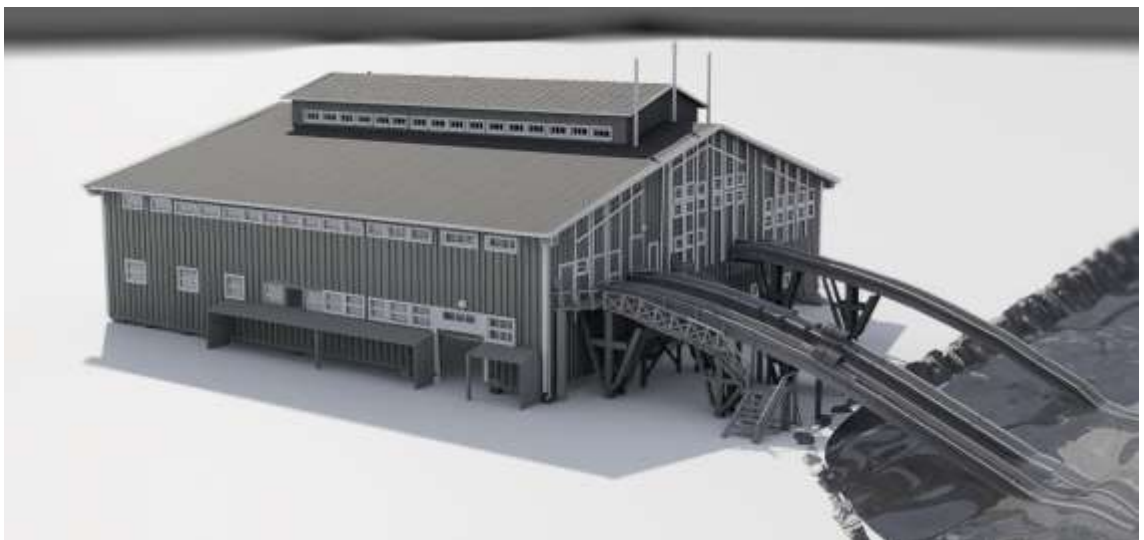
Kuva 6. Sahan kourut ja kävelyrampit muutoksen jälkeen.