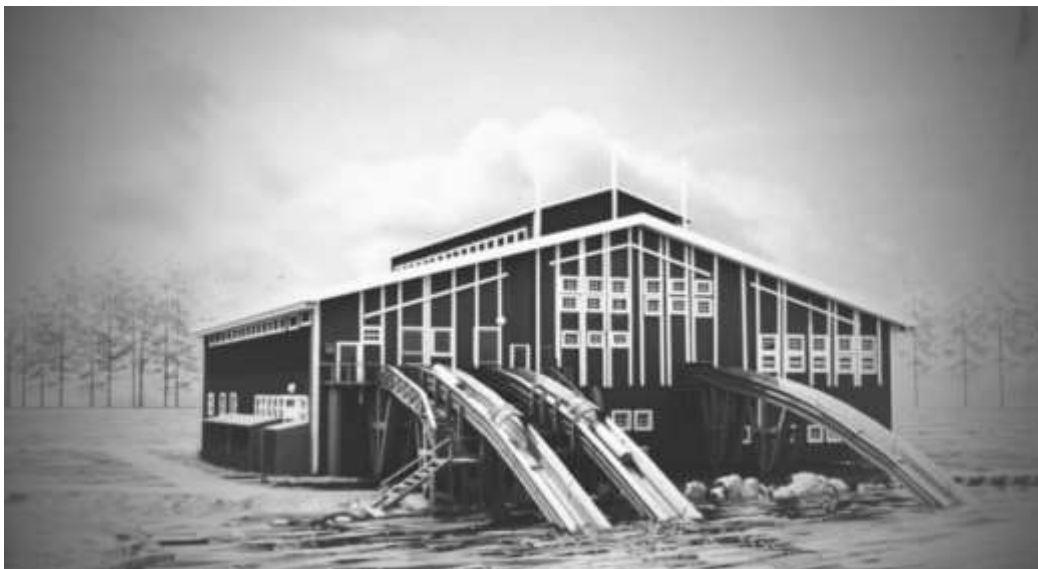
Kuva 11. Viimeinen still-kuva saharakennuksesta, johon tehty Photoshopin Raw-ohjelmalla värisävyllisiä muutoksia.

Suomessa Motion Graphic -työtä tekevät graafiset suunnittelijat, animaattorit, leikkaajat ja kompositioijat. Kyseessä on graafisen suunnittelun ala, joka on vasta viime vuosien aikana tullut tunnetuksi. Aiemmin erilaisia alkutunnuksia ja animoituja tekstejä mainoksiin ja elokuvaan tehtiin kalliissa jälkikäsitteily-yksiköissä mutta jo jonkin aikaa After Effectsin kaltaiset animointi- ja efekti-ohjelmat ovat mahdollistaneet tämän toimenkuvan siirtymisen kalliista erikoisyksiköistä aivan tavallisiin tietokoneisiin ja sitä kautta useamman käyttäjän ulottuville. Tärkeä elementti Motion Graphic Designissa ovat siirtymät. (Goux, M & Houff, 2003, 145.) Siirtymien avulla myös tekemistäni eri videoiden osioista tulee kokonainen teos sisältäen värimäärittelyn ja musiikin.