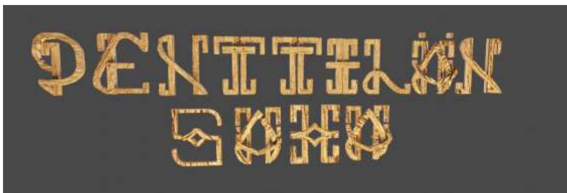
Kuva 1. Teksturoitu intron logo mallinnettuna.