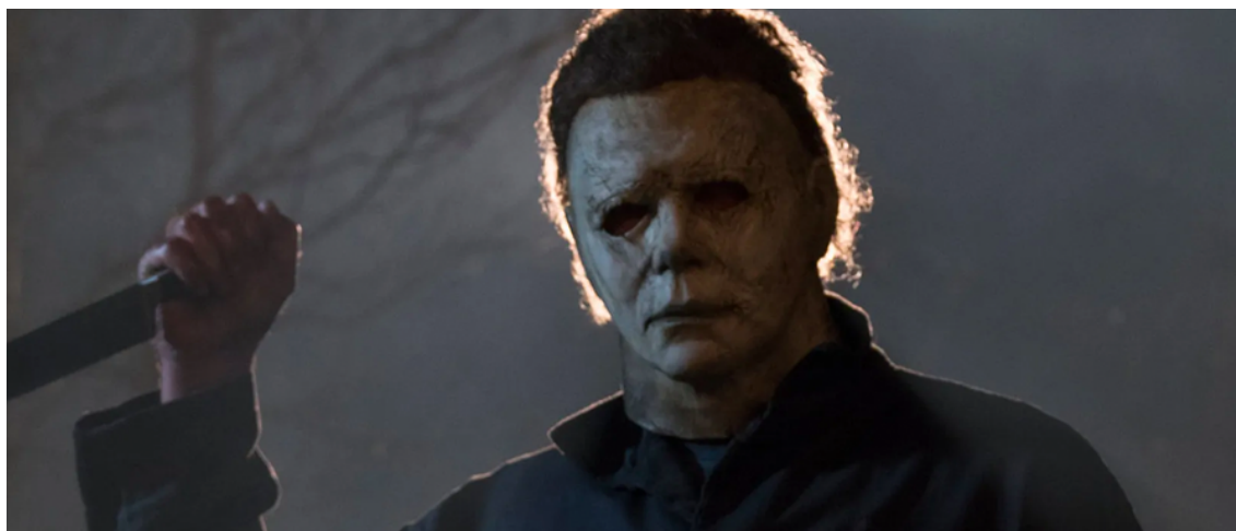
Kuva 7. Michael Myersin hengityksen ääntä käytettyään johtoiheena Halloween-elokuvissa (USA, 1978, muokattu).

Tähän huomiona se, että atonaalisten johtoiheiden käyttö ei ole suinkaan uusi määritelmä musiikista tai ennennäkemätön havainto. Äänitehosteita on käytetty johtoiheena elokuvissa ja muissa medioissa huomattavasti ennenkin. Esimerkiksi Halloween-elokuvissa (USA, 1978), joissa Michael Myersin tunnistettava hengitys kertoo lähestyvistä vaarasta, voidaan se määritellä johtoiheeksi.