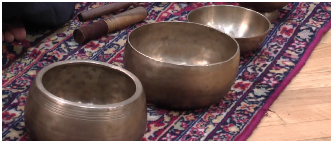
Kuva 9. Äänimaljoja. (WFMT 2017, muokattu).

ääneksi ja hukutin sen kaikuun Aslanin kohtaukseen. Otin myös erillisen kajahduksen, johon automoin pitch shiftiä luodakseni dissonoivan harmonian kahden äänimaljan välille. Dissonoiva harmonia tukee tarinallisesti hetkeä, jossa Aslan muuttaa imaisunsa painostavaksi pyytäessään Matiasta ryhtymään hänen huumekuriirikseen.