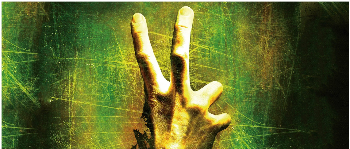
Kuva 3. Kansikuva pelisarjalle Left4Dead. (2008. USA: Valve, muokattu)

Leitmotifin käyttö ylettää myös videopelien maailmaan. Se, mikä videopelien kanssa äänisuunnittelussa on mielenkiintoista, on juuri käyttäjän itse ohjaama toiminta ja kuinka sitä voi ohjata äänellisillä vihjeillä. Kun elokuvissa äänen kanssa voidaan ohjata tunnetta, saadaan videopeleissä tähän vielä uusi ulottuvuus, kun tunteen lisäksi myös pelaajan liikkeitä ja päätöksiä voidaan ohjata.