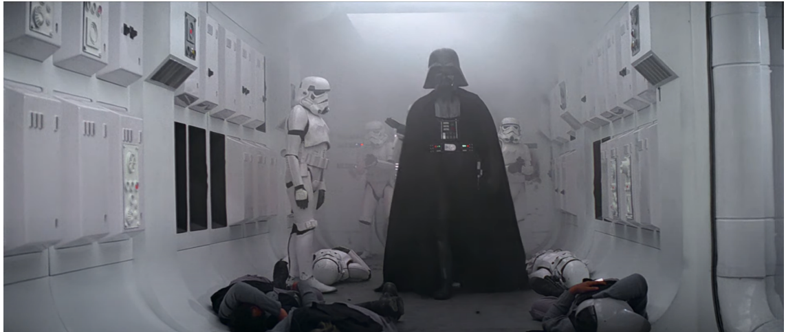
Kuva 1. Darth Vaderin sisääntulo leitmotifin saattamana. (Star Wars: Episode IV – A New Hope, 1977).

Star Wars -elokuvat ovat laajasti tunnettuja, johtoihoidentäyteisiä elokuvia, joista on hyvä aloittaa esimerkkien esittely. YouTubesta löytyy video, johon käyttäjä Inside the Score on kerännyt elokuvista leitmotifeja yhteen pakettiin. Mukaan kuuluu esimerkiksi päähenkilö Luken, ”voiman”, rakkauden sekä Darth Vaderin leitmotifit ( Inside the Score 2018).