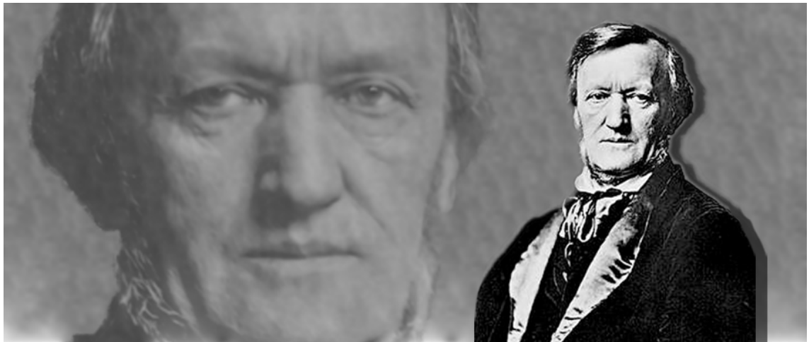
Kuva 4. Richard Wagner.

Vaikka johtoaiheen historia löytää itsensä helposti muualta, yhdistetään sen alkuperä kuitenkin vahvasti saksalaiseen oopperasäveltäjään Richard Wagneriin .