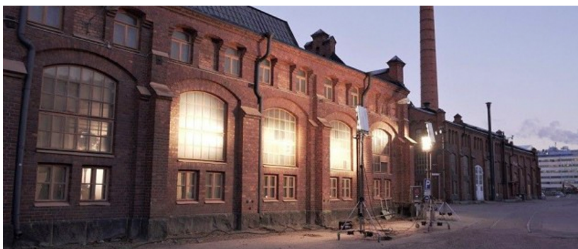
Kuva 10. Vallilan konepajan miljöö inspiroi rautateiden ääniä. (Möhkölä 2018, muokattu).

Matiaksen äänelliseksi teemaksi muodostuivat äänisuunnittelutyön jälkivaiheessa junien ja rautateiden äänet. Ajattelin kolinan ja kirskumisen kuvastavan Matiaksen sisäistä ”kusipäätä,” joka aika ajoin pääsee valloilleen ja vie tämän mukanaan. Ideaa inspiroi vahvasti teoksen visuaalinen maisema: useat kohdaukset olivat kuvattu Teurastamolla, sekä Pasilan konepajalla, jossa ennen vanhaan siis huollettiin rautatievaunuja.