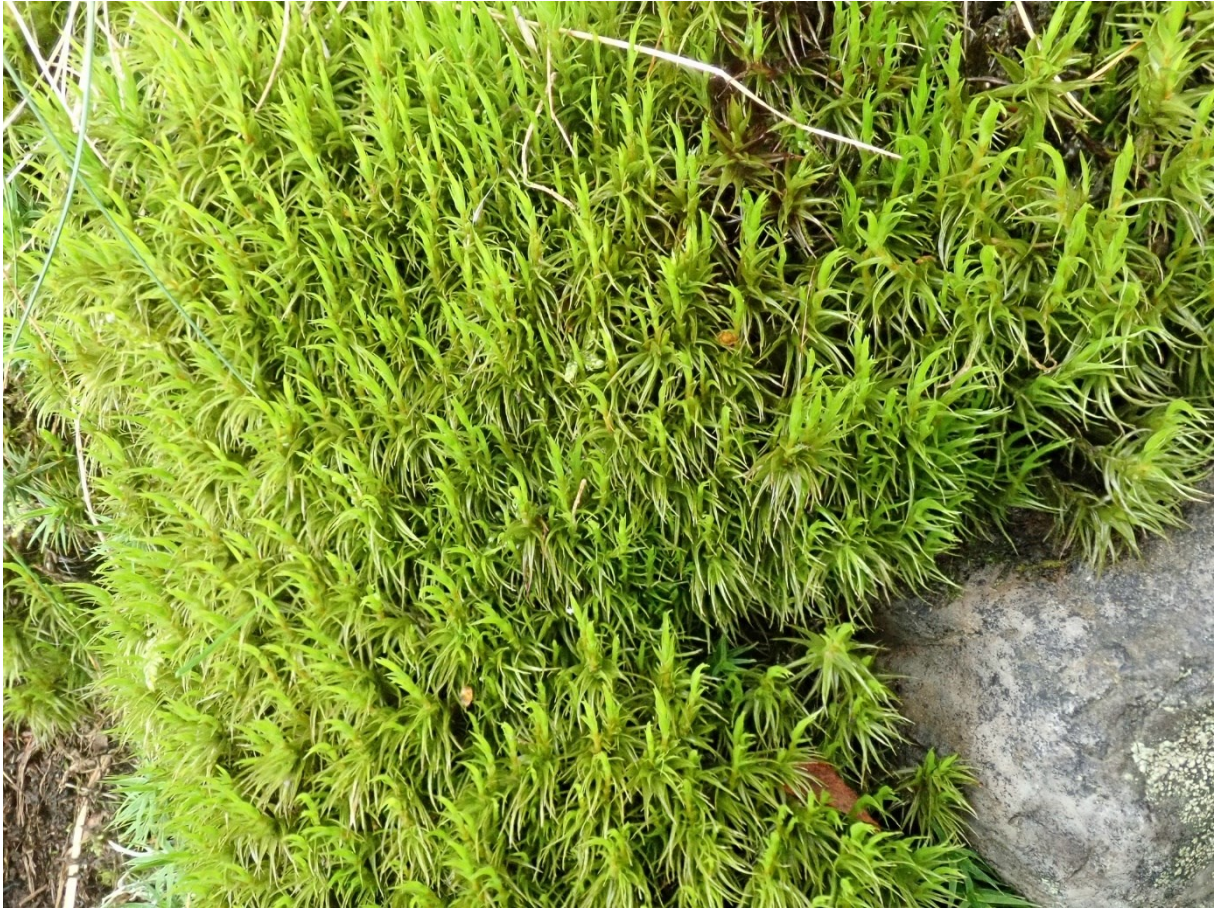
Kuva 6. Kivikynsisammal (Kuvaaja Claire Halpin, British Bryological society, n-d.-c).

Yleinen koko maassa. Usein varjoisista metsistä löytyvä kasvupaikoiltaan monipuolinen laji. Kivikynsisammalia esiintyy tuoreilla ja kuivilla kankailla, karuissa korvissa ja myös rämeiden mättäillä, kivillä, polkujen varsilla, kannoilla, kallioilla ja jyrkänteillä. (Laine ym., 2020, s. 154) Viihtyy varjoisilla, mutta myös aurinkoisilla paikoilla. Kivikynsisammalelle käy sekä hapan että emäksinen kasvualusta. (Nordström, 2020, s. 25) Esiintyy koko maassa, harvinainen Lapissa (Laine ym., 2020, s. 154).