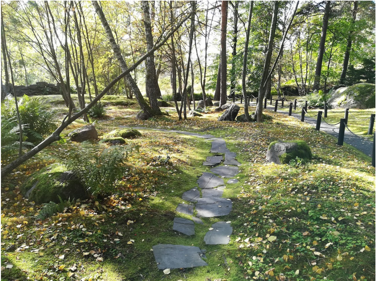
Kuva 4. Luonnonkivipolku sammalmatossa Roihuvuoren japanilaisvaikutteisessa puistossa Helsingissä. Kulku pääreitiltä sammalmatolle on rajattu aidalla.