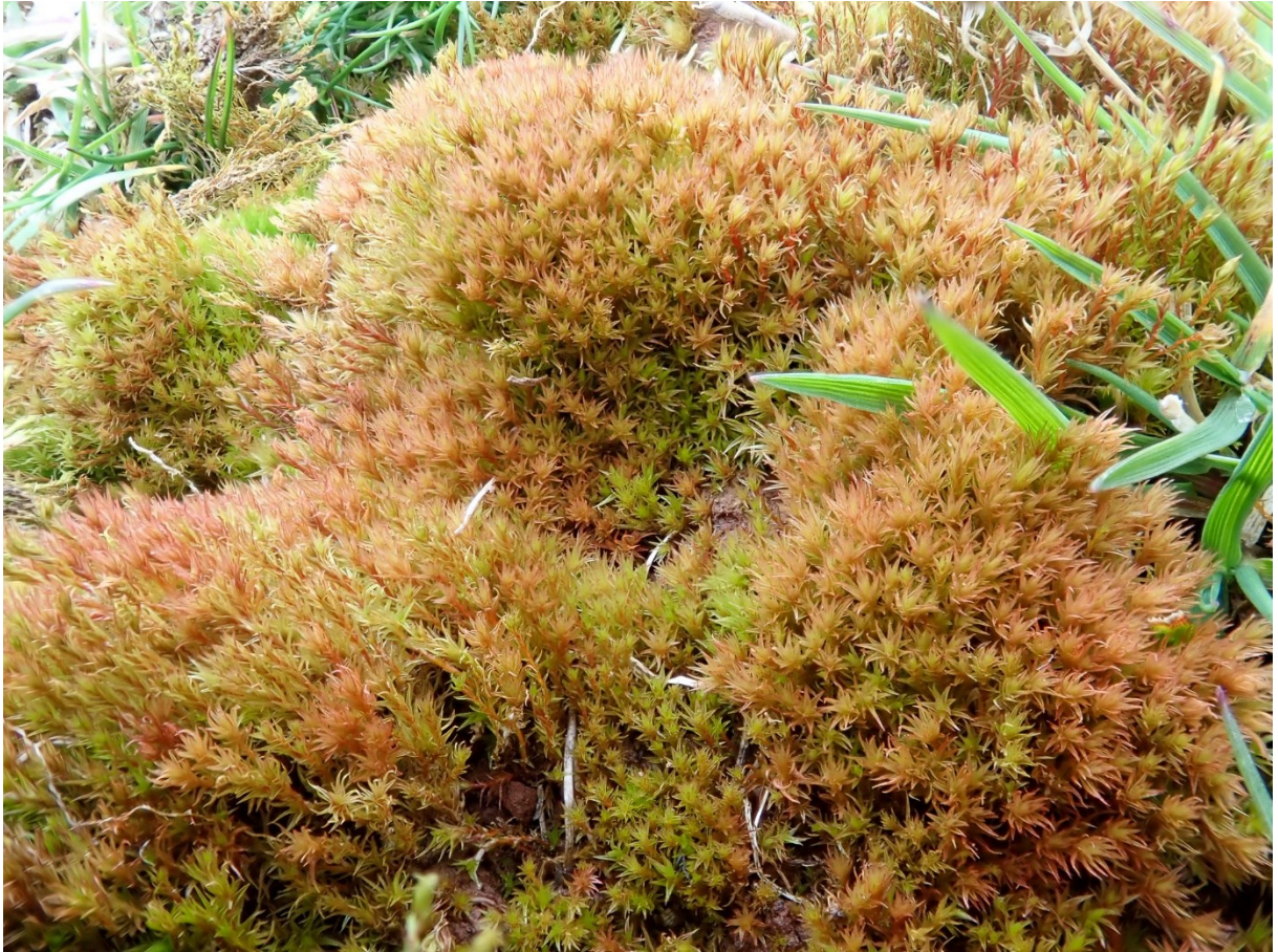
Kuva 5. Kulosammal.

Monipuolisen kulosammalen käyttökohteita puistoissa ovat esimerkiksi sammalmatot, kivikot, aidat, ja monet paikat missä suuremmat sammalet eivät välttämättä pärjää. Se sopii myös laattojen tai astinkivien väleihin. (HKR, 2013, s. 28; Paalo & Jetsonen, 2006, s. 143; Schenk, 2001, ss. 186–187)