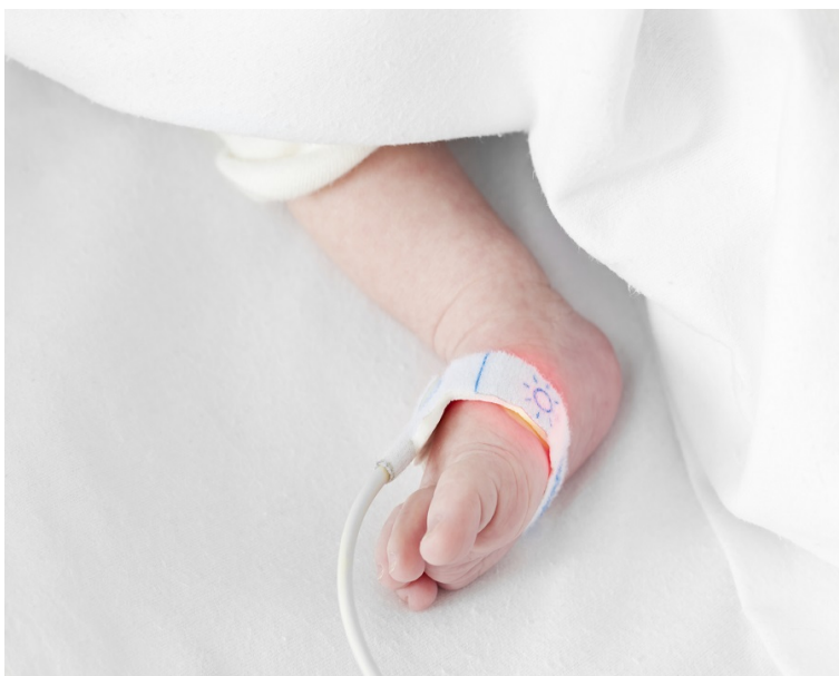
Kuva 4. Vastasyntyneen jalassa oleva SpO 2 -anturi. (University of Birmingham, 2022)

mahdollista gradienttieroja eli eroa arvojen välillä. Se voi viitata adaptaatiohäiriöön, koholla olevaan keuhkovaltimopaineeseen, yleisinfektioon tai sydänvikaan. (Terveyskylä, 2018, kohta Happisaturaation mittaaminen.) Normaali happisaturaatio vastasyntyneellä on 90–95 prosenttia (Kiviluoma ym., 2021). Tarrakiinnitteinen anturi asetetaan vastasyntyneellä yleensä jalkaterän sivuun, kämmeneen tai korvalehteen ja varmistetaan, että se pysyy hyvin paikoillaan. Saturaatioarvoa voidaan seurata monitorilta ja muutoksiin tulee reagoida. Yksittäisten arvojen sijaan tärkeämpää on seurata muutoksen suuntaa ja nopeutta jatkuvana trendinä. Saturaatiomittarin avulla saadaan tietoa myös luotettavasti sydämen syketaajuudesta, sillä saturaatio mitataan pulssiaallosta. (Alanen ym., 2016, s. 33–34, 245.)