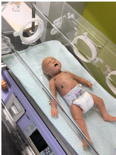
Kuva 1. Newborn-simulaattori.