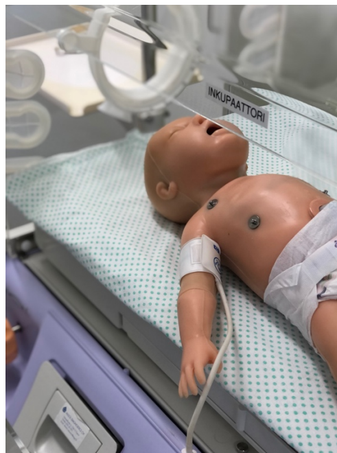
Kuva 2. Newborn-simulaattori.