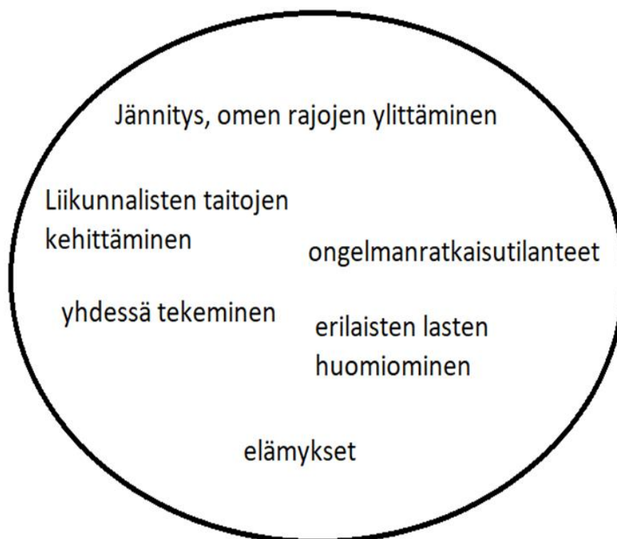
Kuvio 1 Keskeiset elementit seikkailuun varhaiskasvatuksessa.

Karppinen & Latomaa (2015, 47) puolestaan painottavat, että seikkailukasvatuksen lähtökohtana tulisi olla sosiaalisuus, toiminnallisuus ja emotionaalisuus. Heidän mukaansa, seikkailussa käytettävien elementtien avulla pyritään saamaan aikaan henkilössä positiivisia muutoksia. Tämä tarkoittaa käytännössä sitä, että toiminnallisuus on yksi menetelmä muiden joukossa. (Karppinen & Latomaa 2015, 47.)