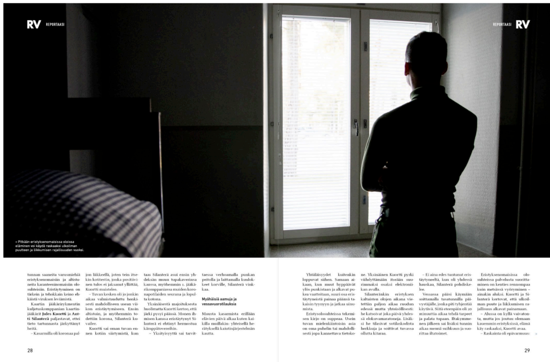
KUVA 2 Ruotuväki-lehti 2/22

Valokuvaajan ja taittajan on muistettava näytön ja printatun tuotteen ero lopputuotteessa. Näyttöjen asetukset voivat vaihdella huomattavasti, eivätkä ne voi näyttää painovärejä täysin oikein. Yhteinen väriprofiili ja kalibrointi eli näytön säätö mahdollisimman lähelle painettuja värejä auttaisi sisältötuottajia kuvamateriaalin oikean värisäädön löytämisessä. (Pesonen 2007, 60–61)