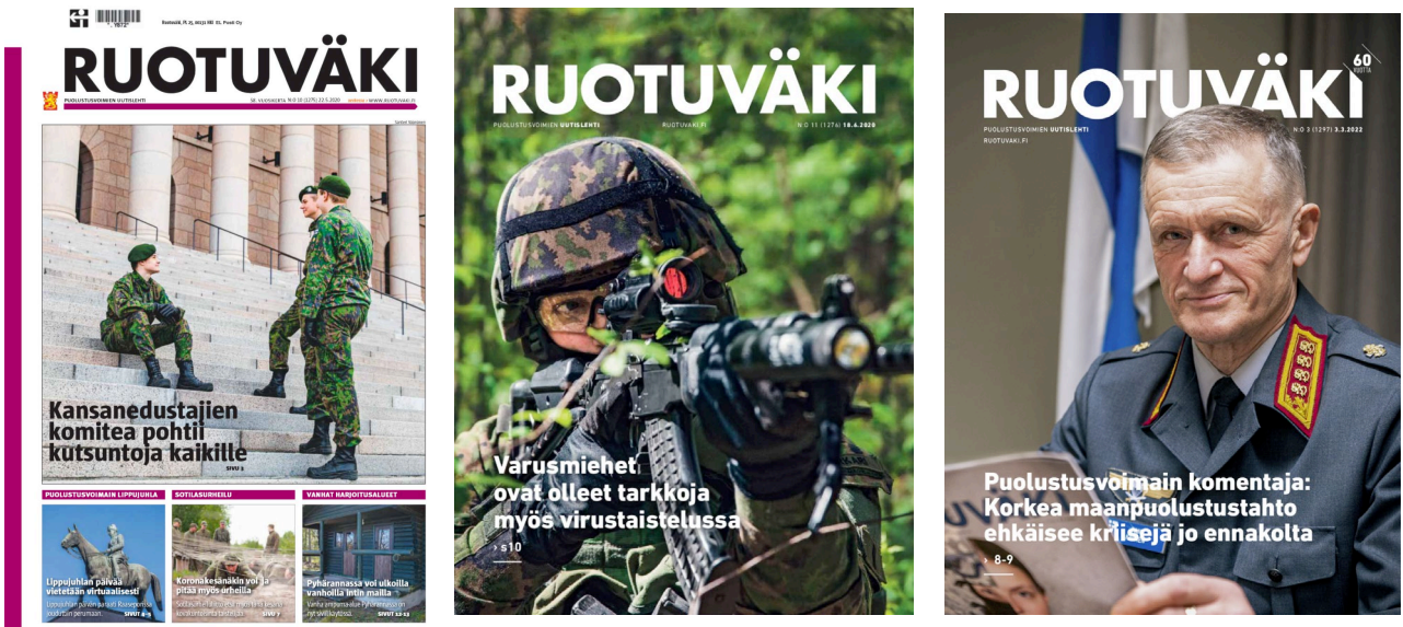
KUVA 1 Ruotuväki -lehden numerot 10/2020, 11/2020 ja 3/2022

Ulkoasun muutoksesta huomaa erittäin tarkan suunnittelun lopputuloksen. Mielenkiintoa herättää kuitenkin kansien logon pienet muodonmuutokset, jotka mukautuvat kannen kuvan mukaan. Logossa on myös juhlavuoteen soveltuva 60-vuotta -vinologo. Entiseen ulkoasuun verrattuna ylimääräiset ikonit ja logot on poistettu. Lehti on nyt ulkoasultaan perinteisen aikakauslehden näköinen,