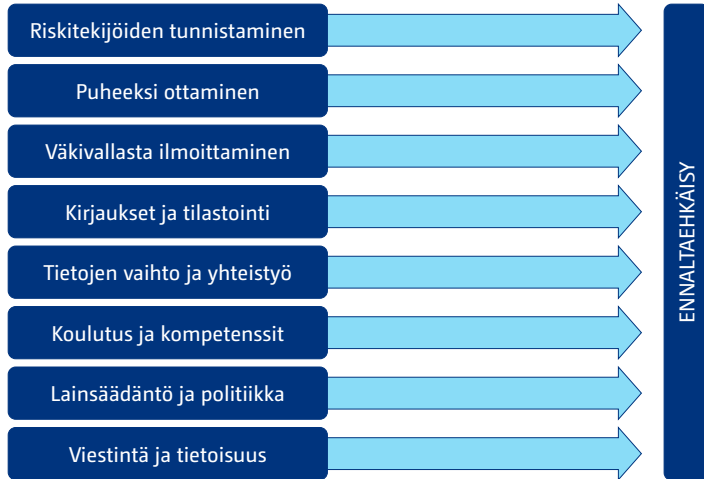
Kuvio 3. Lähisuhdesurmien tutkimustoiminto ja väkivallan ennalta ehkäisy.

asioita, joita tulee ottaa huomioon väkivallan ennalta ehkäisyä tarkastellessa. Esittelemme ulkomaisissa seurantajärjestelmissä esiin nousseita havaintoja.