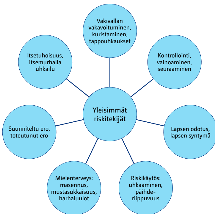
Kuvio 2. Lähisuhdesurman yleisimmät riskitekijät.

Englannin ja Walesin valtakunnallisesta lähisuhdesurmien selvityksestä ilmenee, että suurin osa surmista tapahtui asuntojen sisällä, ja yleensä surmantekijä oli jakanut asunnon uhrin kanssa. Yleisin surmaväline oli teräase tai terävä esine (47 %), jonka lisäksi surmatekoon liittyi jokin muu väkivallan muoto. Seuraavaksi yleisimpiä tekotapoja olivat kuristaminen (20 %), tylpällä esineellä surmaaminen (16 %) tai potkiminen ja lyöminen (15 %). Miehet turvautuivat usein liioiteltuun väkivaltaan ( overkill ) surmatessaan kumppaninsa. Lisäksi usein, vastoin yleistä luuloa, surmissa oli nähtävissä suunnitelmallisuutta.