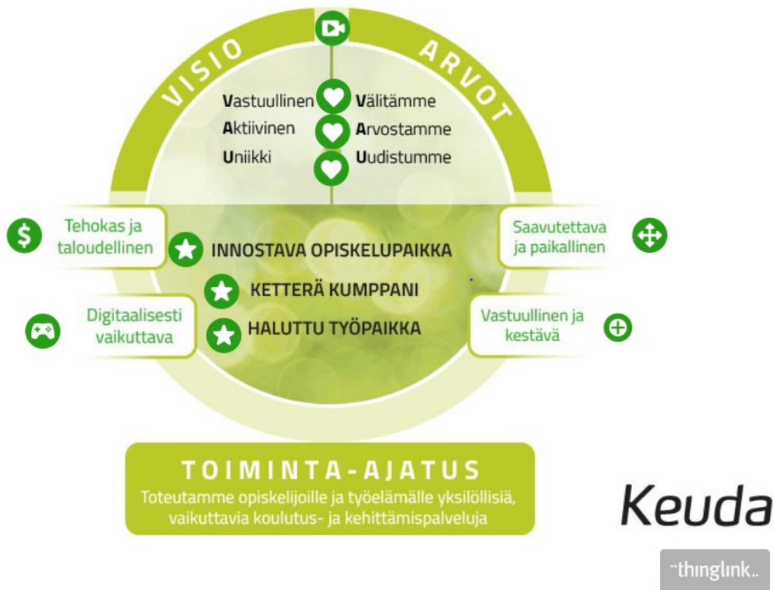
Kuvio 1: Keudan strategia 2020–2024 kuviona (Keuda 2022a).

Vuosikello toteutettiin Keravan Keskikadun toimipisteen ammattiohjaajille. Keskikadulla on mahdollista opiskella liiketoiminnan, tieto- ja viestintätekniiikan sekä kasvatus- ja ohjausalan tutkintoja. Tutkinnot voi opiskella päivätoteutuksella, monimuoto-opintoina tai