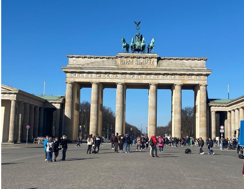
Kuva 3. Brandenburgin portti. (Julia Nurminen.)

TripAdvisorissa (TripAdvisor 2022b) on Brandenburgin portista yli 46 000 arviointia, joista ylivoimaisesti enemmistö on hyvää palautetta. Täydet 5/5 arvostelua on jättänyt lähes 27 000 kävijää. Arvosteluissa 1/5 tai 2/5 oli antanut vain noin 450 kävijää. Googlessa (Google 2022a) yli 127 000 arvostelua ja näistäkin keskiarvio on 4,7.