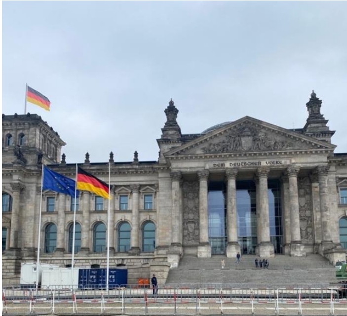
Kuva 4. Berliinin Valtiopäivätalo. (Julia Nurminen.)

Arvioiden mukaan rakennus oli hyvin kiinnostava ja arkkitehtuuri oli kaunista. Lisäksi sijainti koettiin keskeiseksi ja hyväksi. Arvioista tuli myös ilmi kunnioitus rakennuksen historiallista taustaa kohtaan, sekä kunnioitus sen keskeisestä asemasta Saksan poliittisena keskuksena. Rakennuksen myös koettiin olevan tärkeä osa Saksan ja myöskin koko maailman historiaa. Opastetut kierrokset rakennuksessa koettiin mielenkiintoisina. Moni kehui myös paikassa ollutta Audio-opasta, joka koettiin hyväksi.