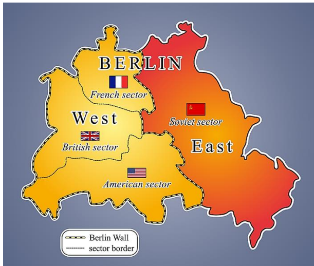
Kuva 1. Jaetun Berliinin kartta (Shvili 2021.)

Berliini jaettiin neljään osaan liittoutuneiden ja Neuvostoliiton kesken. (Visuri & Luoto 2015, 25–28).