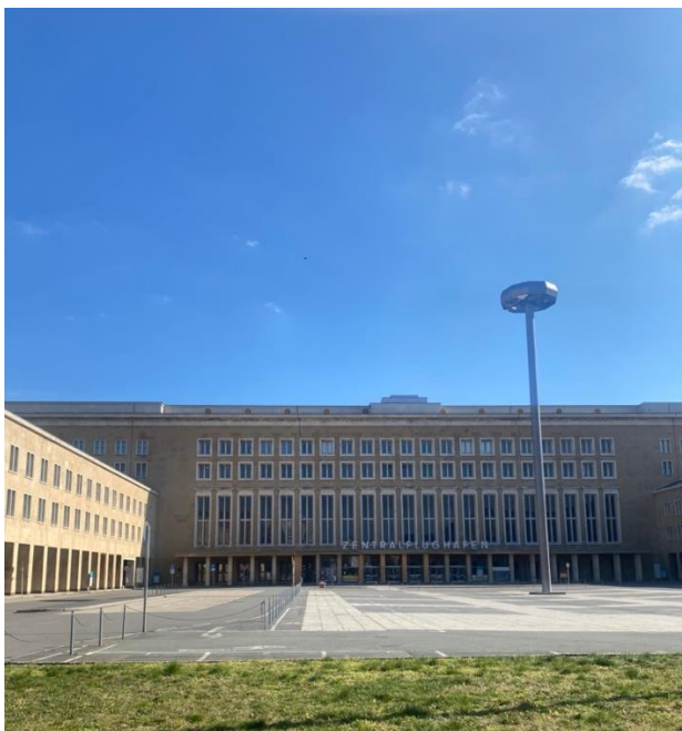
Kuva 7. Tempelhofin lentoasema.

TripAdvisorissa (TripAdvisor 2022h) on Tempelhofin lentoasemasta vain hieman reilu 800 arviota, Googlessa puolestaan reilu 4000 arviointia. TripAdvisorissa kenttä on arvioitu keskimäärin 4,5 arvoisesti ja Googlessa (Google 2022g) arviointien keskiarvo on myös 4,5.