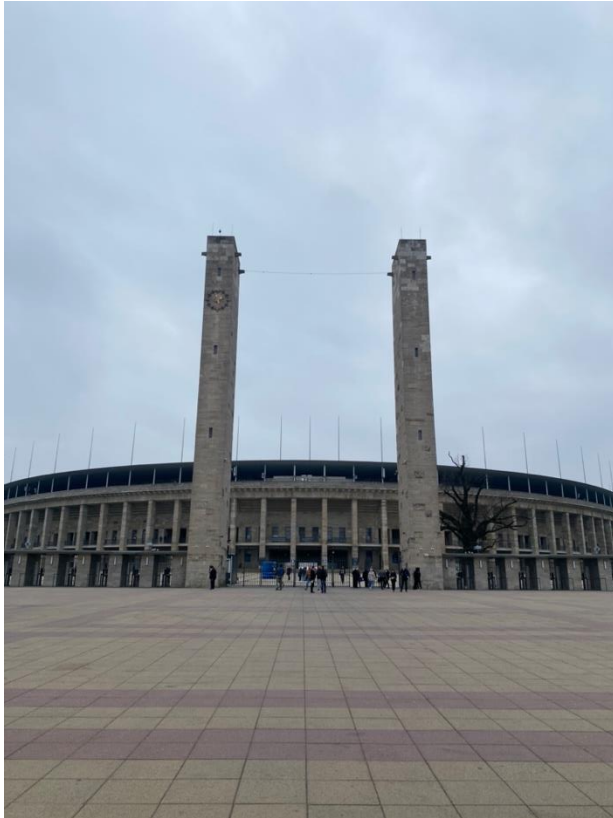
Kuva 5. Berliinin Olympiastadion.

Roomassa. Opastetuille kierroksille osallistuneet kävijät kuvailivat käyntiä todella mielenkiintoiseksi ja oppaat osasivat kertoa paljon lisätietoa stadionista. Mielenkiintoinen huomio arvioissa oli se, että moni toi esiin väljyyden stadionilla ja tätä myöten mahdollisuuden kävellä ja katsella aivan rauhassa ilman muita häiriötekijöitä. Lisäksi stadion koettiin hyvin erityislaatuiseksi sen historiansa vuoksi.