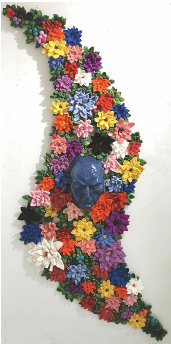
Ulla Törmä, "Sleeping Beauty", 2018, lasitettu keramiikka, eriasteisesti huovutetut villakukat ja puuhelmet. Kosketeltava teos. 2 m x 1 m

Näkemiseen liittyy paljon psyykkistä lainalaisuutta. Havainto- ja hahmopsykologinen tutkimus ovat osoittaneet, että ihmiset näkevät saman asian hyvinkin eri tavoin. Tämä korostuu kuvataiteen ja sitä lähellä olevien alojen parissa työskentelevillä. Subjektiiivisuus korostuu erityisesti värien näkemisessä. (Tuomikoski, 1987, s. 82.)