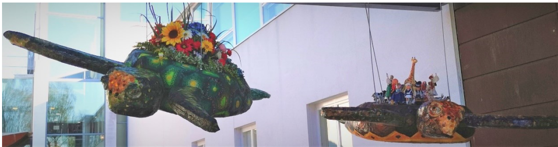
Ulla Törmä, ”Maailman kilpikonnat – Flora ja Fauna”, 2020, kangastilkuilla, eläin- ja ihmisfiguureilla, sekä silkkikukilla päällystetyt styrox-veistokset, kosketeltavia teoksia. 2,2 m x 2 m x 1,3 m

Taidekasvatus ei rajoitu vain varhaiskasvatukseen. Taidekasvatus kuuluu osaan elinikäistä oppimista. Kansalaisopistojen kurssitarjonta on laajaa ja oppilaat monen ikäisiä ja -tasoisia. Eri-ikäisten työskentely yhdessä on rikasta mutta saattaa olla opettajalle haastavaa. Mieluisen asian opiskelu hyvässä ryhmässä tuo monelle hengähdystauon ja voimia arjen keskellä. Kun ihminen tutkii maailmaa, hän tutkii samalla itseään ja rakentaa omaa minuuttaan. Taidesuhteen kehittymisessä täytyy voida itse valita, yrittää, erehtyä ja onnistua; saamme monenlaisia informaation elementtejä tunteiden, intuition ja vaistojen välityksellä. Kontrasteja sisältävät kokemukset luovat syvempää ymmärrystä ja monipuolista ajattelua elämässä. (Karppinen, ym., 2001, s. 59.)