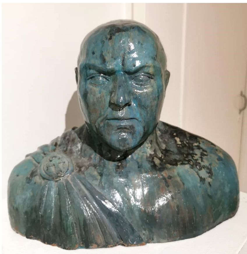
Ulla Törmä, "Senaattori", 2013, lakattu keramiikka, kosketeltava teos, k. 0,5 m l. 0,5 m s. 0,4 m

"Ruumiillisuuteen liittyy intentionaalinen kaari (tietoisuuden kyky viitata itsensä ulkopuolelle), joka tuottaa aistien, ymmärryksen, aistimellisuuden ja liikkuvuuden yhteyden" (Merleau-Ponty, 2002, s. 158–159). Motorinen intentionaalisuus onkin kykyä liikkumiseen ja koskettamiseen. Tämä mahdollistaa kohteiden liittämisen omaan ruumiilliseen kokemukseen. (Määttänen, 2012, s. 52–53.)