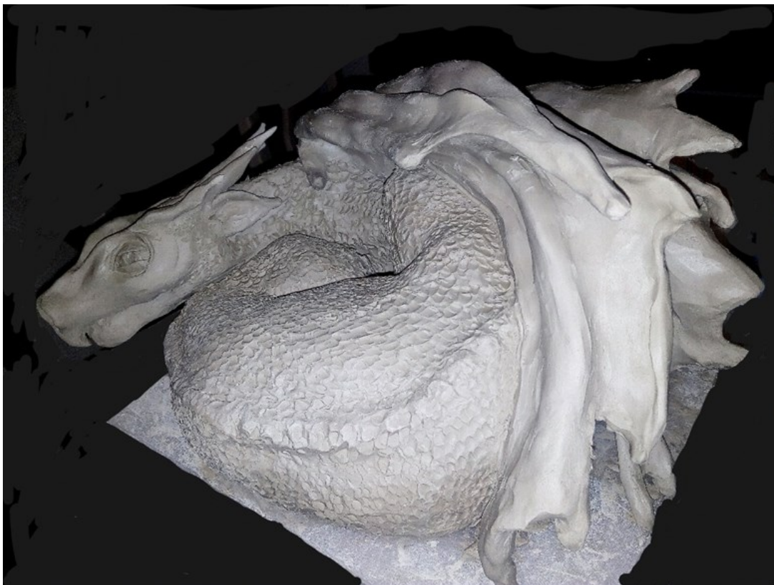
Ulla Törmä, "Smaug", 2017, keramiikkaveistos, kosketeltava teos, k. 0,35 m, l. 0,5 m, p. 0,5 m.