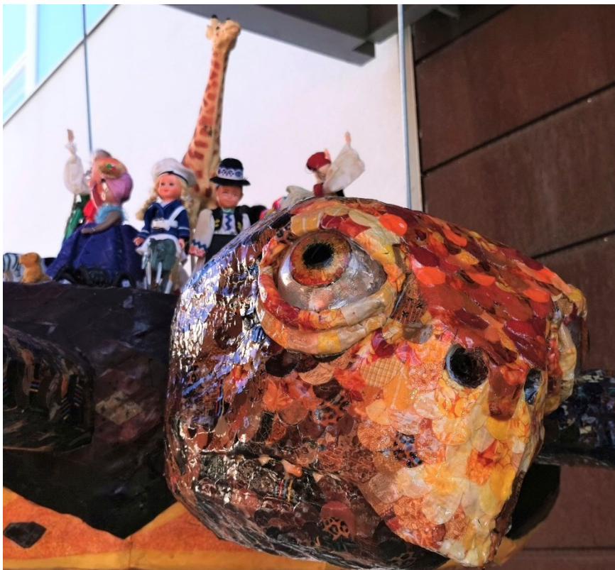
Ulla Törmä, yksityiskohta teoksesta ”Maailman kilpikonnat” kankaat, lelut. Kosketeltava teos, 2020 k. 1,3 m l. 2 m p. 2,2 m

Kokijan taustasta ja kokemuksesta riippuen sama aistimus voi herättää erilaisia tunteita. Niiden kautta aistihavainto mielletään merkitykselliseksi. Pienenkin lapsen esteettinen tuntemus liittyy käsittämiseen ja tietämiseen. Esteettisessä havainnossa tunteet toimivat kognitiivisesti. Näin näkemys esteettisestä on kulttuurisidonnaisena myös muokattavissa ja jalostettavissa kasvatuksen keinoin. (Eaton, 1994, s. 60; Haase, 1996, s. 15–16.)