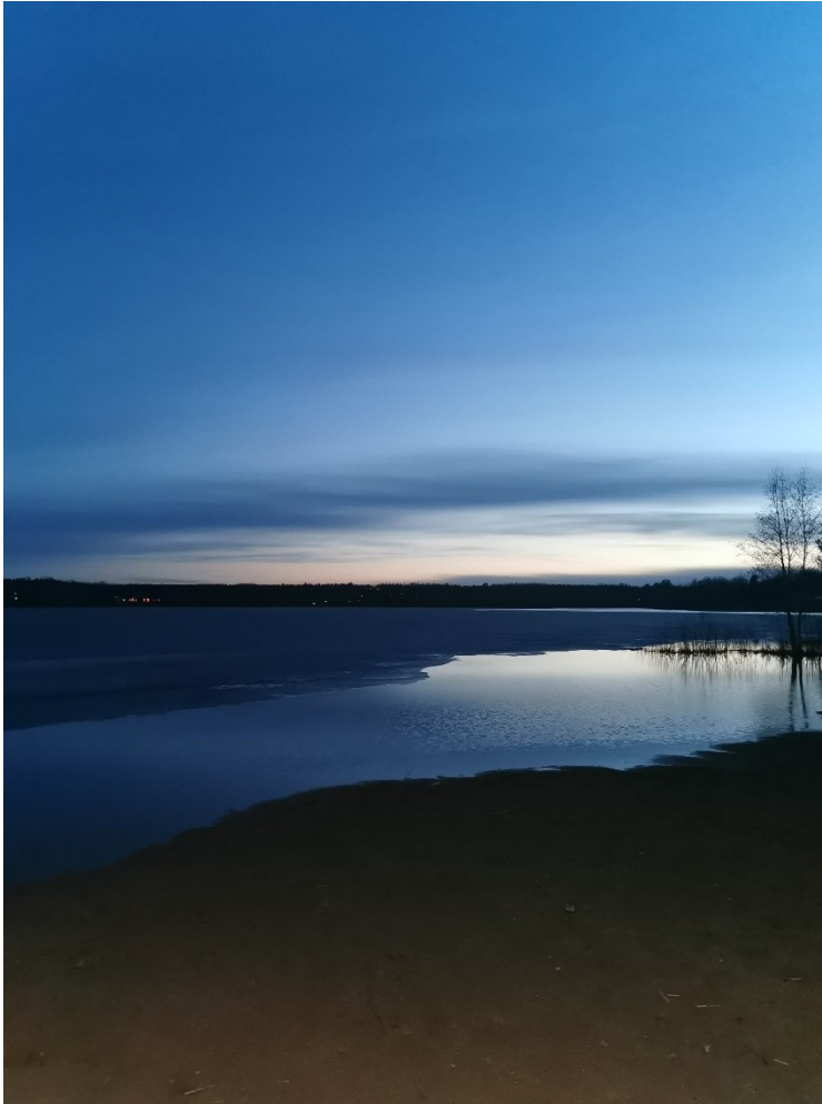
Kirkkojärvi, Parkano, 1.5.2022.