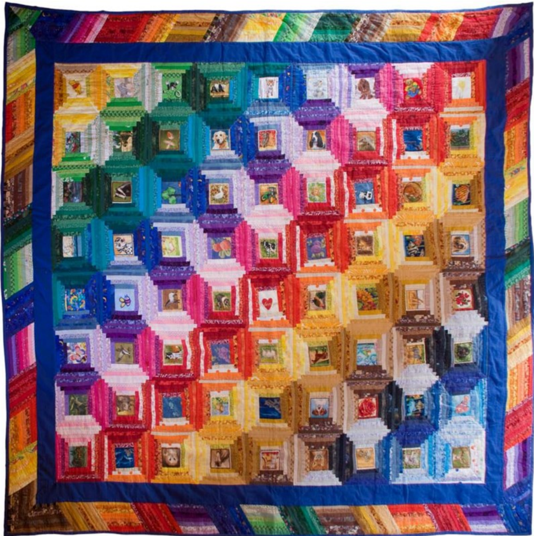
Ulla Törmä, ”Syrämmellä”, 2012, kuulo-, näkö- ja tuntoärsykeitä sisältävä, lattialle sijoitettava teos, sisältäen mm. erilaisia kangastilkkuja, sellofaania, helistimiä, vinkupallon sisuksia, 2,2 m x 2,2 m.

”tyhjistä” ja rakentaa kokonaisia valtakuntia vaikkapa kangassilpusta. Valmiiksi tehty malli, määritellyt muodot ja värit kehittävät motoriikkaa, mutta eivät kokonaisvaltaista heittäytymistä tekemiseen. Siksi aikuisten pitäisi toisinaan unohtaa siisteys, tarkkuus ja suunnitelma omassakin toiminnassaan. Taiteen tasa-arvo tarkoittaa mielestäni myös oikeutta tehdä omanlaista taidetta, joka ei seuraa ohjeita, vaan on lapsen oman intuition ja luovuuden tuote.