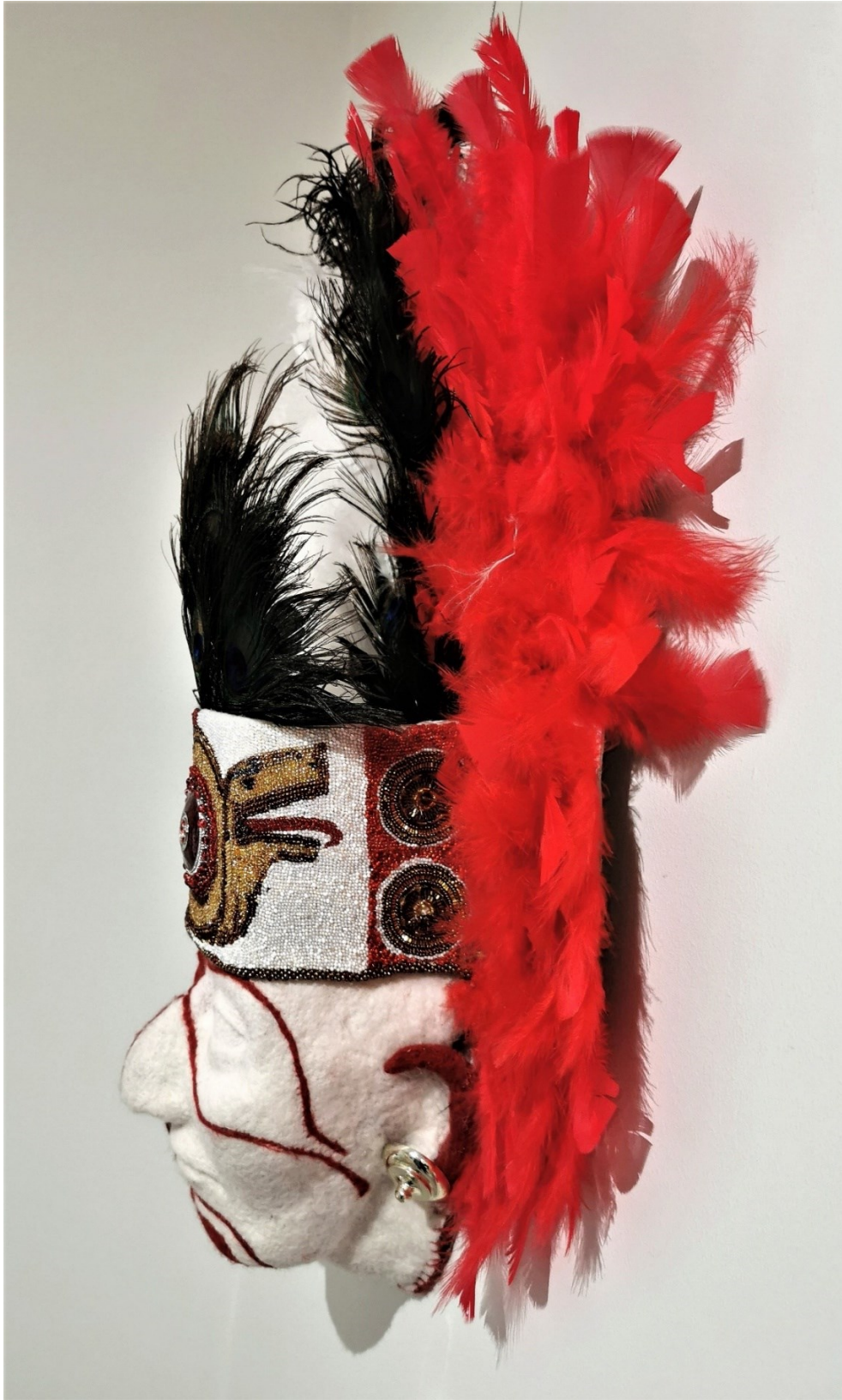
Kuvat sivuilla 33 ja 34: Ulla Törmä, "Päällikkö", 2021, kummaltakin sivulta kuvattuna. Neulahuovutus, lasihelmet, strutsin, kanan, marabun ja riikinkukon höyheniä ja sulkia, kosketeltava teos, k. 1 m, l. 0,6 m, s. 0,25 m