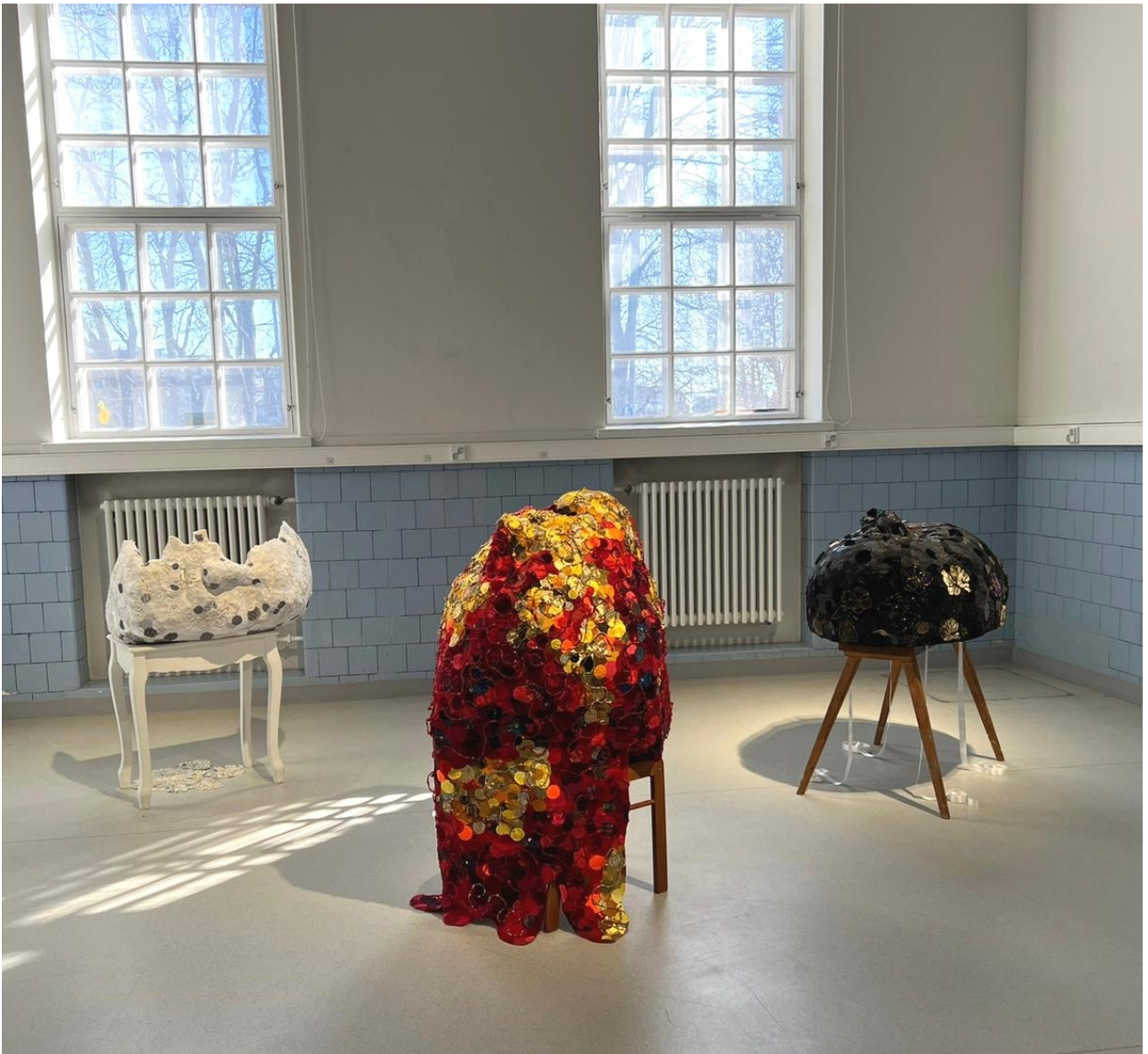
NIMI: Metamorfoosi 1, 2 ja 3

Opinnäytetyönäyttely Variaatio, Taidekeskus Mäلتinranta, Tampere 22.4. – 11.5.2022