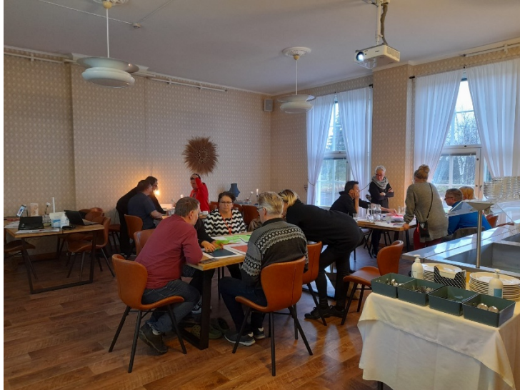
Kuva 1. Verkoston työpajatyöskentelyä ideoiden parissa.

Konseptien hahmottamiseen sekä testaamiseen käytettiin apuna Business Model Canvas -liiketoimintamallia, joka on yksi tapa testata konseptia sen alkuvaiheessa. Liiketoimintamalli on jaettu liiketoiminnan eri osa-alueisiin, joten konseptin muodostama kokonaisuus on mallin avulla helpompi hahmottaa monesta eri näkökulmasta mietittynä. Näin pystyttiin miettimään myös erilaisia potentiaalisia asiakasryhmiä sekä yhteistyökumppaneita, jotka olisivat mukana konseptin toteuttamisessa. Konseptin arvioinnissa liiketoimintamalli auttaa myös ymmärtämään, miten palvelun eri osa-alueet toimivat. Business Model Canvas -malli käsittää itsessään laajan kokonaisuuden, joten kehittämisprosessin aikana oli syytä perehtyä konseptien ansaintalogiikkoihin vielä erikseen.