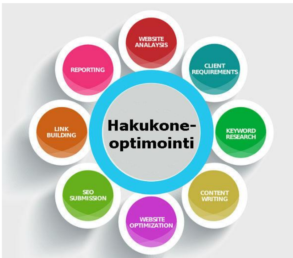
Kuva 1 Hakukoneoptimoinnin osa-alueet (Hakukoneoptimointi, nd.)

Kohdentamisen apuna voidaan käyttää hakukoneoptimointia. Hakukoneoptimoinnilla tehostetaan verkkosivujen näkyvyyttä internetin hakukone palveluissa. Oikein toteutettu hakukoneoptimointi tuo verkkosivuille uutta potentiaalista kohderyhmää, mutta väärin toteutettuna näkyvyys hakukoneissa saattaa lakata kokonaan. Näkyvyys hakukoneissa perustuu verkkosivujen sisältöön, tekniikkaan ja ulkoisiin tekijöihin. Kuviossa on esiteltyä hakukoneoptimoinnin eri osa-alueet. (Hakukoneoptimointi, nd.)