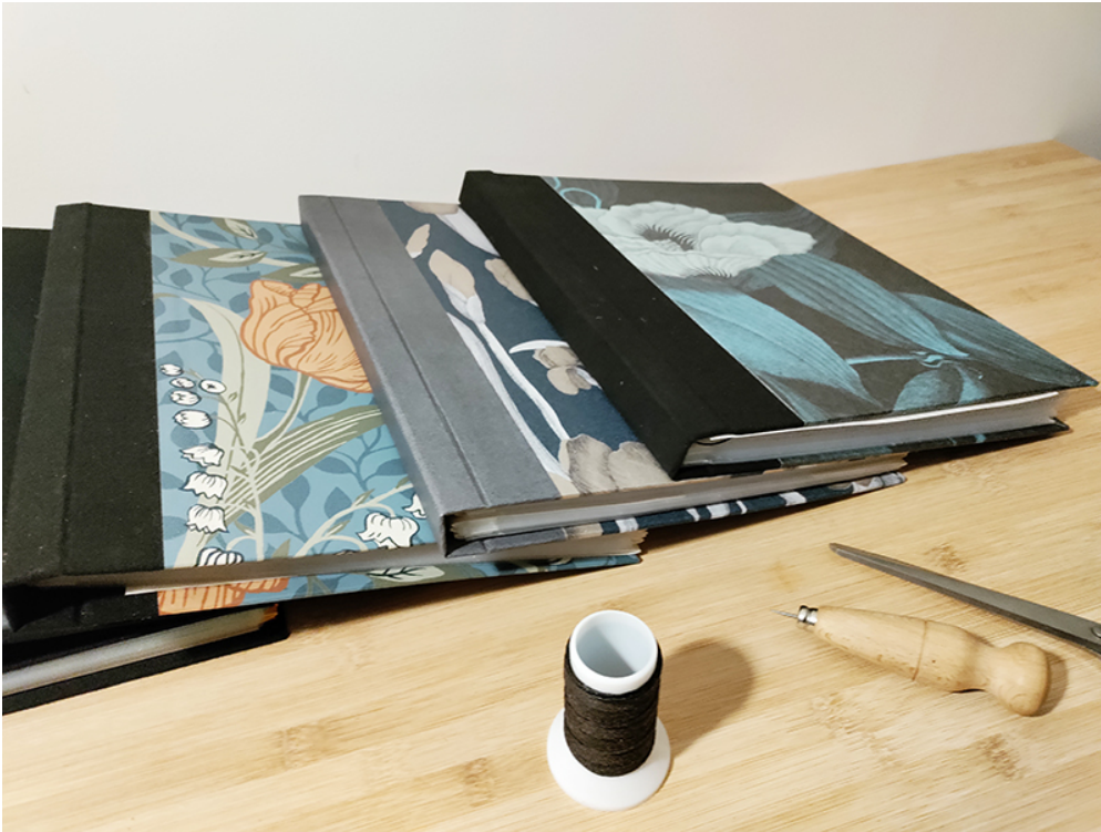
KUVA 4. Valmiita kansioita odottamassa sidontaa

Oman Elämän Kansiossa on kuusi osa-aluetta: jälkihuolto, raha & talous, terveys & hyvinvointi, koti & vakuutukset, opiskelu & työelämä, sekä muut tärkeät asiapaperit. Osa-alueet esittelen yksityiskohdittaisesti jäljempänä. Sivuja Oman Elämän Kansiossa on yhteensä 40, joista osa on esitelty tämän opinäytetyön liiteosiossa (LIITE 4).