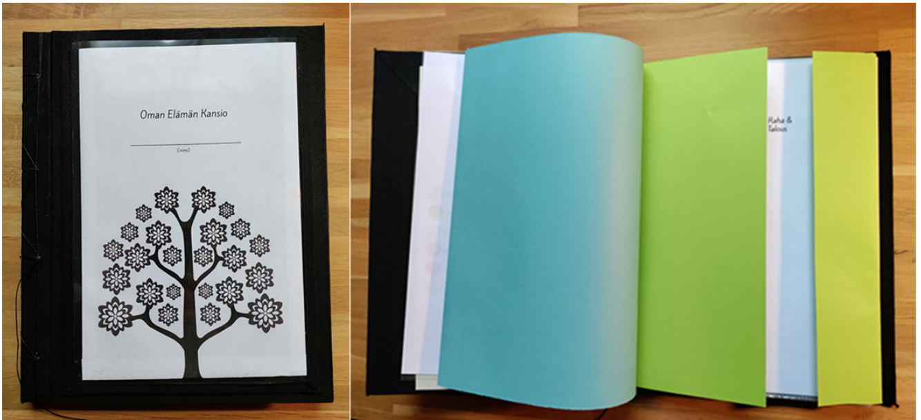
KUVA 3. Toisen vaiheen kansion kansi ja sisällön välilehtiä

Koska alussa tehdyn kyselyn perusteella itsenäistyvät nuoret tekivät huomioita kansion ulkonäöstä ja heidän mielipiteensä ja toiveensa kansion ulkoasusta vaihtelivat, pohdin koostaessani Oman Elämän Kansion päivitettyä versiota, voisiko Oman Elämän Kansioita olla erilaisia, joista nuori voisi valita. Vaihtoehtojen tarjoaminen saattaisi jopa motivoida nuorta ja antaa hänelle kokemuksen mahdollisuudesta vaikuttaa omaan elämäänsä liittyvien esineiden ominaisuuksiin maailmassa, jossa moni esine on teollisesti valmistettua massatuotantoa. Koska jokainen jälkihuollon asiakas on ainutlaatuinen yksilö ja yksilön identiteetin rakentamiseen liittyy myös materiaallinen aspekti ja esineiden avulla luotuja merkityksiä, miksei myös Oman Elämän Kansio voisi olla yksilöllinen, sisältäähän se hyvin henkilökohtaista tietoa ja elämän tärkeimmät asiapaperit. Koska kansiot koostettaisiin käsin, variaatioita voisi vapaasti tehdä. Poimin tähän ajatukseen myös yhden Messi Oy:n arvoista ja toimintaperiaatteista, joka on ympäristöystävällisyys, sisältäen mm. materiaalien kierrätyksen. Ehdotin vaihtoehtoa yksilöllisen näköisestä Oman Elämän Kansioista esittäen, että esimerkiksi kannet voitaisiin koostaa ylimääräisistä tapetin palasista tai käytetyistä kankaista, jolloin syntyisi ainutlaatuisia Oman Elämän Kansioita ainutlaatuisille nuorille. Ajatus sai positiivisen vastaanoton, ja Messi Oy tilasi minulta 8 kappaletta Oman Elämän Kansioita.