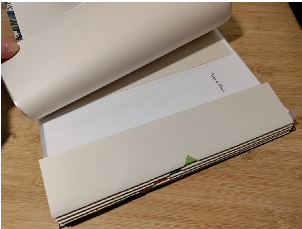
KUVA 6. Oman Elämän Kansion raha & talous -osion etusivu

lous -osiossa on seitsemän erillistä, nimettyä taskua nuoren omille papereille: laskut ja kuitit toimeentulotukihakemusta varten, muut laskut (maksamattomat), muut laskut (maksetut), ruokaostokuitit, pankkibilisopimus, pankkikorttisopimus, sekä velkakirjat ja osamaksusopimukset. Osassa osioita on lisäksi perustietoa kyseiseen kategoriaan liittyvistä asioista. Taskut on koottu nuoren elämän näkökulmasta. Esimerkiksi suurimmalle osalle nuorista toimeentulotuki on suurin yksittäinen tulonlähde, joka vaatii nuorelta aktiivista toimijuutta, jotta hän voi sen saada, joten oma tasku, johon kootaan siihen liittyvät laskut ja kuitit, on tarpeellinen. Lisäksi ruokaostosten viemää rahasummaa voi tarkastella esimerkiksi kuukausitasolla siten, että kaikki ruokaostokuitit kerätään sille määrättyyn taskuun ja kuukauden lopussa katsotaan, paljonko ruokaostokset ovat maksaneet. Ruokaostokuittien keräämisen ja laskemisen avulla nuori voi hahmottaa, paljonko hänellä menee rahaa ruokaan, jos ruokaan kuluvan summan määrittäminen esimerkiksi kuukausibudjettiin on haastavaa.