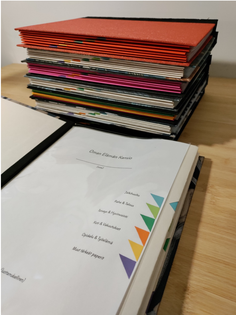
KUVA 5. Valmiit kansiot ja sisällysluettelo