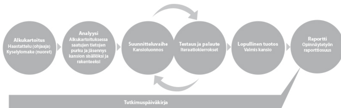
KUVA 1. Opinnäytetyöprosessin vaiheet

Toisessa vaiheessa suunnittelin Oman Elämän Kansion perustuen ensimmäisessä vaiheessa saamiini tietoihin ja suunnitteluprosessin aikana saatuun palautteeseen. Fyysisiä kansioita opinnäytetyöprosessin aikana syntyi yhteensä 12 kappaletta; kolme ensimmäisessä testausvaiheessa, yksi kappale toisessa testausvaiheessa (pohjautuen ensimmäisessä testausvaiheessa saatuun palautteeseen) sekä 8 lopullista kansiota, jotka jaettiin nuorille käyttöön. Käytännössä itsenäistyvien nuorten sekä ohjaajien palaute ohjasi koko suunnitteluprosessia. Osallistava suunnitteluprosessi myötäili käyttäjäkeskeisen suunnittelun periaatteita.