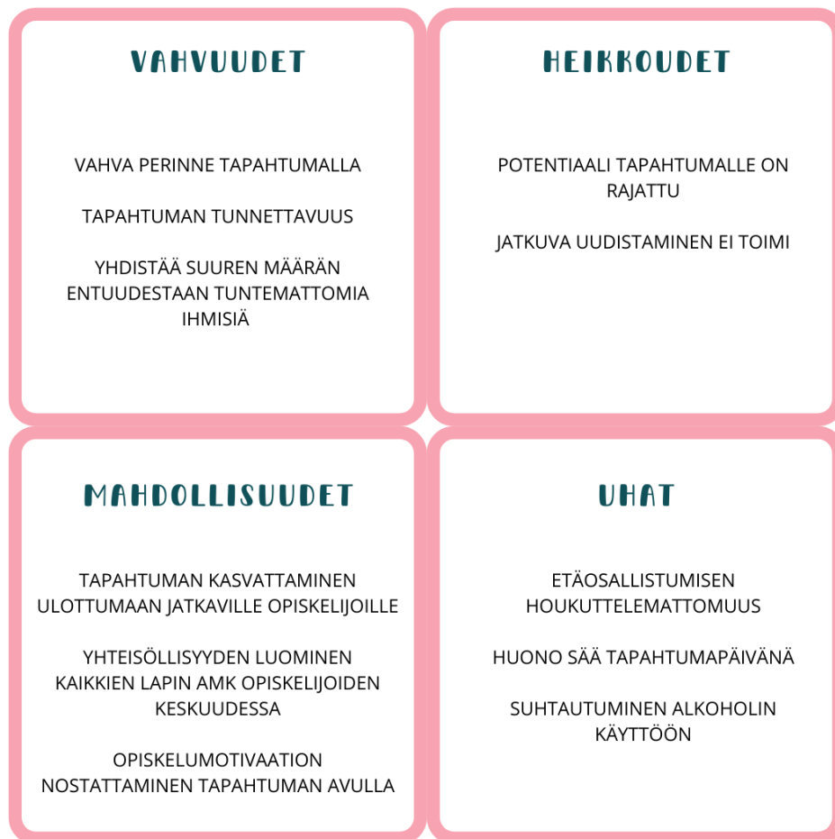
Kuvio 1. SWOT-analyysi tapahtuman kehittämiseksi työpajan pohjalta.

Työpajassa käytyjen keskustelujen ja suunnittelujen pohjalta teimme Kuksajaiset-tapahtuman uudistamisesta SWOT-analyysin (Kuvio 1). Analyysissä vahvuudet ja heikkoudet ovat sisäisiä asioita ja mahdollisuudet ja uhat ovat ulkoisia asioita.