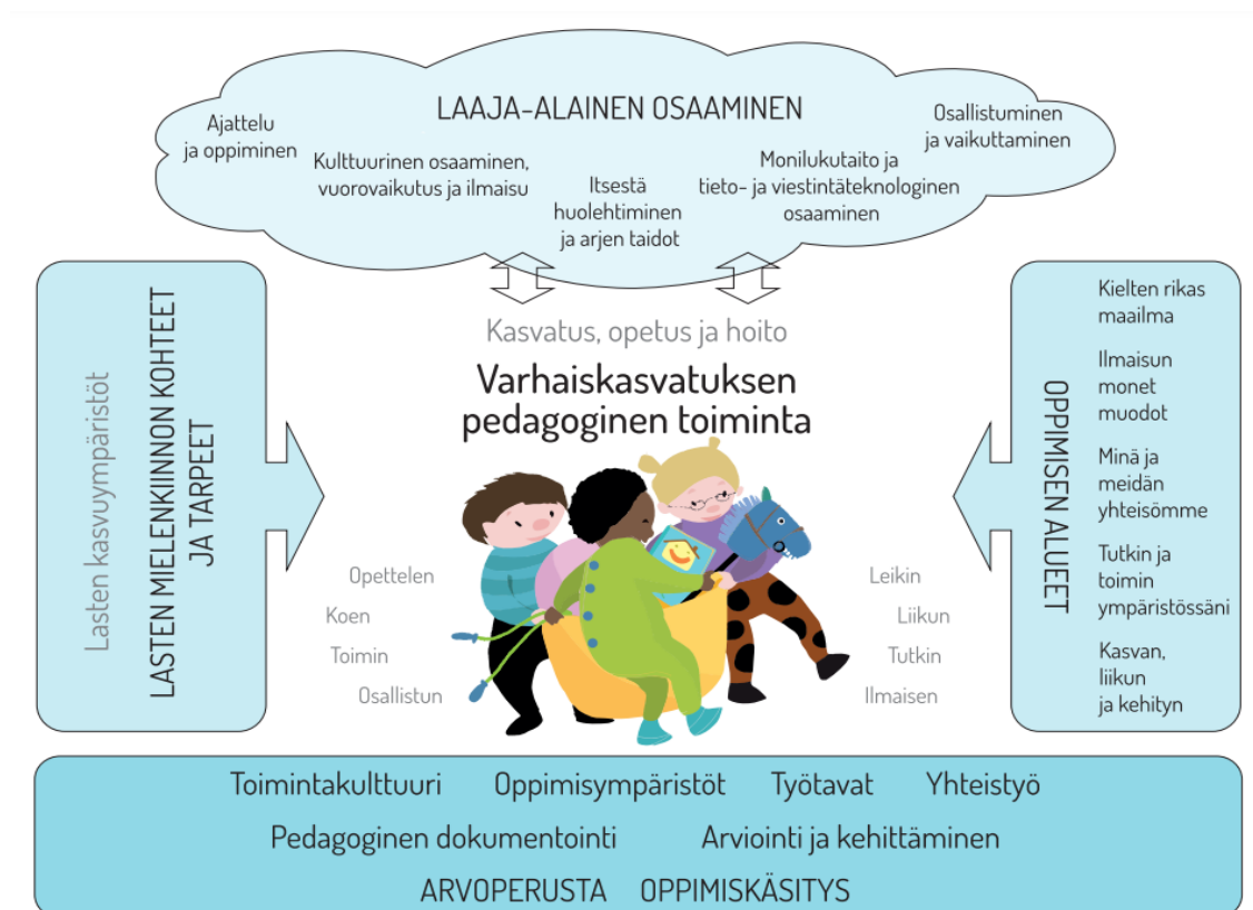
Kuvio 1. Varhaiskasvatuksen pedagogisen toiminnan viitekehys (Opetushallitus 2021b).

Varhaiskasvatuksen pedagoginen toiminta on kokonaisvaltaista toimintaa, jolla tavoitellaan lapsen oppimisen, hyvinvoinnin sekä laaja-alaisen osaamisen edistämistä (kuvio 1). Pedagoginen toiminta perustuu lasten ja henkilöstön väliseen vuorovaikutukseen ja yhteistyöhön, jossa yhdistyvät lasten omaehtoisuus, henkilöstön ja lasten yhteiset ideat sekä suunnitelmallinen toiminta. Varhaiskasvatuksen pedagoginen toiminta tukee lasten laaja-alaista osaamista, jossa yhdistyvät tiedot, taidot, arvot, asenteet ja tahto. Laaja-alainen osaaminen kattaa viisi toisiinsa linkittyvää osa-alueetta. Ensimmäiseen osa-alueeseen lukeutuvat ajattelu ja oppiminen, toiseen kulttuurinen osaaminen, vuorovaikutus ja ilmaisu, kolmanteen itsestä huolehtiminen ja arjen taidot, neljäänteen monilukutaito ja tieto- ja viestintäteknologinen osaaminen ja viidenteen osallistuminen ja vaikuttaminen. (Opetushallitus 2018, 23–24, 36.)