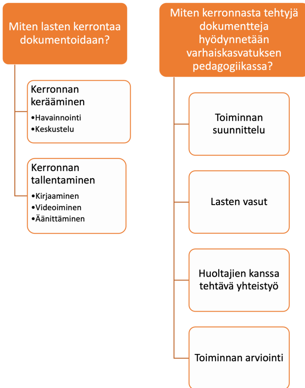
Kuva 2. Teemat tutkimuskysymyksittäin