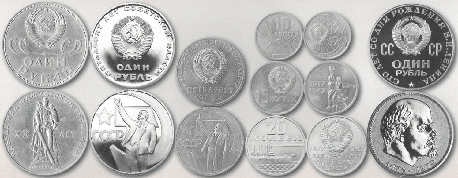
Kuva 12. Neuvostoliiton vuosien 1965, 1967 ja 1979 käyttöjuhlarahat. Osaa näistä tunnetaan myös Prooflike- ja PROOF-laatuina, joista erityisesti vuoden 1970 Lenin-ruplan alkuperäinen PROOF-versio (jota tehtiin 3 000 kpl, kuvassa oikeassa reunassa) on nykyisin haluttu ja kallis (arvo noin 1 500 – 2 000 €).

Jälleen kuitenkin metallirahat säilyttivät rahanuodistuksesta huolimatta nimellisarvonsa mukaisen arvon, mutta vanhat seteli vaihdettiin uusiin mainitulla suhteella 10 vanhaa rupla = 1 uusi rupla. Uusi metallirahasarja sisälsi myös 50 kopeekan ja 1 ruplan metallirahat, joita ei oltu laskettu liikkeelle sitten 20-luvun. Vuoden 1961 rahanuodistuksen myötä myöskin Neuvostoliiton rupla devalvoitiin 55 5/9 %