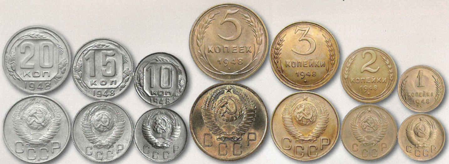
Neuvostoliiton uusittu metallirahasarja mallia 1948 – 1956. Muutos edelliseen on tunnuspuolen 16-nauhainen (8 + 7 + 1) vaakuna.

Rahanuudistuksen myötä oli jälleen aika myös uudistaa seteli- ja metallirahat. Neuvostotasavaltoja oli tullut lisää, ja mallien 1937 ja 1938 synkeistä ja raivoisan inflaation heikentämistä seteleistä oli aika luopua. Mallien 1937 - 1938 sota-