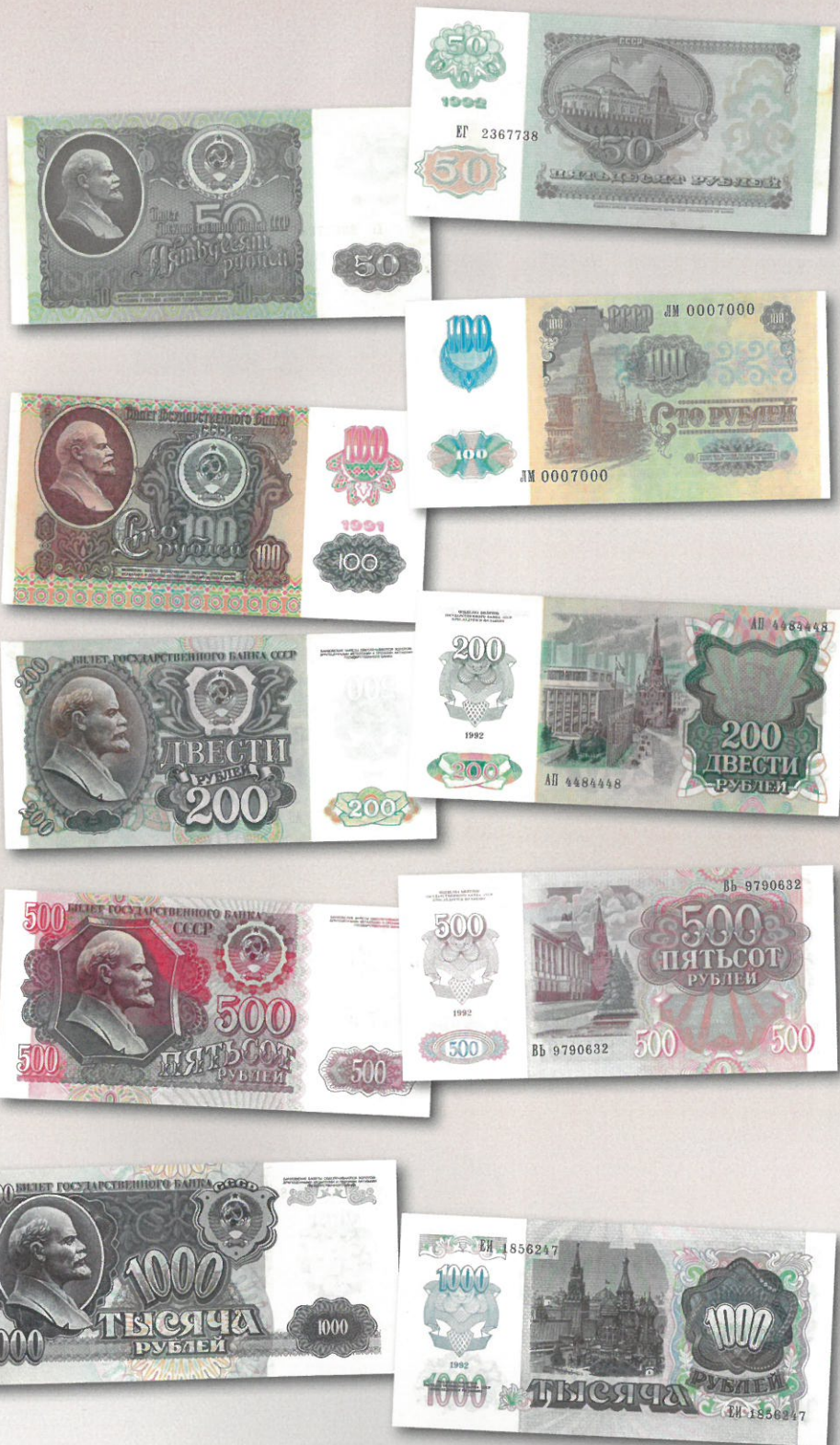
Neuvostoliiton viimeiset setelit, eli 50, 100, 200, 500 ja 1 000 ruplan valtionpankin (Bilet Gosudarstvennogo Banka SSSR) setelit mallia 1991/1992. Huomatkaa monikielisen arvomerkin poistuminen myös 50 ja 100 ruplan seteleistä.

Viimeiset nullistikset Neuvostoliiton setelistössä tapahtuivat 22. tammikuuta 1991, jolloin yrityksenä taisella riehaantunutta inflaatiota vastaan ja suitsia laitonta kauppaa mallin 1961 50 ja 100 ruplan setelit julistettiin mitättömiksi ja niitä vaihdettiin 23. - 25. tammikuuta (keskiviikosta perjantaihin) uusiin mallin 1991 seteleihin vain 1 000 ruplaa per henkilö. Myös tililtä otot rajoitettiin korkeintaan 500 ruplaan kuukaudessa. Seurauksena tästä oli luonnollisesti asianmukainen kaaos ja sekasorto. Vaikkakin noin 14 miljardia ruplaa käteistä rahaa saatiin poistettua rahamarkkinoilta, johti tämä toimi valtavaan yleiseen epäluuloon hallintoa ja sen päätöksiä kohtaan ja pienellä viiveellä yhä pahenevaan inflaatioon. Huhtikuun 1991 alussa olivat hinnat 3 – 4 kertaistuneet, mutta palkat nousivat samassa ajassa vain 20 – 30 %.