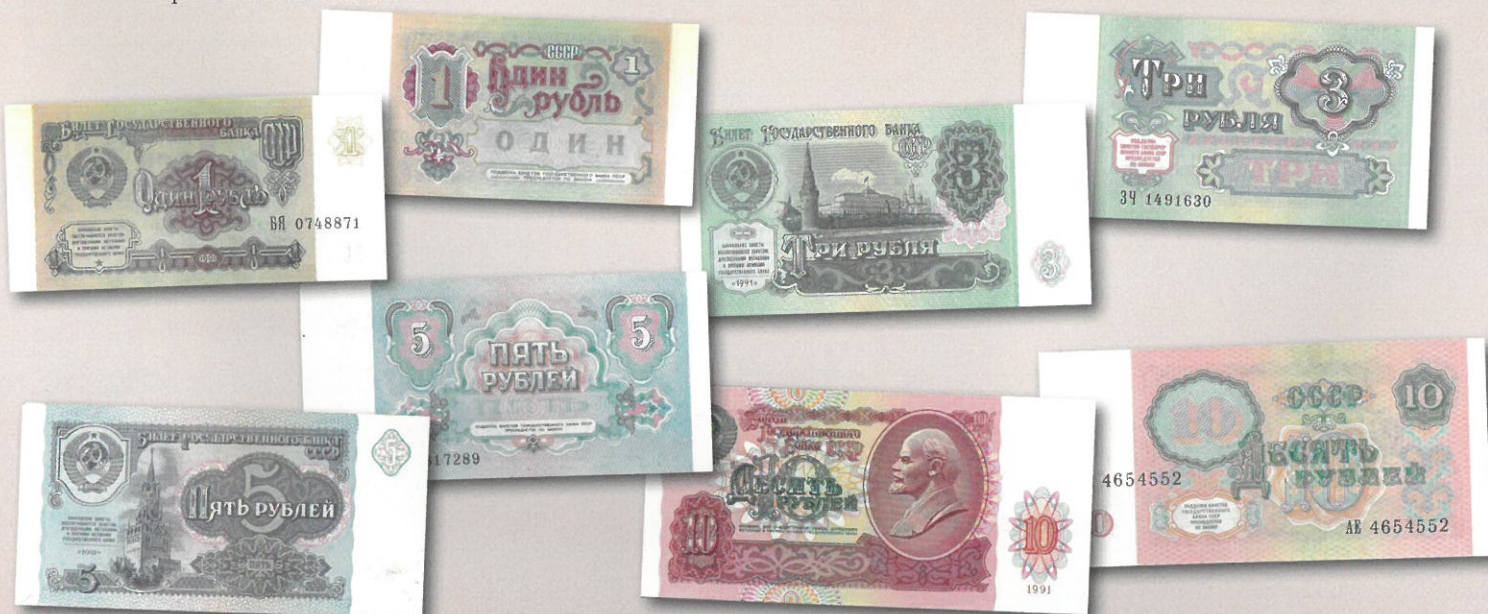
Neuvostoliiton 1, 3, 5 ja 10 ruplan valtionpankin (Bilet Gosudarstvennogo Banka SSSR) setelit mallia 1991. Huomatkaa monikielisen arvomerkinnän poistuminen ja korvautuminen venäjänkielillä väärentämisen lainvastaisuudesta kertovilla teksteillä.

sia, kultaisia, platinaisia ja palladiumisia sijoitus- ja juhlarahoja ja jopa niiden uusintalyöntejä. Huippuna vuoden 1980 olympialaiset, joiden kunniaksi laskettiin liikkeelle 6 kuparinikkelistä, 28 hopeista, 6 kultaista ja 5 platinaista juhlarahaa, kaikki niin normaali- kuin kiiltolyöntisiä. Näihin emme pureudu tämän enem- pää tässä artikkelissa.