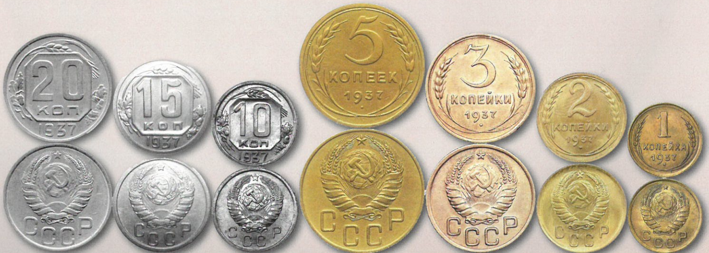
Neuvostoliiton metallirahat mallia 1937 – 1946. Huomatkaa vaakunapuolen 11 naubaa: 5 + 5 sivuilla sekä 1 alhaalla keskellä.

Suomalaisille ovat mallien 1937 ja 1938 setelit tulleet hyvin tutuiksi sen vuoksi, että niin talvi- kuin jatkosodan aikana rintamalla palvelleet suomalaiset sotilaat keräsivät kaatuneilta neuvosto-