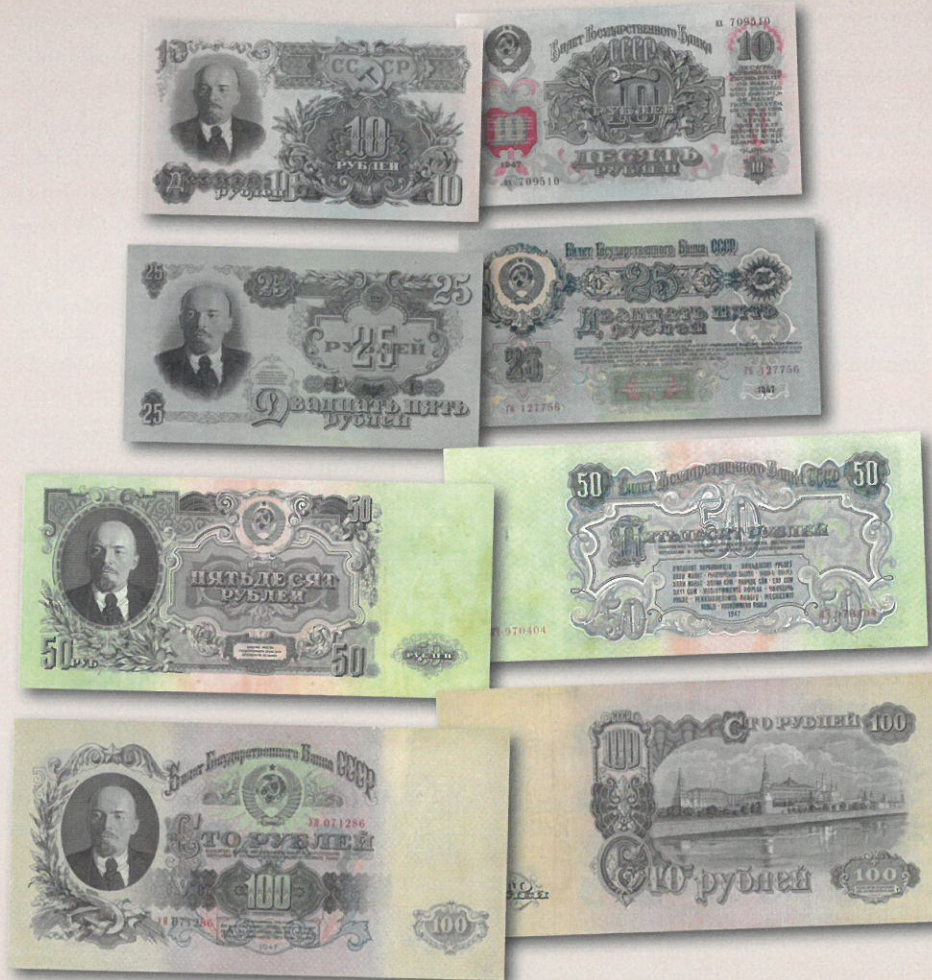
Vuoden 1947 10, 25, 50 ja 100 ruplan valtionpankin (Bilet Gosudarstvennogo Banka SSSR) setelit. Mallin 1947 täysi setelisarja 1 – 100 ruplaa loistokuntoisena maksaa yli 1 000 €. Mallin 1957 setelisarja (ilman suomenkielistä arvomerkintää) on samanhintainen, mutta mallin 1957 setelisarja päällepainamalla ОБРАЗЕЦ (malli tai specimen) on noin 300 € arvoinen.

Joulukuussa 1947 toteutettiin raha-reformi luomalla uusi 1 000 vanhaa ruplaa vastaava uusi rupla. Näin saatiin sotainflaation paisuttamat hinnat taas järkevälle tolalle. Tämän lisäksi sotatalouden inflaatioita rahataloutta suitsittiin leikkamalla pankkitalletuksia siten, että 3 000 – 10 000 vanhan ruplan pankkitalletukset vaihdettiin uusiin rupliin 30 % arvoneikkauksella ja yli 10 000 vanhan ruplan pankkitalletukset vaihdettiin uusiin rupliin 50 % arvoneikkauksella. Pienet alle 3 000 vanhan ruplan talletukset vaihdettiin uusiin rupliin ilman arvonalennusta. Samassa yhteydessä rupla sidottiin ainakin välillisesti Bretton Woodsin sopimukseen ja Yhdysvaltojen kultadollariin suhteessa 100 USD = 40 Neuvostoliiton ruplaa. Neuvostorupla vastasi siis teoriassa 2,50 USA:n dollaria.