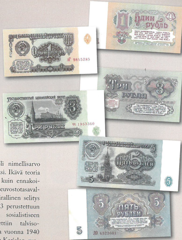
Neuvostoliiton mallin 1961 1, 3 ja 5 ruplan valtiolliset kassasetelirahat (Gosudarstvennii Kasnatseiskii Bilet SSSR).

arvomerkinäosuudessa oli nimellisarvo kerrottu myöskin suomeksi. Ikävä teoria on, että seteleissä ikään kuin ennakoitiin Suomen liittyvän neuvostotasavaltaan Neuvostoliittoon. Virallinen selitys on, että kun vuonna 1923 perustettuun Karjalan autonomiseen sosialistiseen neuvostotasavaltaan liitettiin talvisodan rauhanehtojen nojalla vuonna 1940 Neuvostoliitolle luovutettu Karjalan, syntyi Karjalais-suomalainen sosialistinen neuvostotasavalta ja suomalainen teksti lisättiin tämän vuoksi mallin 1947 seteleihin.