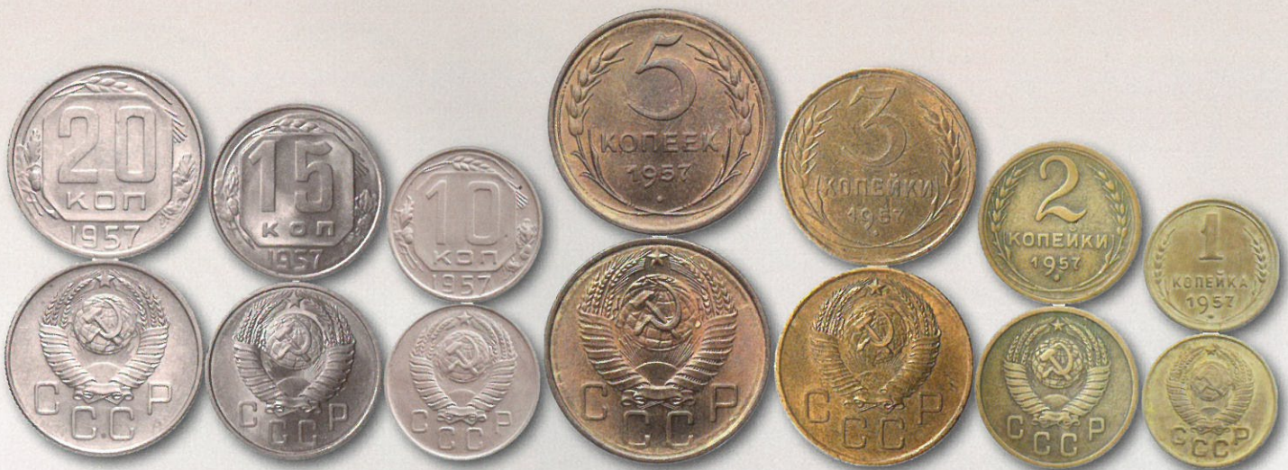
Neuvostoliiton uusittu metallirahasarja mallia 1957. Muutos edelliseen on tunnuspuolen 15-naubainen (7 + 7 + 1) vaakuna.