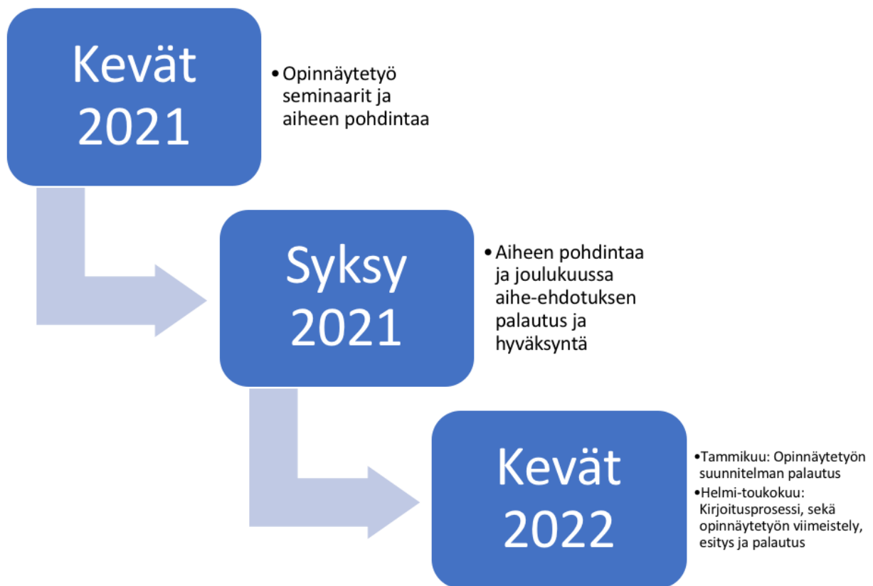
Kuvio 1. Produktin aikataulu

Kirjoittajan tavoite oli jakaa työn tekeminen kolmelle kuukaudelle, eli noin 13 viikolle. Kuitenkin ajoittaisten työkiireiden ja väsymyksen myötä oli aika ajoin haastavaa saada viikonloppuisin opinnäytetyötä tehtyä, jonka vuoksi iso osa opinnäytetyön työmäärästä jäi viimeiselle kuukaudelle, jolloin kirjoittaja oli varannut työstään viikon vapaaksi kirjoittamista varten. Alkuperäisestä aikataulusta opinnäytetyön palautus myöhästyi noin kuukaudella. Tähän kirjoittaja oli kuitenkin tyytyväinen, sillä se ei siirtänyt aiottua valmistumispäivämäärää. Opinnäytetyö valmistui toukokuun lopussa ja se esitettiin 30. Toukokuuta. Alla oleva Kuvio 1 kuvaa kirjoittajan produktin aikataulua ja etenemistä.