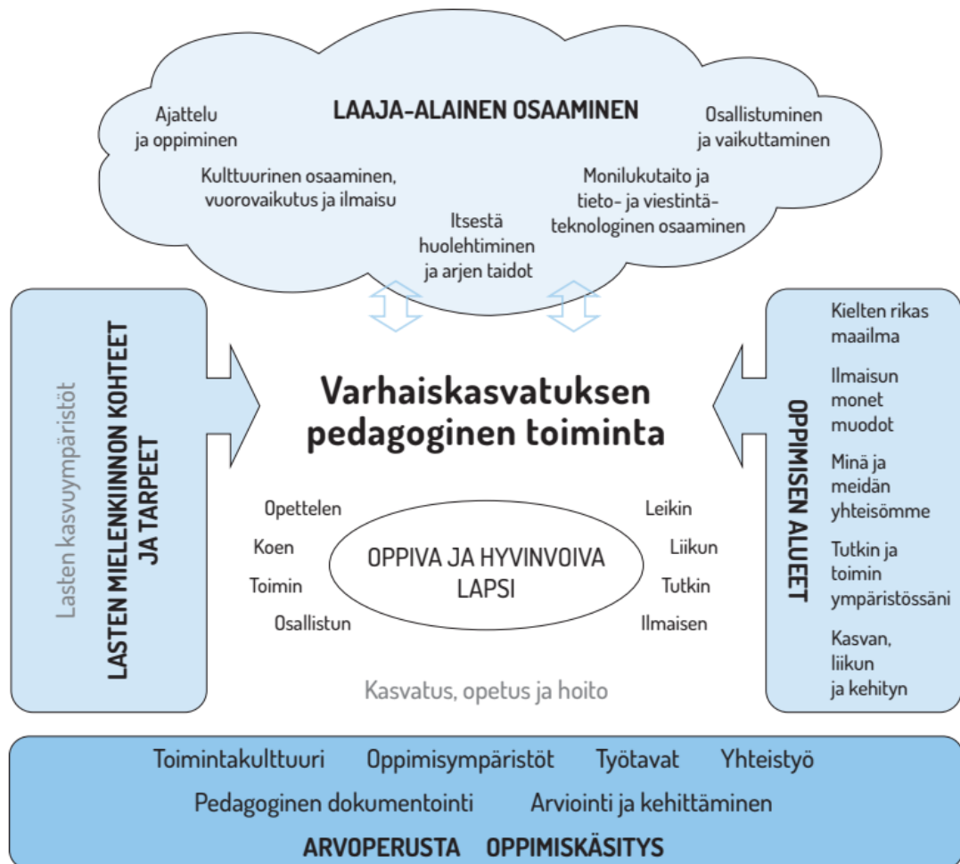
Kuvio 1. Varhaiskasvatuksen pedagogisen toiminnan viitekehys (Opetushallitus 2018, 36.)

Varhaiskasvatukseen kuuluu erilaisia tavoitteita. Tavoitteet on määritelty varhaiskasvatuslaissa (540/2018), johon on listattu varhaiskasvatukselle kymmenen erilaista tavoitetta. Tavoitteiden tehtävänä on ohjata varhaiskasvatuksen perusteiden sekä varhaiskasvatussuunnitelmien laadintaa, toteutusta sekä arviointia. (Opetushallitus 2018, 15.) Varhaiskasvatuksen tavoitteena on esimerkiksi turvata jokaiselle lapselle hyvä ja turvallinen varhaiskasvatusympäristö, jossa lapsella on mahdollisuus kehittyä sekä oppia monipuolisesti sekä kokonaisvaltaisesti. Tavoitteena on myös huomioida jokainen lapsi yksilönä sekä mahdollistaa lapsen osallisuus eri tilanteissa. Varhaiskasvatuksessa tulee tukea vuorovaikutustaitoja, yhteistyötä huoltajien kanssa, sekä huomioida yhdenvertaisuus sekä tasa-arvo. (Varhaiskasvatuslaki 540/2018, 3 §.)