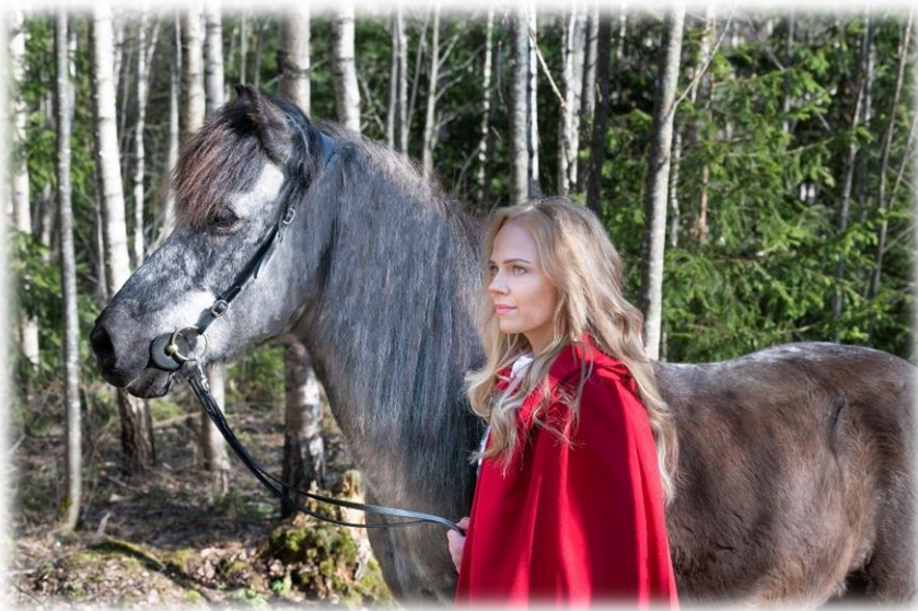
Kuva 4. Punahilkka lähdössä matkalle (Leporanta, 2022)

Toisinaan unohdamme itsestämme asioita elääksemme sellaista elämää mitä emme todellisuudessa halua elää. Vuosi sitten katsoin Punahilkka-kuvaa itsestäni ja huokaisin mielessäni, miksi hyvät tarinat aina loppuvat kesken. Produktia tehdessä ymmärsin, vain ihminen itse estää itseään elämästä sellaista tarinaa mitä todellisuudessa haluaa elää.