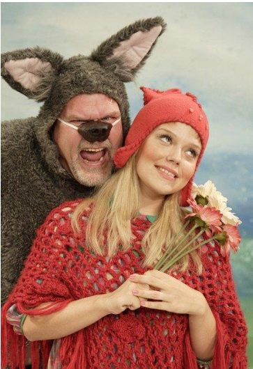
Kuva 1. Hilikka ja Punahilkka (Likonen, 2011)

Produktin tarinallinen tyyli on lähtöisin sadusta Punahilkka. Tarinallinen tyyli podcastiin löytyi omasta uratarinasta Punahilkkan roolista näytelmästä Hilikka ja Punahilkka. (Jarmo Harjula, 2006). Monien vuosien jälkeen oli aika herättää Punahilkkan rooli uudelleen henkiin. Tässä produktissa Punahilkka ei tapaa sutta vaan jotain aivan muuta.