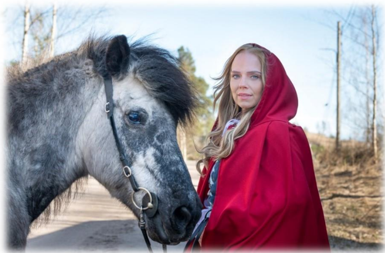
Kuva 8. Perillä (Leporanta, 2022)

Perraultin Punahilkka-sadun versiossa lienee moraalinen opetus siitä, miten kilttien tyttöjen ei pidä uskoa kaikkia pahoja setiä, jotka tielle osuu, muuten hukka heidät perii. (jyu2008). Moraalisen opetuksen voi jokainen tulkita itse, mutta rohkeus palkitaan aina , lienee paras itselleni. Toisinaan vaatii rohkeutta laittaa ylle punainen hilkka ja astua tuntemattomaan.