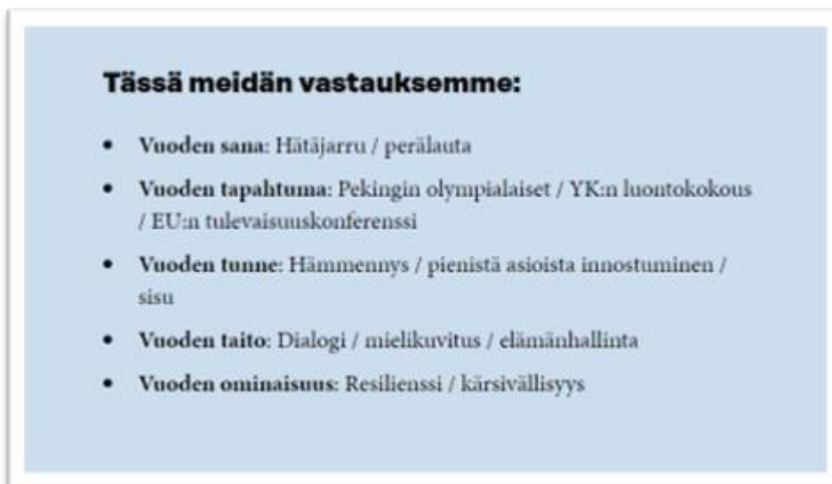
Kuva 2. Vuoden puheenaiheet (Sitra s.a.)

Dialogi on tullut esille vuonna 2022 Suomen presidentti Sauli Niinistön uudenvuodenpuheessa sekä Sitran futuristien esittämänä. Sitra esitti vuoden taidoksi dialogin, mielikuvituksen ja elämönhallinnan. Uudenvuodenpuheessa Niinistö totesi ” Viime kädessä maltti, vastuullisuus ja dialogi ovat ainoat tiet eteenpäin.” (Niinistö, 2022). Niinistö viittasi tällä Venäjän aikaisempiin vaatimuksiin ja ukaaseihin Yhdysvalloille ja Natolle. Samaisessa uudenvuodenpuheessa Niinistö korosti toiseuden ymmärtämistä ja nöyryymistä korkeimpien arvojen edessä. Päätin nostaa dialogisen kohtaamisen esille työssäni ja toteuttaa haastattelut dialogisessa haastattelussa. Dialogi antoi mahdollisuuden saada syvemmän ymmärryksen podcast-jakson vieraan urasta ja tähän liittyvistä tekijöistä.