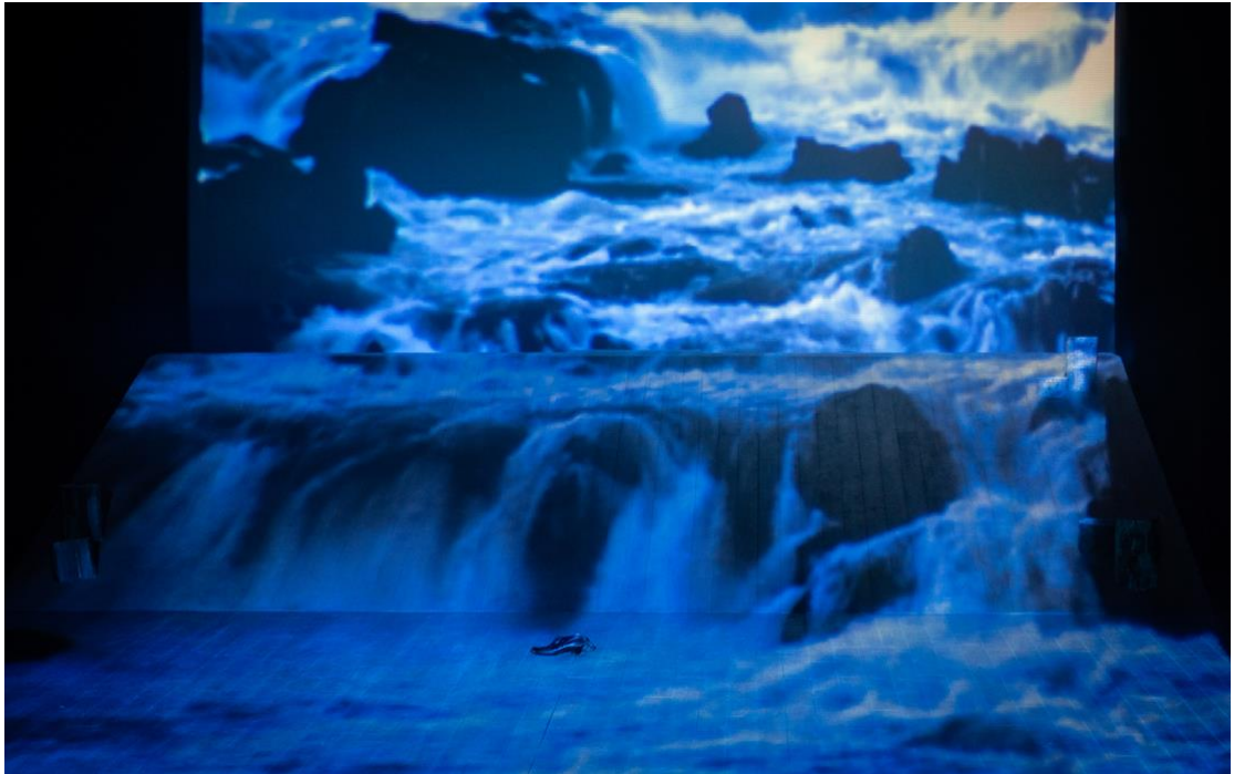
Kuva 4. Kuokuva koski projisoituna näyttämölle ja Sysi-Pertun kenkä

kirjeessään kirjoittanut, että toivoo Pietolan ottavan Kustaan omaksi pojakseen. Pietola sanoo toteuttavansa Sysi-Pertun toiveen. Kustaa on mäellä leikkimässä pyssyllä ja sen kuultua hän innostuu ja ampuu vahingossa pyssyllä ilmaan. Kaikki loput kyläläiset saapuvat laukauksen kuultuaan ja nauravat tilanteelle. Jopa uskonsisaret kääntyvät Rättäriä vastaan ja ajavat hänet ulos, jonka jälkeen poliisi nappaa Rättärin. Näytelmä päättyy hääjuhlaan, jossa Turkka ja Katri, Anni ja Huotari sekä Tolari ja Maija menevät naimisiin Tuulan tei kappaleen saattelemana.