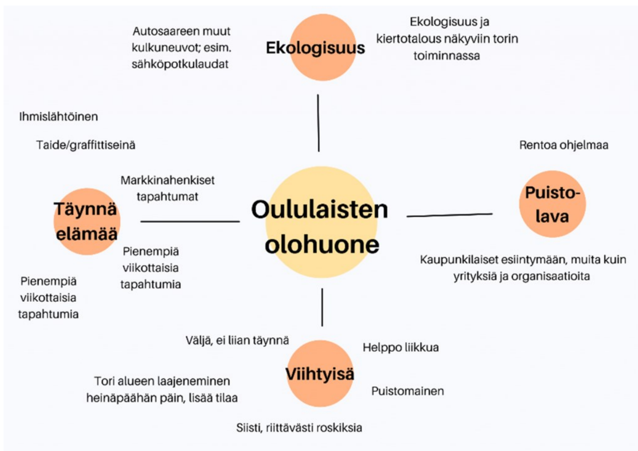
KUVIO 2. Työpajassa syntyneet ideat torin viihtyvyyden kehittämiseksi.

Toisena selkeänä teemana nousi tori ajanviettopaikkana, ”kaupunkilaisten olohuoneena” (kuvio 2). Kesäaikaan tori koettiin tunnelmalliseksi ja viihtyisäksi.