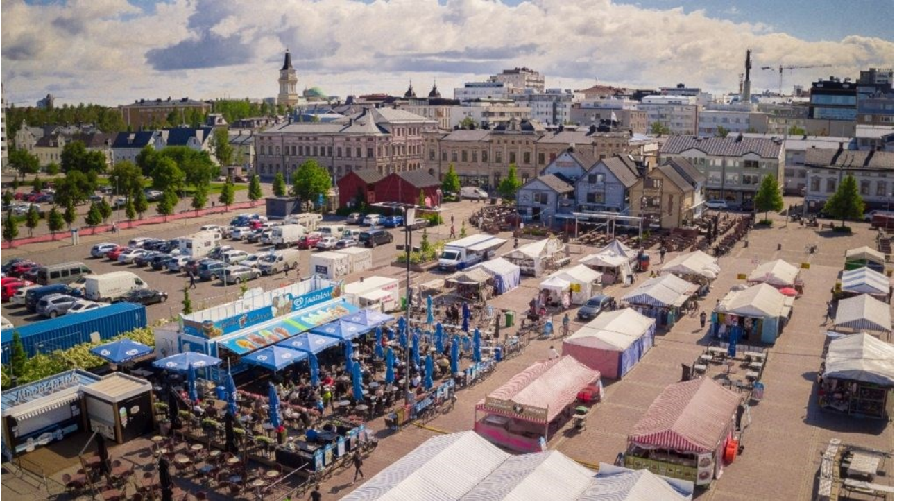
KUVA 1. Oulun torialue kesällä 2020.