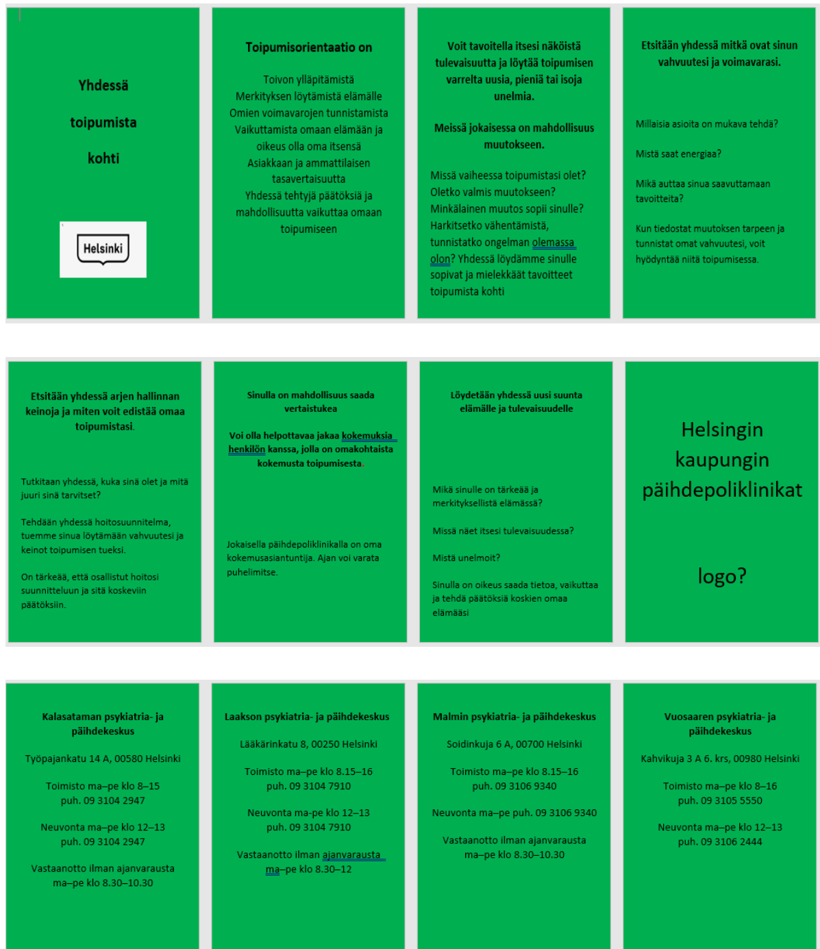
Kuva 2: Esitteen asiasisältö.

Toimeksiantajan toive oli, että esite on selkeä, helppolukuinen, pienikokoinen ja helposti asiakkaan sisäistettävissä. Lähdimme suunnittelemaan haitarimallista esitettä, jossa on kuusi sivua. Esite suunniteltiin kokoon A7. Esitteen värimaailma ja visuaalinen ilme määräytyy Helsingin kaupungin visuaalisen ilmeen ohjeistuksen mukaan. Käytettävissämme oli useita eri väri vaihtoehtoja ja graafisia elementtejä. Teksti muotoiltiin kohderyhmän tarpeiden mukaan selkeäksi, kiinnostavaksi ja mielenkiintoa herättäväksi.