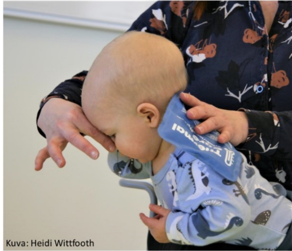
Kuva: Heidi Wittfooth