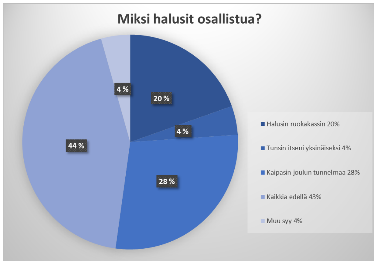
Kuvio 2. Miksi halusit osallistua?

Toinen kysymys koskien osallistujien syitä osallistua tapahtumaan.