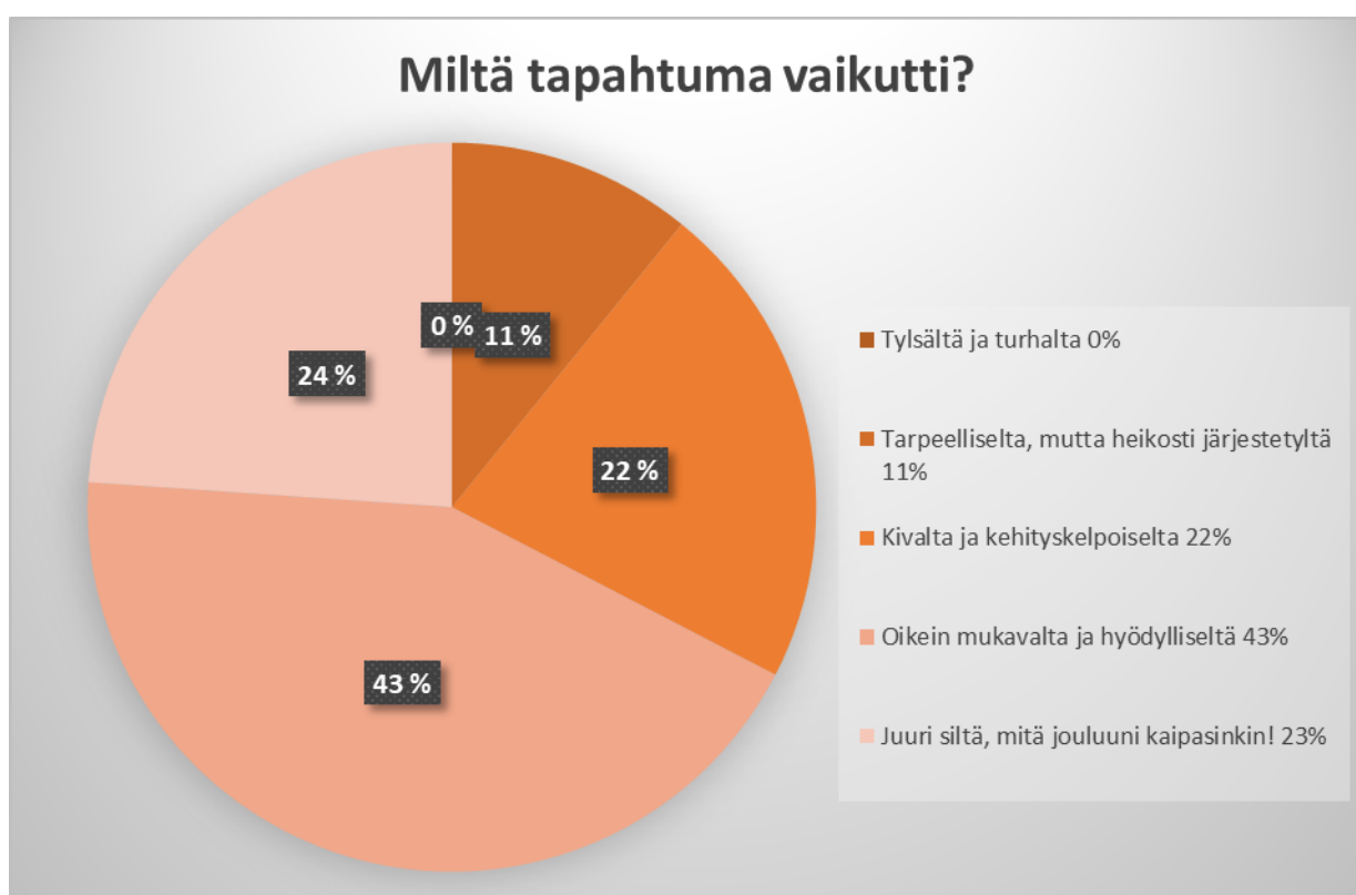
Kuvio 1. Miltä tapahtuma vaikutti?

Ensimmäisessä kysymyksessä kysyttiin miltä tapahtuma vaikutti.