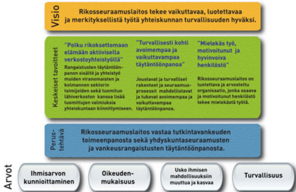
KUVIO 1. Rikosseuraamuslaitoksen strategia 2011-2020 (Rikosseuraamuslaitos).