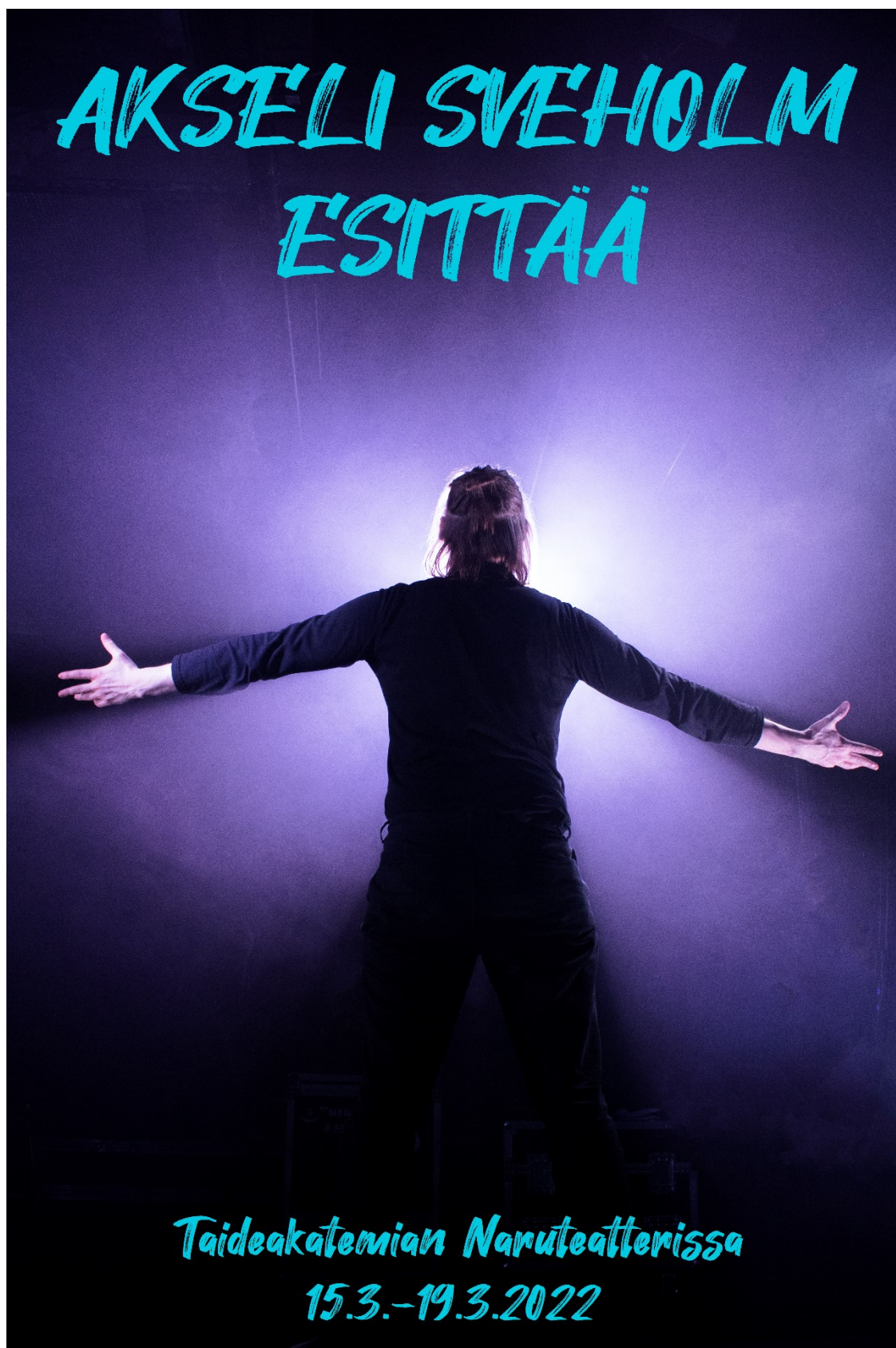
Kuva 3. Taiteellisen opinnäytetyöni juliste.