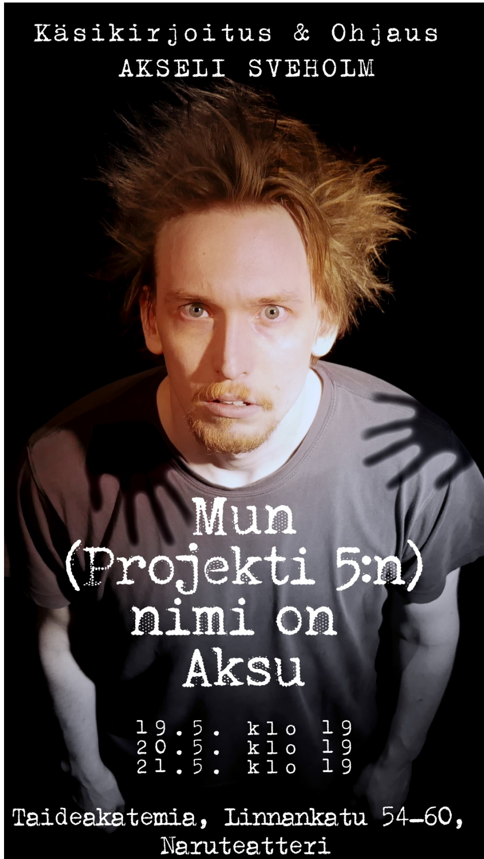
Kuva 1. Ensimmäisen sooloesitykseni juliste.