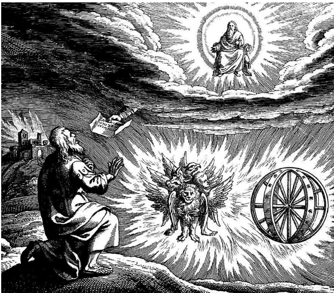
Kuva 5. Jumala ilmestyy Hesekielille. Matthaeus Merian (1593-1650), 'Icones Biblicae.' Yksi kuvista, jotka vilahtivat sarjana Deus-Aksun ilmestyessä.

Nämä elämän isot aiheet lisäsivät haastetta saada Deus-Aksun kohtauksiin jonkinlainen läpikulkeva logiikka ja järki. Lopulta päätin jättää logiikan tarkoituksella epäselväksi ja avoimeksi. Yleisö voi itse yrittää löytää vastauksia auki jätettyihin kysymyksiin. Jos Deus-Aksu on menneisyydestä, niin eikö kaikki mitä hän tekee, ole jo tehty? Miten hän voi vastata kysymyksiin, jotka kysytään häneltä vasta kuukausien päästä, vai tietääkö hän kaikki kysymykset etukäteen? Onko hahmojen teot ja ajatukset päätetty ennalta vai onko heillä vapaata tahtoa päättää teoistaan? Jos kaikki on jo päätetty ennalta, onko valinnoilla väliä? Ovatko ne silloin valintoja? Onko tässä kohtauksessa mitään järkeä? Onko Aksussa mitään järkeä?