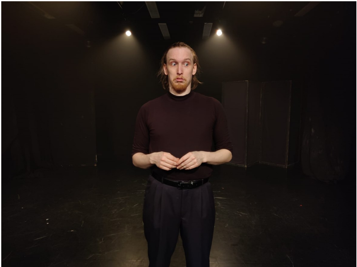
Kuva 4. Kauhistuneen epäilevä Protagonisti-Aksu yleisön edessä. Kuva: Milja Nordström.

hyväksynnän. Valaistuminen ei tule tekojen vaan armon ja rakkauden kautta toteutetun introspektiivisen pohdinnan kautta. Tämän jälkeen näytelmä demonstroi Protagonisti-Aksun ja Äänen valtasuhteen muuttumista tasapainoisemmaksi ja rauhallisemmaksi. Kaksikko hakeutuu jonkinlaiseen symbioottiseen vallan tasapainoon, jossa kumpikin ymmärtää toisensa halut ja pelot, eikä kummallakaan ole absoluuttista yläasemaa toiseen. Hei eivät pääse toisistaan eroon, mutta he silti tarvitsevat toisiaan toimiakseen. Kun he ovat saavuttaneet tämän tasapainon, Aksu ja Ääni eivät enää puhu toisilleen "sä" ja "mä", vaan "me". Aww... Söpöä.