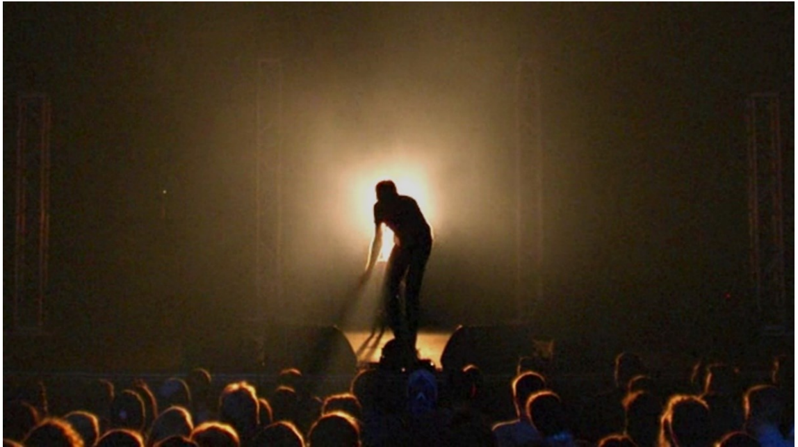
Kuva 7. Bo Burnham, "Make Happy"-Netflix-spesiaalissa esittämässä kappaleensa "I Don't Think I Can Handle This Right Now".