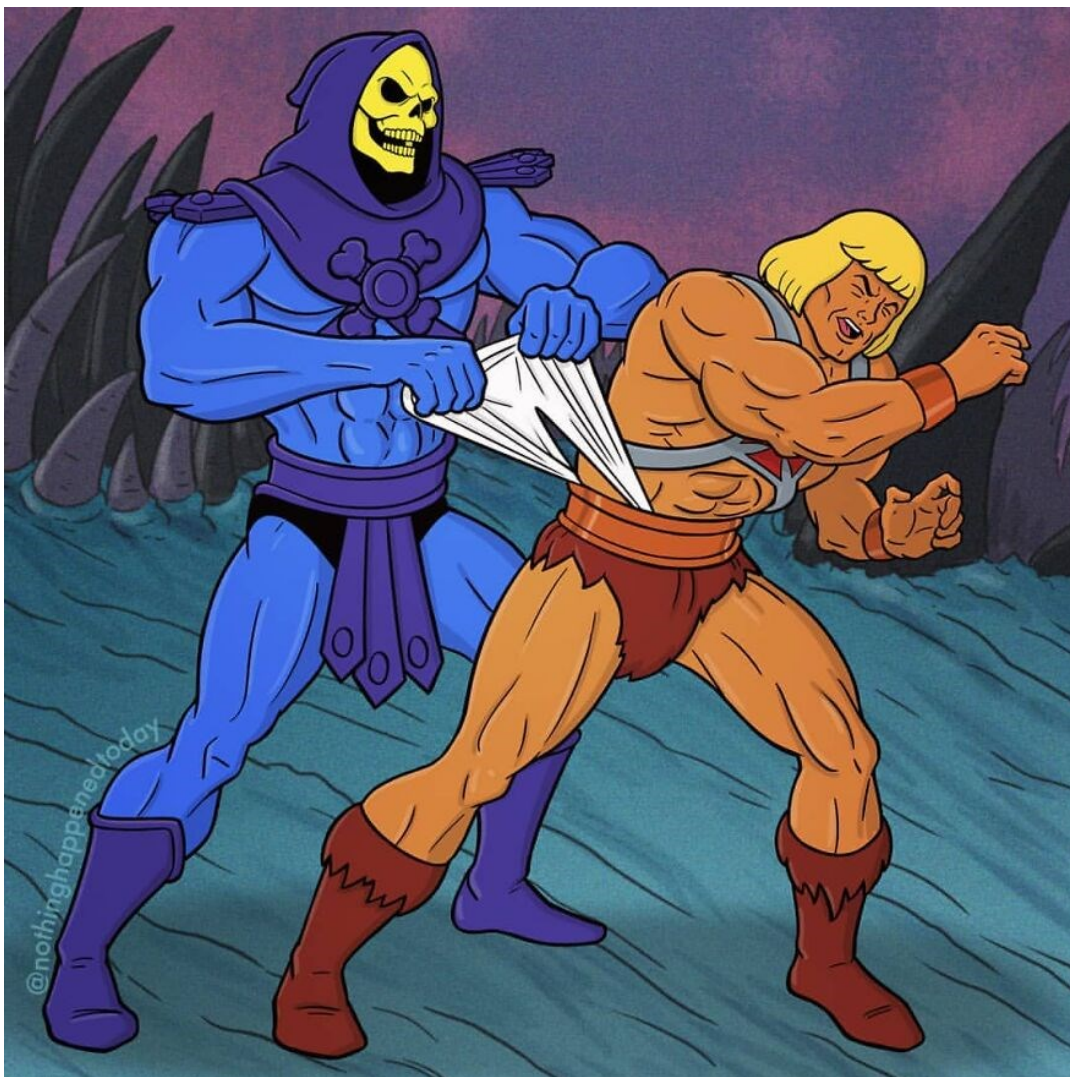
Kuva 6. He-Manin (oik.) ja Skeletorin (vas.) ikoninen ja eepinen kamppailu toisiaan vastaan on jatkunut popkulttuurissa jo 80-luvulta alkaen.