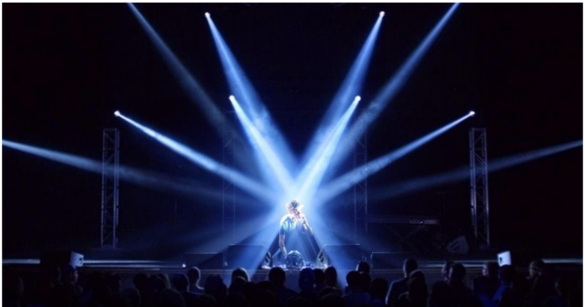
Kuva 8. Bo Burnham, "Make Happy"-Netflix-spesiaalissa edelleen esittämässä kappaleensa "I Don't Think I Can Handle This Right Now".