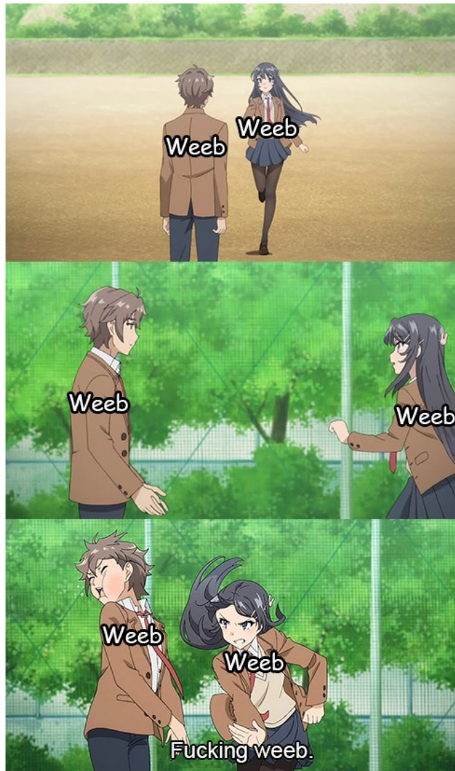
Kuva 9. Internetmeemi weebeistä.